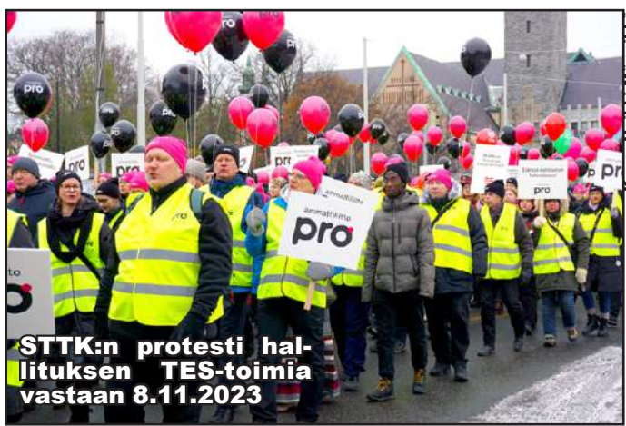
STTK:n protesti hallituksen TES-toimia vastaan 8.11.2023

Orpon hallitus tulee iskemään köyhiä ja duunareita. Hallitusneuvotteluissa esitettiin 6 miljardin leikkauksia. Purra sanoo, että vielä tarvitaan 1,5-2 miljardin "sopeutukset". Tavoitte on heikentää Ay-liikettä. Yritetään rajoittaa lakko-oikeutta ja kieltää mm. poliittiset- ja tukilakot. Työttömyysturvaa heikennetään. "Suomen mallia" yritetään toteuttaa lainsäädännöllä. Hallitus kieltäytyy neuvotteluista liittojen kanssa. Pitkin syksyä liitot ovat järjestäneet lakkotapahtumia. Jos hallitus ei taivu, ammattiliittojen ainoa mahdollisuus on yleislakko. Varaudutaan siihen. Sivut 2, 4 ja 5