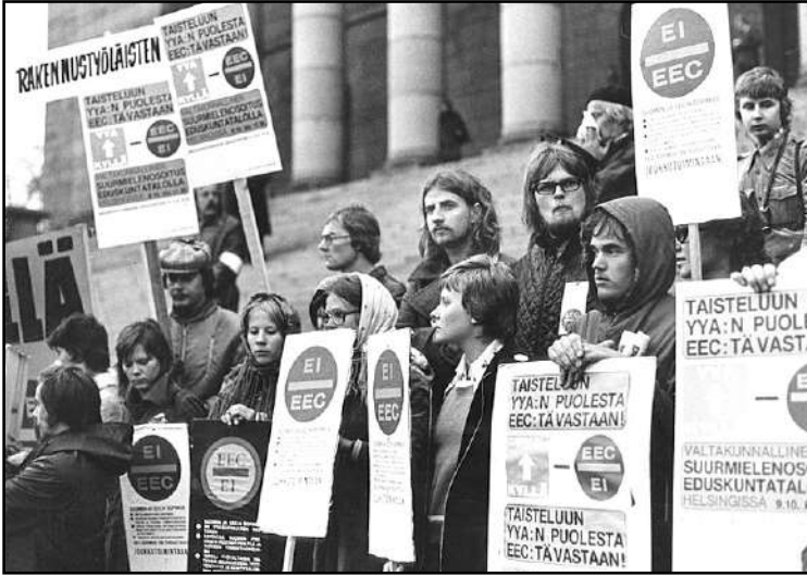
Eduskuntatalolla v. 1973 protesti EEC:ä vastaan. Jo silloin ymmärrettiin EEC:n keskeinen funktio, kun vaadittiin YYA:n puolesta EEC:ä vastaan. Kaikki ne pelot, joista silloin varoitettiin, ovat toteutuneet.

Suomen ja Euroopan talousyhteisön (EEC) välisen vapaakauppasopimuksen solmimisesta tuli kuluvana syksynä kuluneeksi 50-vuotta. Varsinaisesti sopimus astui voimaan vuoden 1974 alusta. EEC-sopimuksen valmistelu ja siitä Suomessa käyty keskustelu toimivat eräällä tavalla Suomen lännentien päänaajana. EEC-vapaakauppasopimusta kannattivat pääoma- ja työnantajapiirien lisäksi kaikki porvaripuolueet ja sosiaalidemokraattien oikeistosiipi. EEC-vapaakauppasopimusta vastustivat ja Suomen taloudellista riippumattomuutta ja itsenäisyyttä kannattivat poliittisen vasemmiston, SKDL-SKP:n lisäksi suuri joukko suomalaisen kulttuuri- ja tiede-elämän eturivin vaikuttajia.