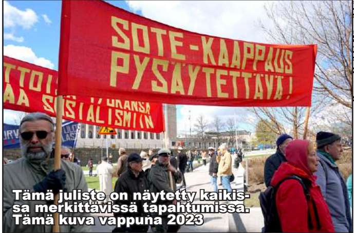
Tämä juliste on näytetty kaikissa merkittävissä tapahtumissa. Tämä kuva vappuna 2023

Meillä oli hyvä Sote-järjestelmä. Vuonna 1972 saatiin kansanterveyslaki ja sen mukana saatiin terveyskeskukset. Kuntapohjainen Sote on ollut useiden kansainvälisten selvitysten mukaan kustannustehokas järjestelmä. Sitten sen ympärillä alettiin rakentaa muutoksia, joita kansa ei ollenkaan halunnut. Sote-alaa valmisteltiin yksityistämiseksi. SOTE oli kultakivos yksityisille terveysalan firmoille. Sipilän ja Marinin työtä jatkaa Orpon jengi. Soten joutuminen kokonaan yksityisten terveysalan firmojen haltuun voidaan vielä pysäyttää, ennen kuin vuoroon tulevat vesi ja ilma. Sivu 5