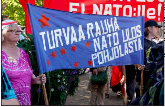
Tämä tunnus näytettiin, koska oli tiedossa, että Nato pyrkii laajentumaan koko Skandinaviaan voidakseen uhata Pietaria ja Muurmanskia. Emme erehtyneet.

Alueellisesti suuressa osassa ja suuressa merkityksessä näissä sotaharjoituksissa tulee olemaan kalottialue eli Suomessa Lappi. Pohjoisimman Suomen alueella on kaksi Naton kannalta erityisen merkittävää sotilastukikohtaa, Lapin lennosto Rovaniemellä ja Jääkäriprikaati Sodankylässä. Jääkäriprikaatin esikunta on siirretty Rovaniemelle. Näiden lisäksi