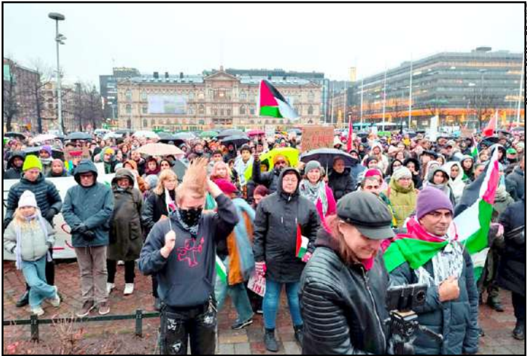
Kulkue kokoontui Rautatientorille ja siirtyi sitten Eduskuntatalolle.

Maailmalla on protestoitu tiuhaan Gazan tilanteen vuoksi, ja mielenosoituksia on nähty viime aikoina myös monessa suomalaisessa kaupungissa. Lauantaina 11. marraskuuta Helsingin keskustassa järjestettyyn mielenosoitukseen osallistui poliisin ja Amnestyn arvioiden mukaan noin 3 000 ihmistä.