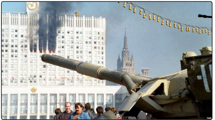
Neuvostojen talo (Valkoinen talo) tykkätulen alkuvaiheessa.

Mutta myös psykologinen tekijä arvioitiin väärin. Eräänlaisen huuman vallassa Valkoisen talon johtajat unohtivat sen, että TV-kes-