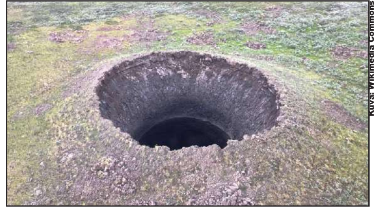
Jamalin niemimaalla sekä muuallakin ikiroudan alueella ilmaantua kraatereita, joiden syyksi paljastui ilmaston lämpenemisen aiheuttama metaanitaskujen purkautuminen. Hälyttävää ilmiötä osattiin ennustaa. Metaani on voimakas ilmastonmuutosta nopeuttava kasvihuonekaasu.

Fossiilienergia helpottaa ratkaisevasti myös abstraktin ajan tuottamista konkreettisen kustannuksel-