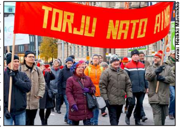
Tämä juliste tehtiin, koska haluttiin sanoa, ettemme missään olosuhteissa voi hyväksyä Nato-jäsenyyttä. Rauhansuomalaisilla 2016 se jo herätti vastarintaa, koska rauhantapahtuman puhujaksi pyydetty Elisabeth Rehn ei pitänyt siitä. Me vaadimme maamme eroa Nato-sotaliitosta siihen saakka, kun tämä tapahtuu.

Tällaisia, uusia Nato-velvoitteita tunnutaan pohjoisessa Suomessa täytettävän jo monilla tavoilla. Parhailaan Rovaniemen lentokenttää laajennetaan ja uusien hävittäjien vaatimaa infraa rakennetaan. Sodankylän varuskuntaa laajennettiin jo viime talvena. Nyt siellä on valmiina uudet tilat 300 sotilashenkilölle, vaikka prikaatia ei ole mitenkään