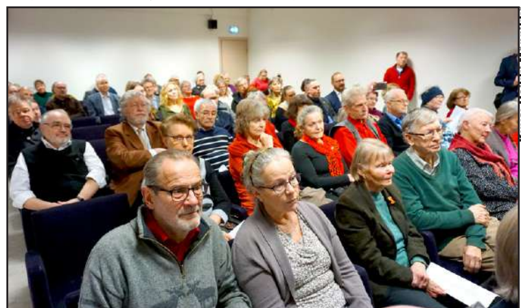
Yleisö kuunteli tarkkaavaisena suurlähettilään puhetta. Kaikki olivat tulleet kuulemaan uutisia, joita ei Mediapoolimme julkaise.

-Kuznetsovin puheenvuoron osa 2 seuraavassa numerossa KÄ 1/2024