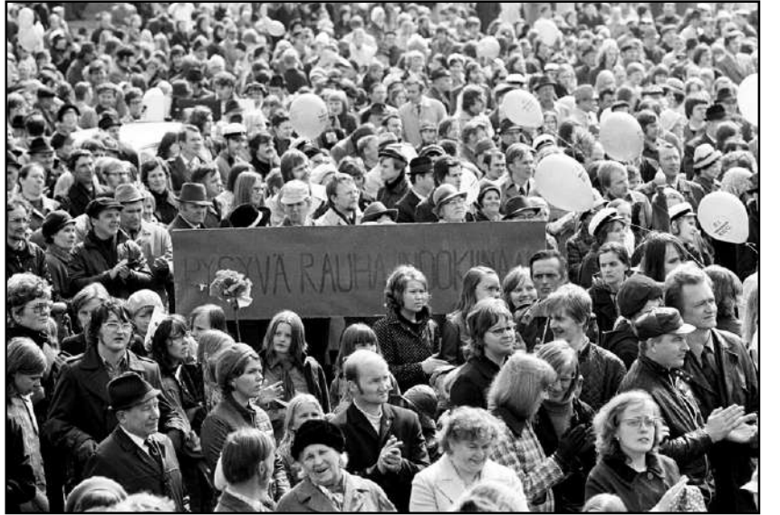
Kuvassa on meneillään SKDL:n vappujuhla v.1972 Helsingin Senaatintorilla. EEC:n vastustus näkyy selkeästi, koska kaikissa vappupalloissa lukee "Ei EEC"

Pääomapiirit kuvasivat EEC-vapaakauppasopimuksen ulkopuolelle jäämistä, kuten samat piirit kuvasivat 20-vuotta myöhemmin EU:n ulkopuolelle jäämistäkin, seurauksiltaan katastrofaaliseksi elintasollemme. EEC:n historiallisena taustana olivat tunnetusti toisen maailmansodan jälkeiset Yhdysvaltain sotilaalliset ja taloudelliset edut, sekä läntisessä Euroopassa pitkään jatkunut pääomien kasaantuminen ja keskittyminen, monopolikapitalismin vaihe. Maailmansotien jälkeinen amerikkalaisen kapitalismin ja dollarin ylivalta takasivat amerikkalaiselle pääomalle ylivoimaisen aseman suhteessa eurooppalaiseen pääomaan. Tämä mahdollisti Yhdysvalloille sen, että he kykenivät samalla alistamaan eurooppalaiset amerikkalaiselle kulttuuri-imperialismille ja