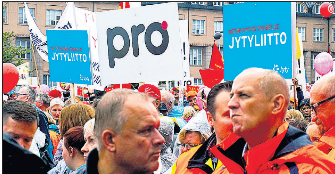
Helsingin Rautatien torille kokoontui 18.9. yli 30 000 ay-aktiivia protestoimaan SSS-jengin leikkauksipolitiikkaa. Ihmetystä herättivät ay-johtajien puheet, että leikkauksista tulee sopia yhdessä. Ay-johtoa muistutettiin siitä, että uusliberalismin raameissa ei löydetä kestävästä ratkaisusta. Nykypolitiikkaan tulee saada muutos.