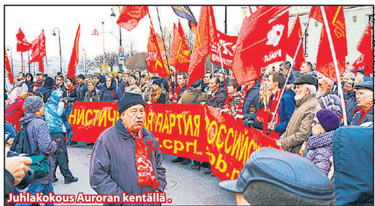
Juhlakokous Auroran kentällä.

KPRF:n kaupunkijärjestön edustajien kanssa osallistuttiin yhteiseen tiedotustilaisuuteen 8.11.2015. He kertoivat pyrkimyksistään kohottaa puolueen ideologista tasoa. Neu-