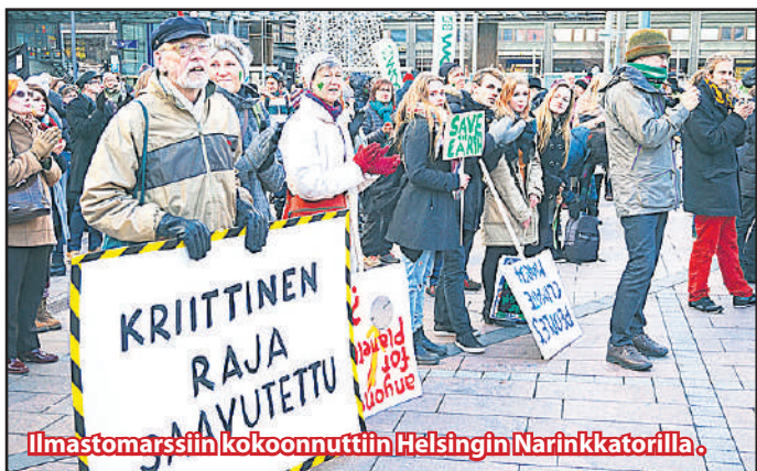
Ilmastomarsiiniin kokoonnuttiin Helsingin Narinkkatorilla.

Pariisin suuri ilmastofoorumi sopi 12.12.-15 sitovasti päästöjen vähentämisestä v. 2020 alkaen sekä keskilämpötilan nousun rajoittamisesta alle 2°C. Kriitikot toteavat, että tavoitteeseen pääsemiseksi 80 % maapallon fossiilisista olisi jätettävä maaperään. Miksi siis niiden hallinnasta edelleenkin soditaan? Tavoitteeseen pääsemiseksi tarvitaan liike, joka haastaa kapitalismin kasvulogiikan. Tulee puhkaista se yhteiskunnallinen räjähdysvoima, jota ilmastovalhe pidättelee.