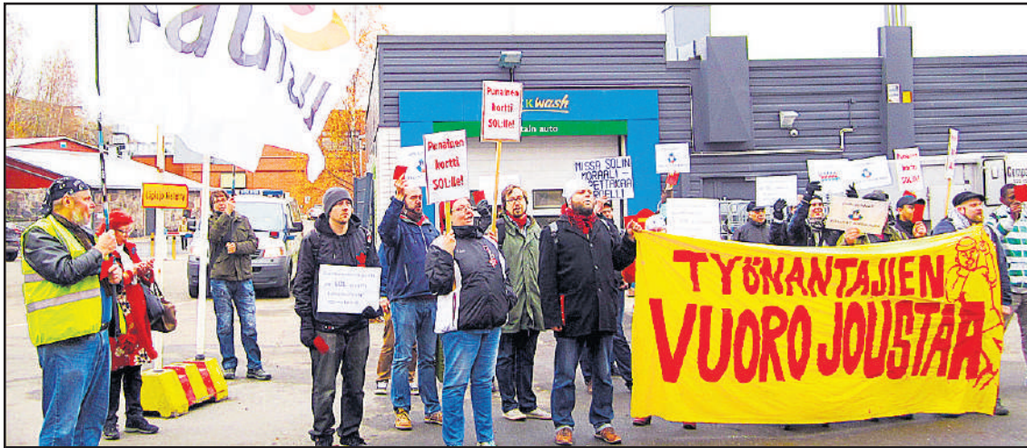
Postin Pasilan osaston nuorisosaasto kävi 6.11. SOL:n luona muistuttamassa työelämän pelisäännöistä.

Työnantajan yritys kaventaa postilaisten oikeuksia ei täysin onnistunut. Muussa tapauksessa olisivat heikennykset voineet ulottua ensi vuoden neuvotteluissa kaikkiin palkansaajiin. Posti - ja logistiikka-alan Unionin jäsenet (PAU) joutuivat työehtoja rajusti heikentävän kokeilun kohteeksi. Onnistuessaan työnantajan olisi ollut helpompi ulottaa vastaavat heikennykset koskemaan kaikkia työehtosopimuksia SSS-hallituksen ja EK:n tavoitteiden mukaisesti. SSS-hallituksen suunnitelmien toteuttamiseksi komennettiin Postin johto asialle. Pyrkimys lienee ollut uusien tuottojen toivossa alistaa Posti yhtiöittämiselle ja "vapaalle" kilpailulle.