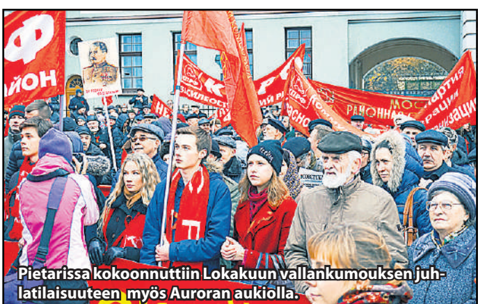
Pietarissa kokoonnuttiin Lokakuun vallankumouksen juhlailaisuuteen myös Auroran aukiolla.

Lokakuun vallankumous aloitti aikakauden, jossa pääoman oli mukauduttava maailman kansoille oikeutta tuovaan järjestykseen. Mutta sodat ja ryöstäminen ilmaantuivat uudelleen ja elämme jatkuvan kriisin aikaa. Tämä nähtiin Pietarissa 7.11. tapahtumissa. Pietarissa saattoi myös "rivien välistä" havaita, että on palautettava "tieteelliseen työväen valtaan" pohjautuva perusta. "Vain poliittiseksi voimaksi järjestäytyneet työtätekevät voivat luoda omaa politiikkaa."