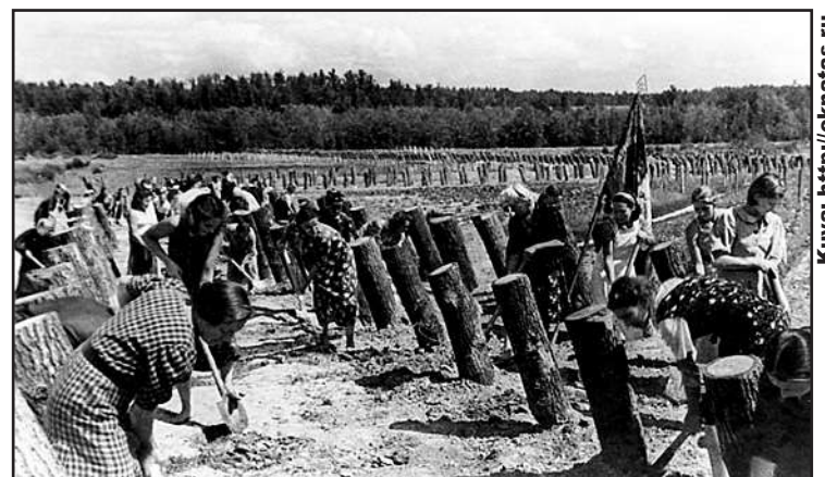
Moskovon asukkaat osallistuivat kaupungin puolustamiseen rakentamalla 1600 km panssariesteitä ja 30 000 tulipesäkettä. Paikallisissa ilmatorjunta-yksiköissä palveli 600 000 Moskovalaista