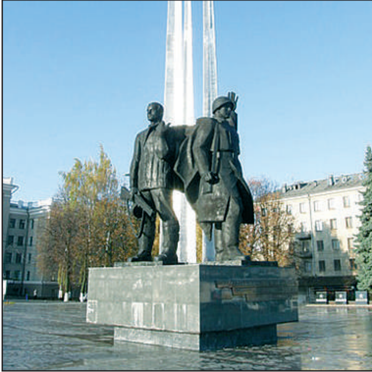
Tulan puolustajat torjuivat fasistien pääsyn kaupunkiin ja etenemisen Moskovaan

Taistelussa Kiovasta kärsi puna-armeija suuria menetyksiä ja Budjonnyin lounaissaunna viisi armeijaa joutuivat osittain saarroksiin, josta niiden osat vetäytyivät taistellen ulos. Vihollista kyettiin kuitenkin viivyttämään ja tuottamaan sille tappioita. Kiovan taisteluissa saksalaiset menettivät 100 000 sotilastaan (10 divisioonaa). Neuvostojoukot vetäytyivät Kiovasta 18.9.41 ja heti tämän jälkeen siirsivät fasistit voimiaan takaisin Moskovon suuntaan. Puna-armeijan sodanjohtaja, että torjuttuaan Smolenskissa fasistien yrityksen vallata Moskova suoralla hyökkäyksellä, siirsivät ne vain väliaikaisesti voimiaan etelään tukeakseen Kiovan ja Ukrainan valtaamista. Taistelujen painopiste oli edelleen Moskovon suunnalla, jossa hitleriläiset aikoivat viedä aloittamansa sodan päätökseen.