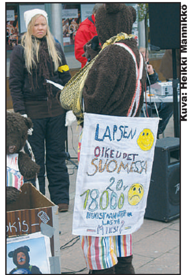
Lapsen oikeudet nousivat esiin myös Narinkatorilla 15.10.2011

Vallalla on kuitenkin käytäntö , jossa itse perhe kokee olevan vain näennäisesti prosessissa mukana. Näennäisyydellä tarkoitetaan tässä sitä, että perheen kanssa käytävät keskustelut ja mielipiteet eivät päädy asiakirjoihin. Kun mielipiteitä ei kirjata, ne eivät näin ollen ole käytettävissä sijoitusta tai huostaanottopäätöstä tehtäessä. Esimerkiksi lapsen mielipiteen selvittämisen tapa ja sisältö on lain mukaan kirjattava lapsen asiakirjoihin. Perheellä on oikeus saada tietää, mitä on dokumentoitu ja millaisia ovat toimenpiteisiin johtaneet perustelut. Dokumentoinnilla on vaikutuksia lapseen ja nuoreen esim. silloin, kun täysi-ikäiseksi tullut sijoitettu nuori saa lukea itseään koskevat asiakirjat. Dokumentoinnin oikeellisuus on siis äärim-