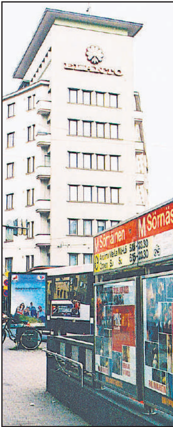
Elannon logon perinteinen mehiläinen oli paikallaan vielä v. 2012 Helsingin Sörnäisissä.

HOK-Elannon nimessä oleva Elanto syntyi vuonna 1905. Työväen osuustoiminnan juuret ulottuvat siihen aikaan, kun työväenliike Suomessa muutoinkin heräsi. Kun 2000-luvulla osuustoiminta katsoo tulevaisuuteen, on tärkeä nähdä, mistä se on noussut. Helsinki oli 1800-luvun lopulla teollistunut ja väkeä tuli töihin ympäröivästä kunnista ja muualta Suomesta. Syntyivät työväen asuma-alueet, joissa tavallista oli, että työnantaja omisti asunnon. Palkasta maksettiin tälle vuokra ja leivän hinta oli korkea.