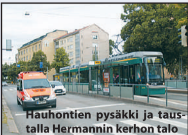
Hauhontien pysäkki ja tautalla Hermannin kerhon talo

Perinteiseen tapaan järjestämme yhteisen syysseminaarin Helsingissä sunnuntaina 9.9.2012 Hermannin kerholla os. Hämeentie 67 alk. klo 11.00. Paikalle pääsee keskustan suunnasta mm. raitiovaunuilla no. 6 ja 8 sekä kaikilla Hämeentietä kulkevilla busseilla. Noustaan ulos liikennevälineestä Hauhon puistossa, Vallilan peruskoulun luona ns. (punatiilitalo, Hämeentien ja Vellamonkadun risteys).