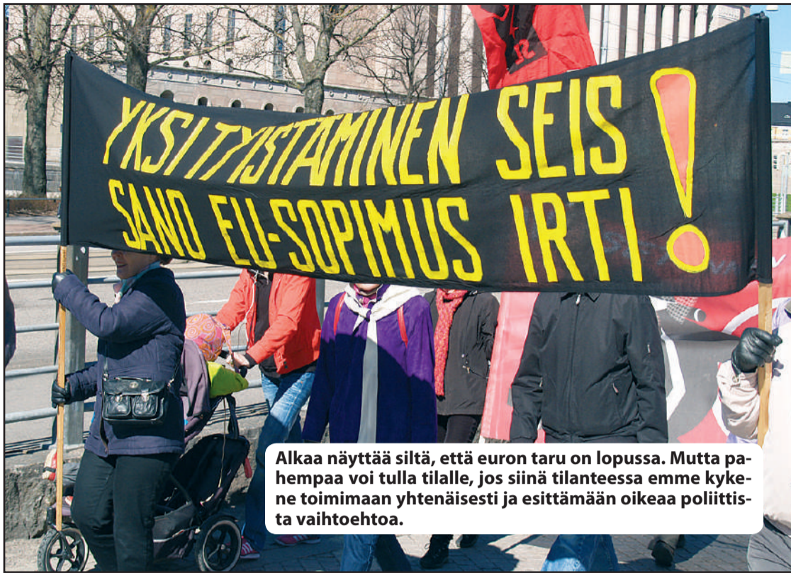
Alkaa näyttää siltä, että euron taru on lopussa. Mutta pahempaa voi tulla tilalle, jos siinä tilanteessa emme kykene toimimaan yhtenäisesti ja esittämään oikeaa poliittista vaihtoehtoa.

Saksan häikäilemätön pyrkimys vaihtotaseen ylijäämään saattoi heikommat etelän maat vaihtotaseen ja budjettialijäämän loukuun. Yhteisvaluutan oloissahan näiden maiden valuutta ei kellu eikä siten estä katastrofin syntymistä. Saksan ja Ranskan hallitukset rikkoivat Emun säännöksiä, julistivat poliittisella päätöksellä valtionlainat riskittömiksi ja kehottivat antamaan muille maille velkaa rajattomasti ennenkaikkea Saksan tuotannon nostamiseksi taantumasta. Saksan tavoite oli saada vaihtotaseensa ylijäämäiseksi. Eteläiset euromaat eivät pystyneet vastustamaan Saksan taloushyökkäystä. Normaalioloissa näiden maiden kelluva valuutta oli-