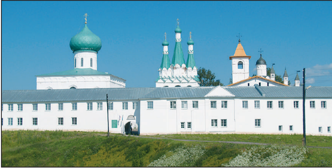
Aleksanteri Syväriläisen luostari on hyvä esimerkki siitä mikä on kirkon funktio luokkayhteiskunnassa. Kaikesta huolimatta sillä on merkittävä paikka historiassa ja sen arkkitehtuuri ja historia tulee säilyttää

Uskontojen kehityksen myöhemmissä vaiheissa useiden jumalien uskonnoista viimein kehittyi -siivilöityi- yksijumalaisuus, ei tarvittu erillistä jumalaa jokaiselle kivelle ja kan-