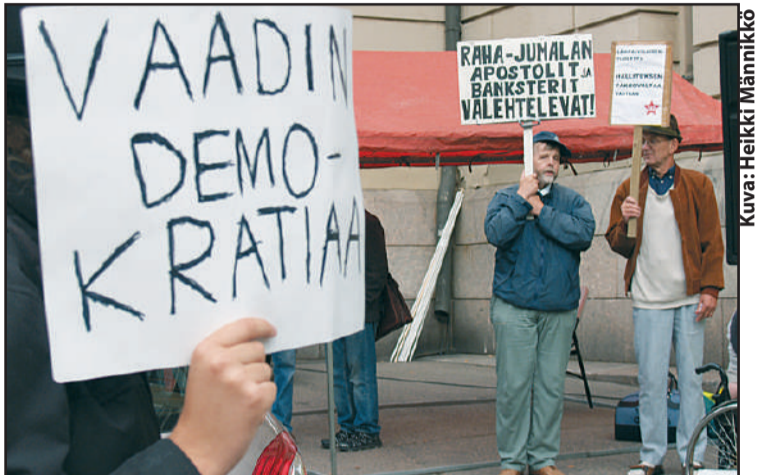
Ihmiset viettivät kaksi päivää säätytalon ulkopuolella. Selkeä vaatimus oli, että ihmisiä on kuunneltava kansanvallan mukaisesti.

En tiedä mihin tämä maailma oikeasti on menossa. Minusta kuitenkin tuntuu, ettei tästä tällä menolla ainakaan tavalliselle palkansaa-jalle ruusuilla tanssimista ole tarjolla. Eikä tulevaisuus koululaisille ja opiskelijoille ole sen parempi. Tuntikeyhys leikataan ja onpa vä-lytely joihinkin lukioihin lukukausimaksua. Eläkeikää lähestyvät ja jo eläkkeellä olevat ovatkin yhtäkkiä muuttuneet yhteiskunnan rasitteiksi eikä ollakaan valmiita tarjoamaan sitä, mikä heille oikeasti kuuluisi. Ihmettelenpä vaan, onko meillä oikeasti oikeutta asettaa ihmisiä eriarvoiseen asemaan ja jopa ennenkaiseen hautaan ja yhteiskunnasta syrjäytymiseen saattamiseen?