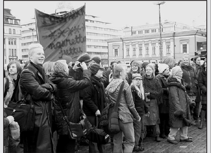
Turussa kaupunginjohton järjestömälle toriparkkihankkeelle koontuivat asukkaat torille nauramaan.

Turussa on suoritettu rajuja supistuksia kaupunkilaisten toimeentuloon. Emme voi hyväksyä kunnallisten palveluiden ja toimintojen yksityistämistä, sillä juuri se heikentää kuntalaisten toimeentuloa, korottaa maksuja ja heikentää palveluja.