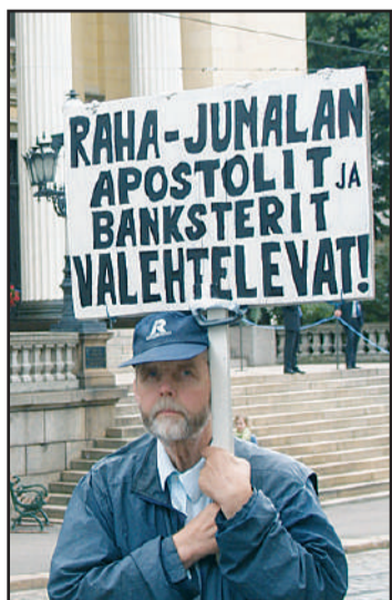
Valehtelun ohella he myös rikkovat lakia

Tähän samaan operaatioon liittyi Ahon porvarihallituksen valtionosuuksien muuttaminen yhdeksi summaksi. Aiemmin valtion osuudet oli tarkoin korvamerkitty. Jokaiselle pennille oli määritelty, mihin tarkoitukseen ne on käytettävä. Näin valtio huolehti siitä,