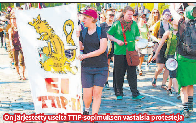
On järjestetty useita TTIP-sopimuksen vastaisia protesteja

Meillä eliitti ajaa lävitse EU:n ja USA:n välisistä kauppaa- ja investointikumppanuussopimusta (TTIP). Sen seurauksena Euroopasta häviäisi lähes miljoona työpaikkaa, joista kolmannes Pohjoismaista. Sopimus toisi ns. tuottajasuojasopimuksen, jossa mm. ympäristölainsäädäntömme katsottaisiin kaupan esteeksi. Kun EU:n alueella ay-liike vastustaa sopimusta, niin Suomessa ay-keskusjärjestöt ja EK lobbaavat sitä. Toivomme ovat sopimusta vastustavat tietoiset ihmiset ja järjestöt.