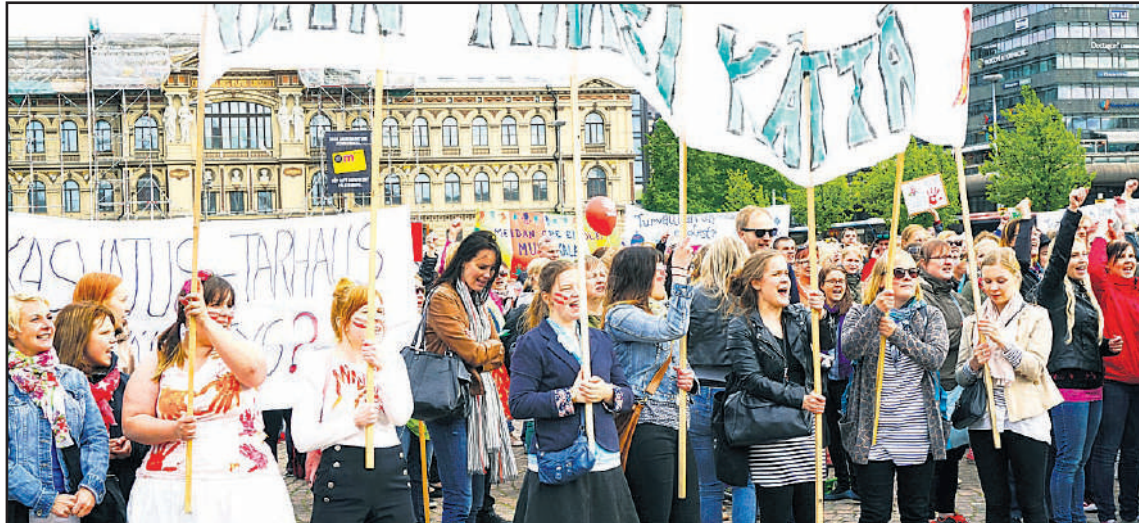
Päivähoitohenkilökunta, lastentarhanopettajat ja lasten vanhemmat osoittivat, että jossain vaiheessa tulee vastaan se raja, jota ei voida ylittää. Tuhannet protestoivat 10.6.-15 hallituksen leikkauspolitiikkaa.

Syksyllä 2013 sovittiin työmarkkinajärjestöjen kesken laaja, lähes kaikkia aloja koskeva sopimus, joka sai nimekseen "työllisyys – ja kasvusopimus." Siitä käytetään lyhennettä TYKA-sopimus. Sopimus antoi ensimmäisenä vuonna 20 euron sopimuskorotuksen palkkoihin ja tänä vuonna 0,4 prosentin korotuksen.