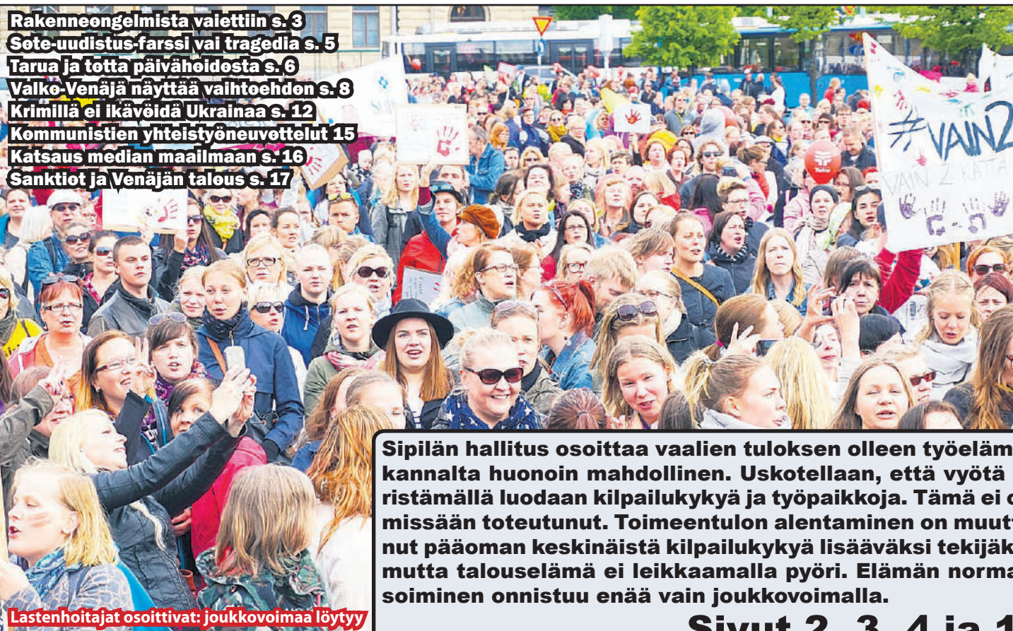
Lastenhoitajat osoittivat: joukkovoimaa löytyy

Rakenneongelmista valettiin s. 3 Sote-uudistus-farssi vai tragedia s. 5 Tarua ja totta päivähoidosta s. 6 Valko-Venäjä näyttää vaihtoehdon s. 8 Krimillä ei ikävöidä Ukrainaa s. 12 Kommunistien yhteistyöneuvottelut 15 Katsaus median maailmaan s. 16 Sanktiot ja Venäjän talous s. 17