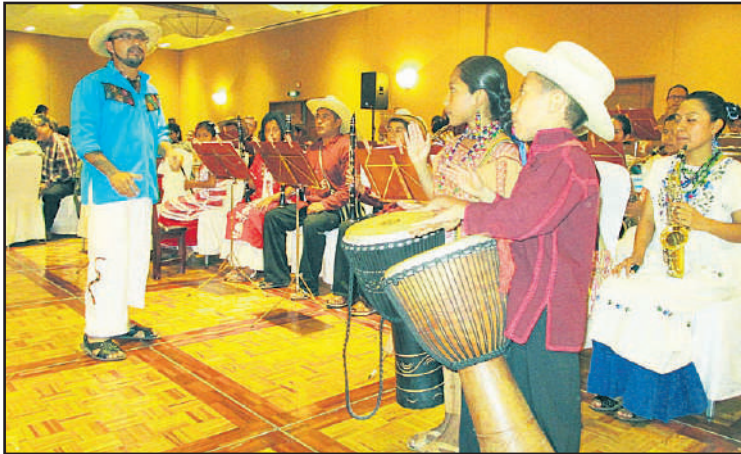
Musiikkikoulun lapset ja nuoret esiintyivät seminaarivieraille.

Hyvät toverit ja seminaarin osanottajat, edistyksellisen vasemmistolaisen koalitiopuolue Syrizan vaalivoitto Kreikassa oli merkittävä tapa Euroopan viimeaikaisessa historiassa. Tämä voitto saavutettiin erittäin vaikeissa olosuhteissa. Myös Kreikan kommunistinen puolue teki hyvän vaalituloksen. Se sai 5,5 prosenttia annetuista äänistä. Natsipuolue Kultainen aamunkoitto ei onneksi edennyt näissä vaaleissa lainkaan. Syrizan vaalivoiton saama vastaanotto EU-eliitin ja porvariston keskuudessa kertoo selkeästi työväenluokan ja kapitalistiluokan välisestä kasvavasta kuilusta Euroopan unionissa. Kreikan vallitsevaa tilannetta voidaan kuvailla erittäin ankaraksi luokkataisteluksi.