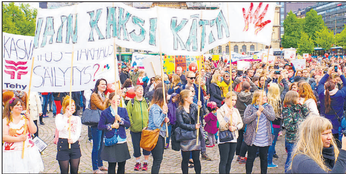
"Vain kaksi kättä" - kansalaisliike järjesti "kolmen ässän joukkueelle" ensimmäisen muistutuksen 10.6.2015. Päivähoidon leikkauksia vastustavissa tapahtumissa yksistään Helsingissä oli tuhansia osanottajia.

"Päiväkoti on paikka, jossa työntekijät saavat palkkaa hiekkalaatikolla istumisesta ja päivänunien nukkumisesta". Vastaavia "asiantuntevia" kommentteja on varmasti moni meistä varhaiskasvattajista kuullut. Tuttuja fraaseja ovat myös; "lasten hoito on maailman helpointa työtä, ei siitä voi väsyä" ja kaiken huijaksi eräät besserwisserit ovat tienneet, ettei varhaiskasvatustyöhön tarvita edes koulutusta. "Kyllähän jokainen osaa istua hiekkalaatikolla kaitsemassa parin lapsen sopuisaa leikkiä." Jos asianlaite olisi näin, voisi alan alhaisen palkkatason vielä ymmärtää.