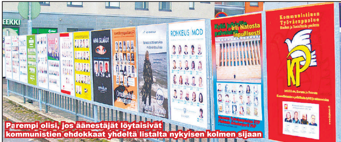
Parempi olisi, jos äänestäjät löytäisivät kommunistien ehdokkaat yhdeltä listalta nykyisen kolmen sijaan

Kommunistien Liitto on kirjannut vuosittain toimintasuunnitelmaansa yhdeksi tärkeimmistä tavoitteistaan uusliberalismin vastaisen yhteisrintaman rakentamisen. Lehtikirjoituksissa ja asiakirjoissa olemme Suomen Työväenpuolueen jäsenjärjestöjen osalta todenneet, että yhteisrintaman rakentamisesta olemme valmiit keskustelemaan ilman minkäänlaisia ennakkoehtoja. Esittäessämme laajan työkansaa edustavan yhteistyöliikkeen perustamista 10 vuotta sitten, emme saaneet ajatuksellemme suurempaa vastakaikua. Katsoimme kuitenkin välttämättömäksi perustaa STP yhteistyöjärjestön malliksi. Tähän monet potentiaaliset yhteistyötahot eivät koe STP:tä rintamajärjestönä, vaan puolueena. Tämän voi ymmärtää, koska kaikki eivät olleet sitä muodostamassa. Siksi lähdemme siitä, että kehityksen johtaessa laajemman yhteisrintaman muodostamiseen, STP:n nykyinen organisaatio ei muodostu ennakkoehdoksi. Epävirallisissa nettikeskusteluissa KTP:n suuntaan olemme esittäneet, että koska yhteydenotto sinne ei ole tuottanut tuloksia, niin tehostamme yhteistyöesitys meille. Sen KTP:n keskusneuvosto teki 10.5.2015 sekä Kommunistien Liitolle että SKP:lle.