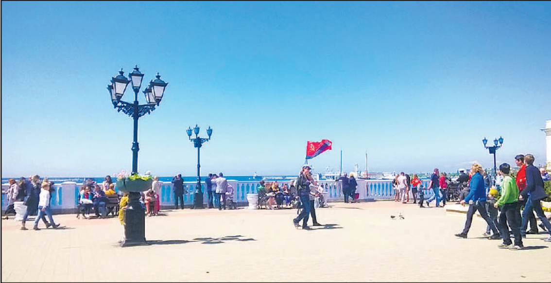
Sevastopolissa juhlittiin Voiton päivää meren rannalla.