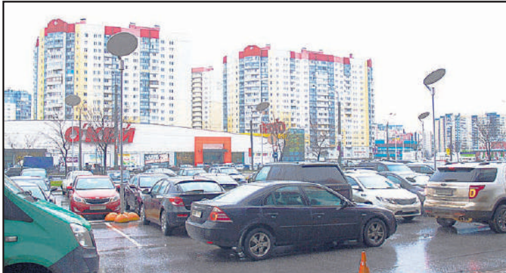
Venäjällä rakennetaan paljon. Talouteen iskee, jos lainojen korko nousee yli 20 %. Kuvassa pietarilainen uusi lähiö ja ostoskeskus.

Jo vuoden ajan Venäjän ja Lännessä suhteita ovat rasittaneet keskinäiset sanktiot. Ensimmäisen iskun antoi Länsi (tarkoitetaan Länttä poliittisessa mielessä, laskien mukaan Japanin, Australian ja Uuden Seelannin), minkä jälkeen Venäjä vastasi vastasanktioillaan. Kehittyneet kapitalistiset maat motivoivat toimiaan välttämättömyydellä "rankaista" Venäjää Krimin "liittämisestä" ja "aggressiosta" Itä-Ukrainassa. Presidentti Putin väittää kuitenkin, että nämä ovat vain tekosyitä ja että Länsi vain päätti tällä tavoin estää Venäjän liiallisen voimistumisen.