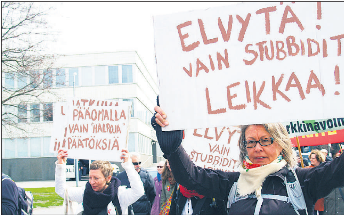
Vappuna työkansan ja nuorison vappumarssilla osattiin antaa oikeat neuvot ässäkomppanialle. "Mikki auki mielivaltaa vastaan"- tapahtumassa tuotiin julki keskeisimmät tulevan hallituspolitiikan ongelmat.

Kriittinen Ay-verkosto järjesti 21.5.-15 Hakaniemen torilla "Mikki auki mielivaltaa vastaan"- tilaisuuden. Puhevuoroissaan isojen työpaikkojen ja ammattiosastojen pääluottamusmiehet sekä toimihenkilöt ja yhteiskunnalliset aktivistit "osallistuivat osaltaan hallitusneuvotteluihin". Kolmen ässän joukkueelle torilla esitetyt evästyksiset mitä todennäköisimmin olisivat olleet uutisia, jos ne olisivat kantautuneet heidän korviinsa. Paikalla kuultiin suoraa viestiä TTIP-toimintaryhmältä (katso sivu 20), joka samana päivänä tapasi ulkoministeriön edustajia.