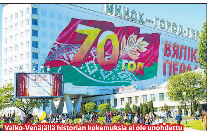
Valko-Venäjällä historian kokemuksia ei ole unohtettu

Toukokuun 9. päivä tuli 70 vuotta, kun Natsi-Saksa antautui fasisminvastaisen liittouman joukoille. Tänä maailma jakaantuu niihin, joilla historiallinen muisti toimii ja niihin jotka haluavat sodan opetukset unohtaa. Jälkimmäisiin kuuluvat ne, jotka globaalien pääomien tuella pyrkivät maailman uudelleen jakamiseen. Monissa Voitonpäivän-tilaisuuksissa muistutettiin vaaroista, joihin historian unohtaminen johtaa ja vaadittiin Venäjä-suhteidemme normalisoimista.