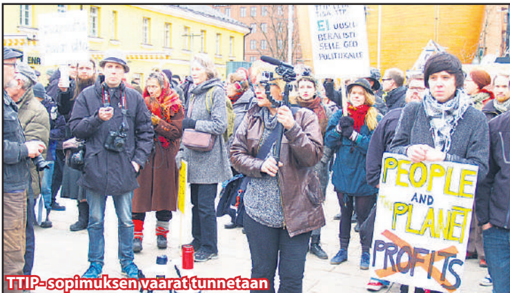
TTIP-sopimuksen vaarat tunnetaan

TTIP eli EU:n ja USA:n keskeinen kaupp- ja investointisopimus, josta juuri kyseiset osapuolet neuvottelevat, on sisällöltään todella vaarallinen taloussopimus. Sen avulla suuryritykset saavat täydellisen otteen niin kansoista kuin niiden talouksista. Se vaikuttaa talouteen, ympäristöön ja demokratiaan. Yritysten edut laitetaan kansojen etujen edelle. Lobbaavat yritykset ovat rahoittaneet 90-prosenttisesti sopimusneuvottelut. Koko sopimus on suuryritysten valtapyrkimystä.