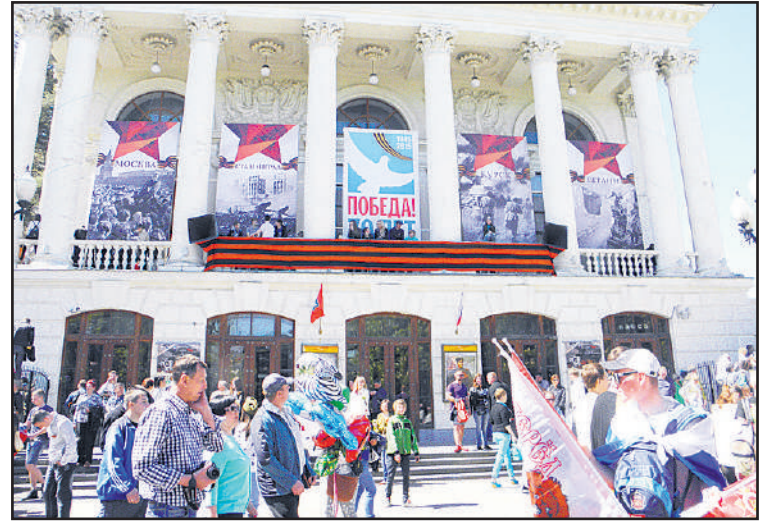
Voiton päivää juhlittiin myös kaupungin kaduilla.

Kirjoittaja oli Krimillä 11.4.-16.5.2015