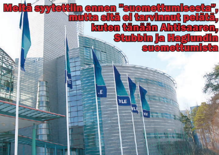
Suomen valtamedian (mm. YLE:n) Venäjä-vastaisuus menee ääriajalle. Aiemmin se on ennakoitunut vaikeita aikoja. Toivottavasti tilanne normalisoituu pian. Kuva kokoomuksen trollitehtaalta Länsi-Pasilasta.

Tänään saamme todistaa Suomen ulkopolitiikan täydellistä rappiota. Maatamme on asemoitu entistä tiiviimmin osaksi läntistä leiriä, joka koostuu kolmesta peruspilarista, USA, EU ja Nato. Tämä pyhä kolminaisuus tavoittelee täydellistä maailmanhallintaa ja totalitristista kapitalistista maailmanjärjestystä. Viimeaikaiset poliittisen johtomme edesottamukset osoittavat Suomen olevan tänä päivänä itsenäisen toimijan sijasta lännen tahdon alamainen. Meillä on lyhyessä ajassa tuhottu toisen maailmansodan jälkeen Paasikiven ja Kekkonen johdolla rakennettu ulkopolitiikka, joka perustui puolueettomuuteen, sovitteluun ja rauhanpolitiikkaan.