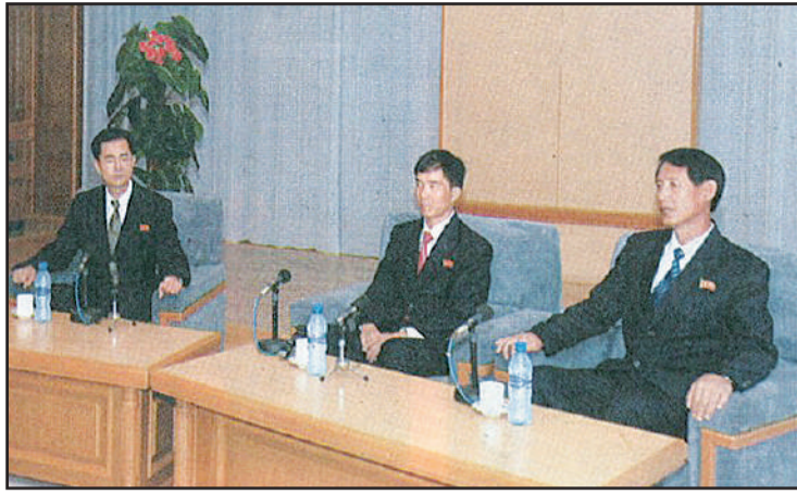
Kaksi KDKT:aan palannutta loikkaria pitämässä lehdistötilaisuutta Pjongjangissa. Loikkareiden paluu on lisääntynyt sen jälkeen, kun Kim Jong Un lupasi puheessaan, että palaavia loikkareita ei rangaista, mikäli he eivät ole syyllistyneet rikoksiin ennen loikkaamistaan.

Vuoden vaihteessa 2014 kohistiin amerikkalaisesta elokuvasta, jossa toimittajakaksikko yrittää salamurhata KDKT:n päämiehen Kim Jong Unin sekä elokuvan tuotantoyhtiö Sonyyn elokuvan vuoksi kohdistuneesta tietomurrosta. Amerikkalaisten mukaan tietomurron takana on KDKT:n valtio ja Obaman hallinto uhkasi lisäävänsä jälleen KDKT:n terrorismia tukevien valtioiden listalle. KDKT:n hallitus on kiistänyt osallisuutensa ja tarjon-