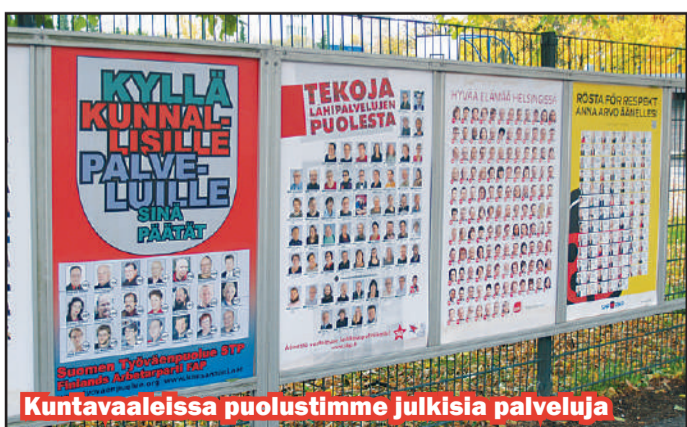
Kuntavaaleissa puolustimme julkisia palveluja

Kovan markkinakapitalismin seurauksena toimeentulomme leikkaamisesta on tehty suurkapitalistien voittoja ja kilpailukykyä lisäävä tekijä. Siksi puolustamme julkisia palveluja, torjumme toimeentulon leikkauksia ja vaadimme toimia työllisyyden puolesta. Uudeksi jopa tärkeimmäksi vaaliteemaksi on nopeasti noussut ulkopoliittika. Vaadimme paluuta puolueettomuuteen ja irtaantumaa kaikista sotilasliitoista.