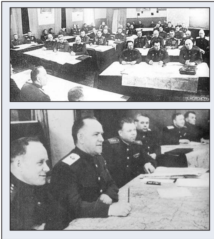
Neuvostoliiton sodanjohtoon kuului päämajan ja yleisesikunnan lisäksi useita eri portaita. Näissä kuvissa 1.V-VR:n sotaneuvosto ja armeijankomentajat esikuntineen suunnittelevat ja valmistelevat Berliinin operaatiota keväällä 1945. Kuvat Zukovin muistelmat - kirjasta.