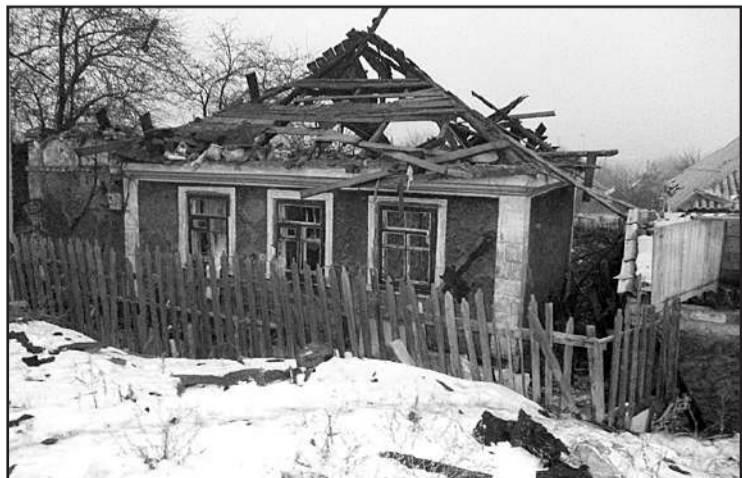
Kadun suunnassa kohdistuneessa tykistökeskityksessä monet talot hajosivat. Ukrainalaiset talot ovat vahvoja ja usein ammuksen osuessa keskelle taloa katto lentää mutta seinät jäävät pystyyn.