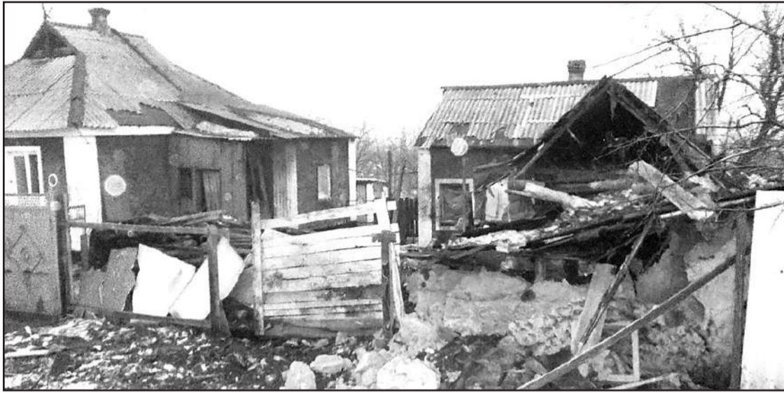
Ihmisten asumukset sikoineen ja kanoineen muuttuvat Ukrainan tykkitulessa tällaisiksi. Siviiliasutuksien kohdistettu tuli on hyvinkin satunnaista.

Kyseisessä paikassa Kiovan joukot olivat aiemmin edenneet syväälle Novorossijan joukkojen valvonta-alueelle. Niiden miehittäjä alue muistutti muodoltaan pulloa, jonka nostoväki aikoi tulopata korkilla. Tässä nostoväki viime kädessä onnistuikin. Korkilla tulpat-