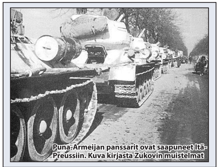
Puna-Armeijan panssarit ovat saapuneet Itä-Preussiin. Kuva kirjasta Zukovin muistelmat

Jugoslavian vapauttamisen jälkeen natsien liittolaisista oli jäljellä vielä Horthyin Unkari, jonne liittolaisjoukot siirtyivät. Horthy aloitti Neuvostoliiton kanssa neuvottelut syksyllä -44 pyrkien rauhansopimukseen. Hitleriläiset kuitenkin erottivat hänet ja alkoivat paikallisten fasistien kanssa johtaa maata. Varmistaakseen asemansa he muodostivat Etelän AR:n. Siihen kuului 29 div., joista neljä oli ps-divisioonia. Aseistukseen kuului 3500 tykkiä ja krheitintä, 300 ps-vaunua ja 550 lentokonetta. Näitä vastaan hyökkäykseen valmistautui 2.UR. Sen voimiin kuului 40 div. aseistuksenaan 750 ps-vaunua ja rynnäkkötykkiä, 10200 tykkiä ja krheitintä sekä 1100 lentokonetta. Voimiin kuului myös kaksi romanialaista armeijaa (17 div.). Tämä ns. Debrecenin operaatio aloitettiin 6.10.-44. Debrecen vapautettiin 20.10.-44. Tämän jälkeen liittolaisjoukot suuntautuivat Budapestin suunnalle ja ensi vaiheessa vallattiin Tiszan ja Tonavan välinen alue. Osa joukoista