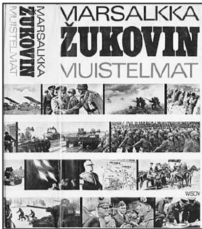
Zukovin muistelmat on laaja teos tarkistettua sotahistoriaa. Jokaisen asioista kiinnostuneen kannattaa hankkia teos kotikirjastoonsa.

Neuvostojoukkojen ilmestyminen 70 km päähän Berliinistä Küstriniin oli saksalaisille shokki [Kä 6/14]. Hitleriläiset järjestivät nopeasti vastahyökkäyksen. Päiviä kest-