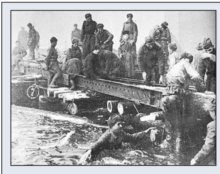
Alkuvuodesta neuvostojoukkojen eteneminen oli nopeaa ja taistelut käytiin kaikilla rintamilla. Ylitettävänä oli useita suuria vesiesteitä mm. Veiksel, Oder ja Neisse. Tässä neuvostopioneerit rakentavat siltaa Oderilla.