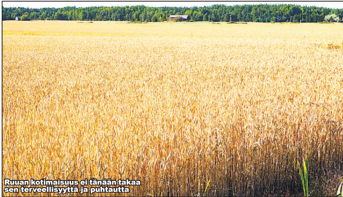
Ruuan kotimaisuus ei tänään takaa sen terveellisyyttä ja puhtautta

Erittäin tärkeä ruokakulttuuri on siksi, että ravinto vaikuttaa ihmisten terveyteen. Suomen virallinen terveellinen ruokavalio näyttää aiheuttavan enemmän haittaa kuin hyötyä. Se on teoriaa eikä perustu todelliseen tietoon. Lääketiede väheksyy ruoan osuutta ongelmien synnyssä ja koettaa hoitaa sairauksia lääkkeitä eikä ruokavaliota muuttamalla. Lasten ravinteita vailla oleva pikaruoka, välipalat, liika sokeri ja virvoitusjuomat ovat tärkeimmät syyt lasten ja nuorten ongelmiin. Päivän ateria muodostuu makeista aamiaismuroista, rasvattomasta maidosta, margariinista, naksuista, pitsoista, hampurilaisista, ranskalaisista perunoista, kolajuomasta, energiajuomasta, perunalastuista, jäätelöstä ja makeisista.