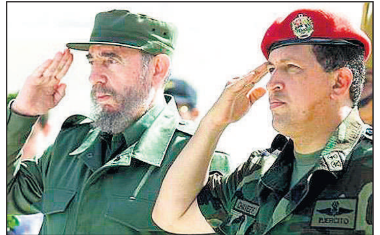
Fidel Castro yhdessä Hugo Chavezin kanssa. Kuuban ja Venezuelan kesken kehittyi laaja taloudellinen ja poliittinen yhteistyö.

Fidel Castro totesi v. 2003 Santiago de Cubassa pitämässään puheessa mm. seuraavaa: "Minä puhun ikään kuin, jos maamme eläisi idyllissä taivaan rauhassa, aivan kuin, jos ei olisi ollut yli 40 vuotta kestänyttä raakaa kauppasaartoa, taloudellista sota, lukemattomia sabotaasi- ja terrori-iskuja, salamurhahankkeita sekä päätymätöntä määrää karseita toimia maamme kohtaan, joita en toivo korostavani tässä puheessani, koska polttopisteinä ovat tämän hetken olennaiset ajatukset. Riittää, kun todetaan, että puolustukselliset tehtävät yksistään ovat vaatineet satojen tuhansien miesten ja naisten mobilisointia ja valtavia aineellisia voimavaroja. Tämä taistelu on