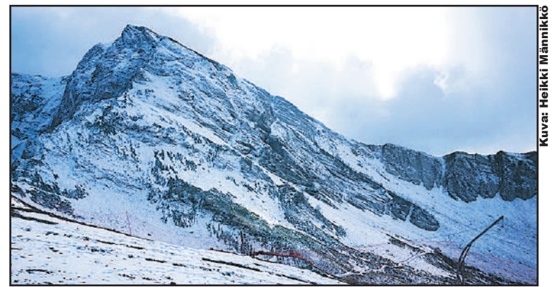
Kaukasus - vuoriston lumisia huippuja Krasnaja Poljanan näköalahuipulta 2,3 km korkeudelta katsottuna

Erikoisena historiallisena huomiona oli, että alueelle oli muutta-