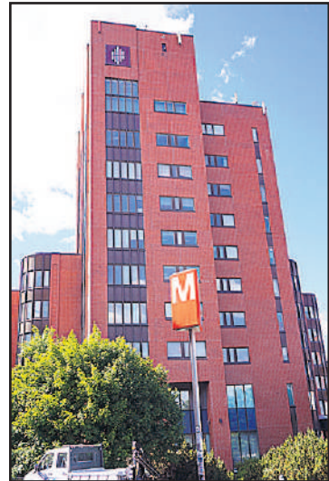
Tilastokeskus Helsingin Kalasatamassa on valjastettu tuottamaan "tilastoja" joilla voidaan perustella väestön nopeaa ikääntymistä.