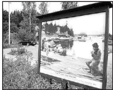
Albert Edelfeldtin aluetta kuvaavan taulun kopio sijoitettuna Hamarin laiturin luokse.