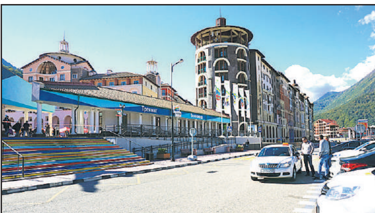
Kuva Krasnaja Poljanan olympiakylän keskuksessa Gorki-Gorodista. Kuva luonnollisestikaan ei selviä alueen laajuus.

Kirjoitus jatkuu seuravassa numerossa. Silloin kerron naapurimaahan Abhaasiaan tekemästämme vierailusta.