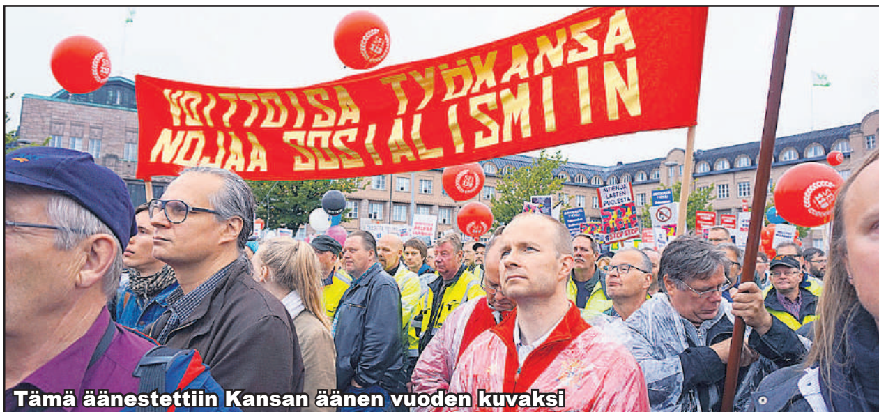
Tämä äänestettiin Kansan äänen vuoden kuvaksi