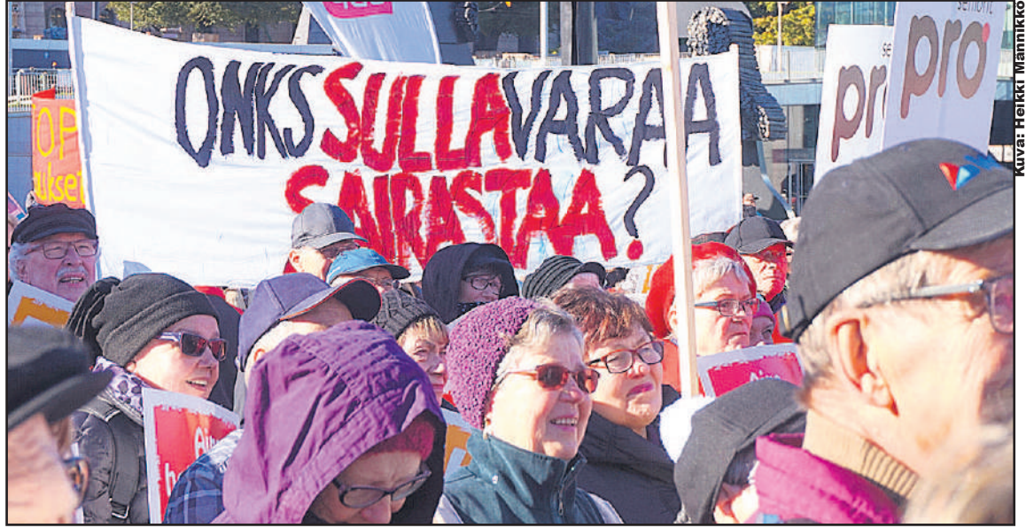
Kova markkinaehtoinen kapitalismi on asettanut eläkeläiset keräämään puskurirahastoja rahamarkkinoiden romahduksen varalle. Leikataan myös eläkeläisten tuloja, joita muutoinkin syö taitettu indeksi. Syksyllä 8.10.-15 tuhannet eläkeläiset kokoontuivat torjumaan leikkauksia. SDP:n ja vasemmistoliiton eläkeläisjohtajat totesivat, että olemme talkoissa yhdessä ja oikeudenmukaisesti.