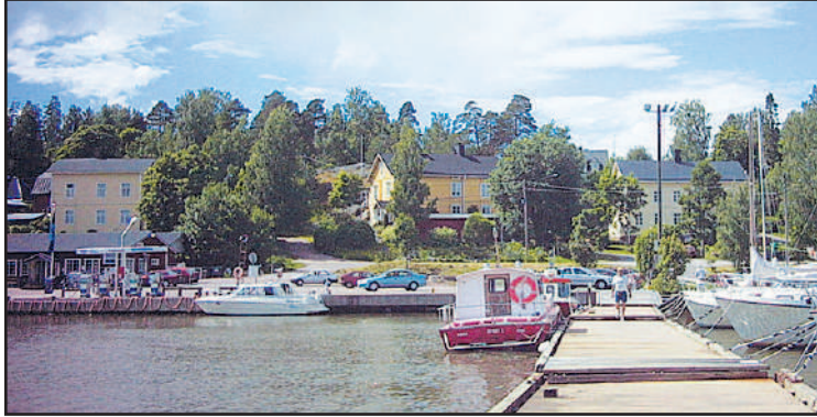
Kuvassa porvoon Hamari Gammelbackan alue nykyasussaan. Lähellä kuvan oikeassa laidassa olevaa pienvienelaituria lienee ollut se laiturijosta Yrjö Maunun seurue v. 1876 lähti Pietariin. Miljöeseen kannattaa käydä tutustumassa.