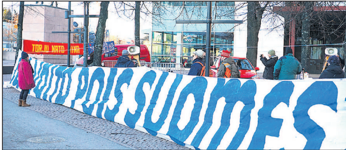
Tilaisuuden tunnuksissa muistutettiin, että "EU-valta pois Suomesta" sekä "Torju Nato aina". Helsingissä järjestettiin useita mielenosoituksia. Kiasman aukiolla kokoontui nuoria, jotka liittyivät laajaan tapahtumaan lähtien marssimaan nousevaa, rasistista ja avoimen fasistista äärioikeistoa vastaan.

Perinteiseen tapaan EU:n vastaiset ja EU-kriittiset sekä sodan vastaiset kansalaisjärjestöt tapasivat Itsenäisyyspäivänä Kiasman aukiolla Helsingissä. Tilaisuudessa käytettiin 15 puheenvuoroa. Niiden sanoma oli selkeä. EU-suuntaus on riistänyt maaltamme 99 vuotta sitten saavutetun itsenäisyyden. Samalla se on tuhonnut meiltä oman talouspolitiikan ja lainsäädäntövallan. Tänäpä olemme uusliberalistisen talous- ja yhteiskuntapolitiikan armoilla, joka merkitsee itsenäisyyden aikaisten sosiaalisten ja taloudellisten saavutusten mitätöimistä. Siksi meidän on haastettava vallitseva uusliberalistinen EU-suuntaus, palautettava maamme itsemääräämisoikeus ja rakennettava uusi yhteiskunta- ja talouspolitiikka.