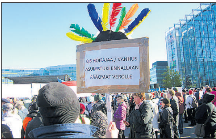
Eläkeläiset saapuivat 8.10.2015 Kansalaisatorille vastustamaan leikkauksia ja vaatimaan oikeuksiaan. Eläkeläisjärjestöjen johdon sanoma oli, että "leikata pitää, mutta oikeudenmukaisesti". Tämän petoksen he voisivat osittain sovittaa tukemalla tehtyä kansalaisaloitetta

Entisen kansanedustajan Kimmo Kiljusen alulle panema kansalaisaloite, jossa esitetään työeläkeindeksin palauttamista palkkataso-indeksiksi, luovutettiin 8.12.2016 eduskunnan puhemiehelle. Tämä ns. "taitettu indeksi" merkitsee, että eläkkeitä tarkistetaan kerran vuodessa työeläkeindeksillä, jota laskettaessa palkkatason muutoksen painokerroin on 0,2 ja hintatason muutoksen painokerroin 0,8. Tämän seurauksena on työeläke laskenut siten, että se on enää 45 % palkasta, kun se vuonna 1995 oli 60 % palkasta. Eläkeläiset köyhtyvät hyvää vauhtia. Nyt luovutettu kansalaisaloite pyrkii korjaamaan tämän Lipposen hallituksen (siis Lipposen) v. 1995 tekemän vääryyden. Sanotaan, että indeksin korjaamiseen ei ole varaa. Se ei ole totta siksikään, että eläkerahastot ovat tällä hetkellä n. 180 miljardia euroa. Jos vieläkin epäilet, ettei eläkeindeksiä voitaisi korjata, lue oheinen artikkeli kaikessa rauhassa ja ajatuksella. Sen jälkeen kannattaa lähettää viesti kansanedustajalle asiasta, ennen kuin eduskunta käsittelee kansalaisaloitteen.