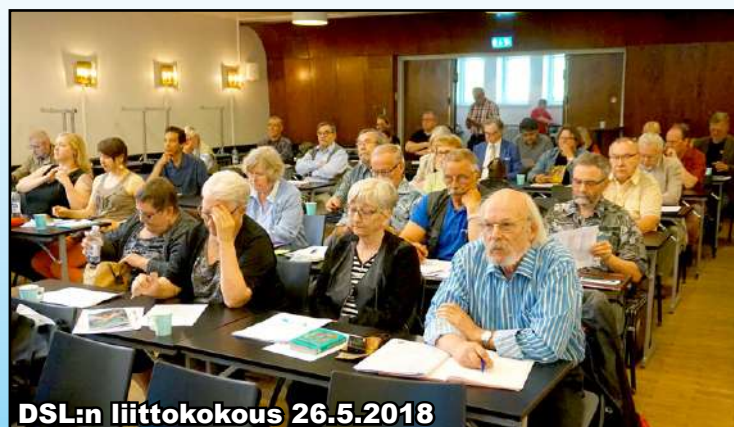
DSL:n liittokokous 26.5.2018

Osanottajamaksu on 80 € (sis. ohjelma, ruokailu ja majoitus). Maahanmuuttajat, työttömät, eläkeläiset sekä muut opintoseleihin oikeutetut voivat kuitata osallistumismaksun opintoseleillä ilmoittautumisen yhteydessä. Lisäksi DSL:n opintokeskus korvaa matkakulut halvimman julkisen kulkuneuvon hinnan mukaisesti.