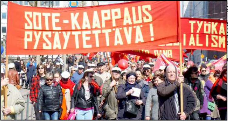
Työ sote-kaappausta vastaan ei selvästikään ole ohi. Lamaantumisen käy meille todennäköisesti kalliiksi