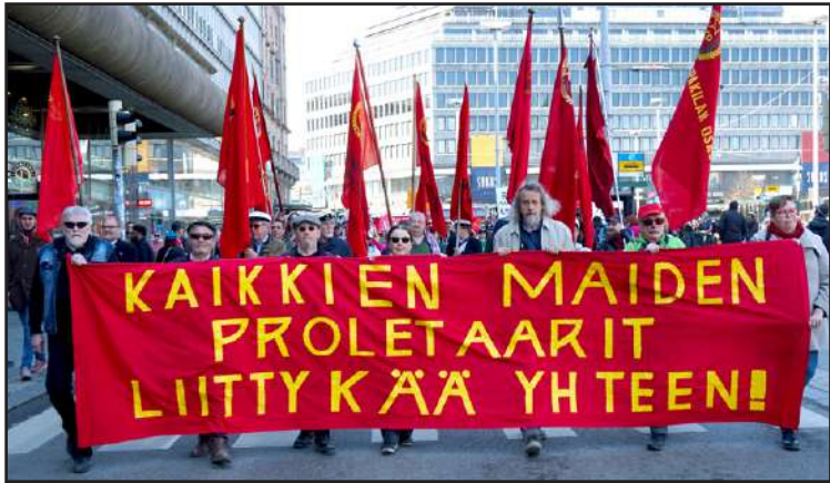
Kuva: Heikki Männikkö