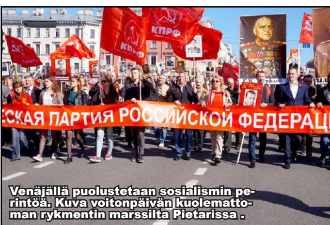
Kuva: Heikki Mämmikkö