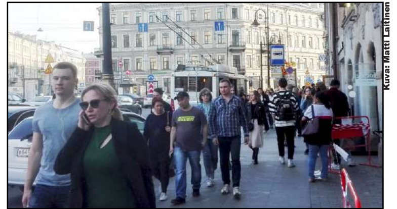
Kansallisista eroista huolimatta katu-yleisön osalta katukuva esimerkiksi Pietarissa ei juurikaan poikkea Helsingistä.

Venäjän viennin määrä kasvoi edelleen nopeasti mm. ruplan heikentymisestä johtuen. Kotitalouksien kulutus ja investoinnit sen sijaan elpyivät lamasta edelleen melko vaisusti. Venäjän tuonnin nopea