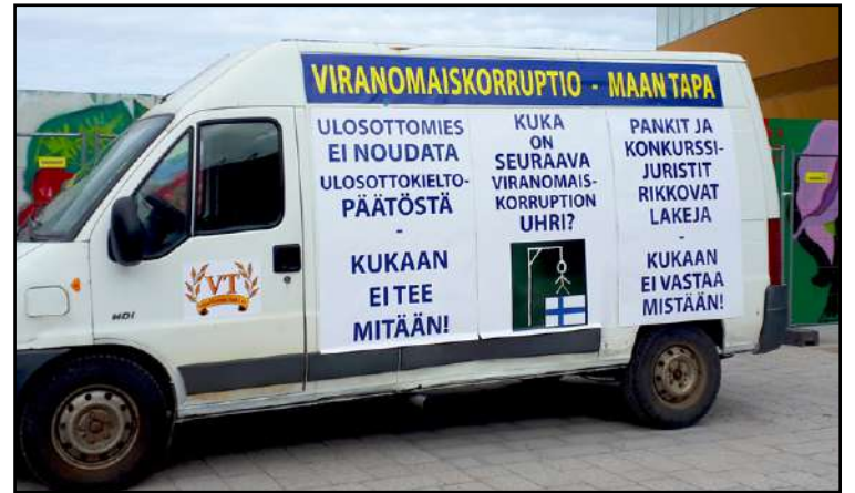
Velallisten Tuki ry:n kampanja-auto kiertää toreilla ja tapahtumissa. Tässä ollaan kansalaistorilla joukkovoiman "Ei jatsoon"-tapahtumassa.