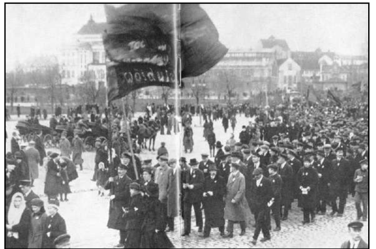
Vaikeinakin aikoina Viron työväenliike toimi. Kuvassa vappumielenosoitus Tallinnassa v. 1921. (Suuri Lokakuu ja Eesti-kirjan kuvitusta)

Marraskuun 20. päivänä maapäivien kokoontuessa Tallinnan neuvosto järjesti protestilakon. Valkokaartilaisien Kaitseliit hyökkäsi mielenosoittajia vastaan. Kansalaissota alkoi. Punakaartilaiset pystyivät vapauttamaan Pihkovan ja Narvan. Vapautetussa Narvassa julistettiin 29.11. syntyneeksi Viron neuvostotasavalta (Viron työkansan kommuuni). Joulukuun 7. päivänä Neuvosto-Venäjän hallitus hyväksyi asetuksen Viron neuvostotasavallan itsenäisyyden tunnustamisesta.