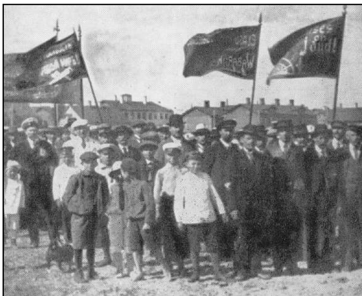
Työläisten mielenosoitus Tallinnassa 18.6.1917. (Suuri Lokakuu ja Eesti-kirjan kuvitusta)