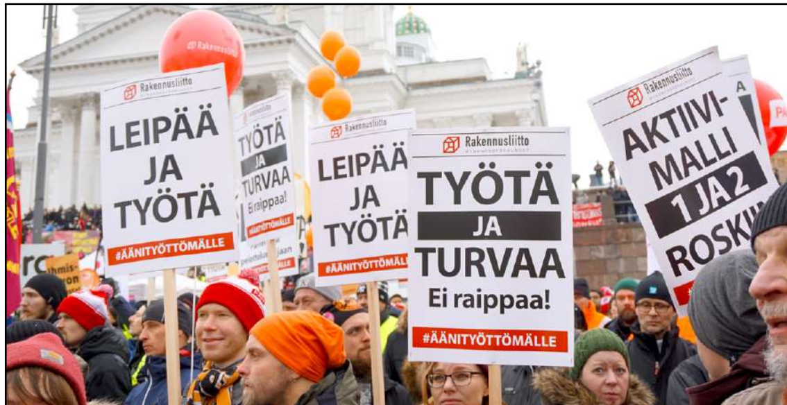
Ay-järjestöjen 2.2.2018 aktiivimallia vastaan organisoidussa protestissa vaadittiin aktiivimallin purkamisen ohella mm. työtä, palveluita, leipää ja toimeentuloa kepin sijaan. Kaikki nämä kytkeytyvät lisäarvoon.

Marx totesi, että työväenluokan työllistetyin osan ylityö paisuttaa sen varajoukon rivejä, kun taas päinvastoin se lisääntynyt painostus, mitä viimeksi mainittu kilpailullaan harjoittaa edelliseen, pakottaa sen ylityöhön ja alistumaan pääoman käskyihin. Se, että työväenluokan toinen osa tuomitsee ylityönsä kautta toisen osan pakotettuun joutilaaisuuteen ja päinvastoin, tulee rikastumisen välineeksi yksityiselle kapitalistille ja jouduttaa teollisuuden vara-armeijan tuotantoa yhteiskunnallisen kasautumisen edistymistä vastaavasti. (Pääoma I, s. 571 – 572, Vaasa, 2013)