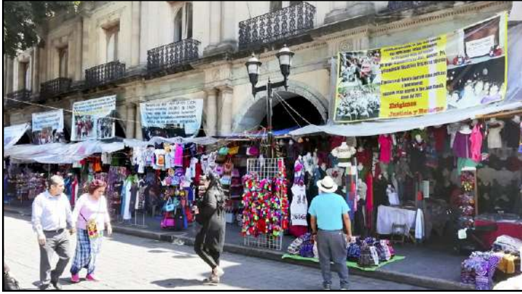
Triqui-heimon tilanteesta kertovat plakaatit reunustavat Oaxaca Cityn valtionpalatsia.

(KÄ/ Cilla Heiskanen) Tämä teksti on jatkoa edellisessä numerossa alkaneeseen Meksikon tilanetta käsittelevään tekstikokoonaisuuteen, jonka kirjoitin ollessani reppureissulla Keski-Amerikassa. Chiapasista matkustin toiseen etelämeksikolaiseen osavaltioon, Oaxacaan, jossa tutustuin tarkemmin alkuperäiskansojen kohtaamiin ongelmiin. Teksti on kirjoitettu alunperin 22.3.2019 Oaxaca de Juarezissa.