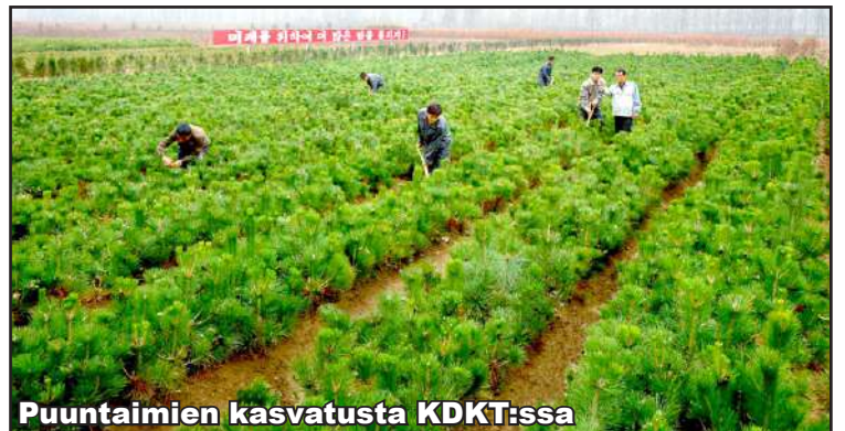
Puuntaimien kasvatusta KDKT:ssa

Koreassa kärsittiin viime vuonna kovasta lämpöaalosta, joka heikensi merkittävästi satotasoa. Kaivatut sateet tulivat rankkasateina, jotka huuhtovat mukanaan ravinteikasta viljelysmaata. Viime talvena ei satanut myöskään lunta, joten olosuhteet kevättyönteille ovat huonot, koska maa on poikkeuksellisesti talven jäljiltä kuivaa.