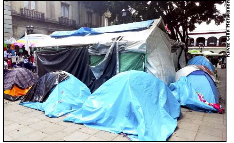
UACOL-järjestön telttakylä Oaxaca Cityn keskustassa.