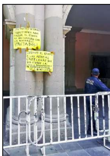
Poliisi vartioimassa Oaxaca Cityn valtionpalatsin sisäänkäyntiä.