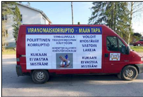
Velallisten Tuki ry:n toinen kampanja-auto

4. Pakkomyyntin myyntitulot luovutetaan velkojalle vähentämättä luovutusvoiton veroja. Ne peritään ulosotossa olevalta, joka ei saa myyntituloa eikä ole myynyt. Velkojapankki tai perintäyhtiö saa myyntitulon ilman että luovutusvoiton veroa on siitä vähennetty. Ulosoton tällä tavoin ylläpitämä veronkiertomenettely on sama kuin pankin pakkomyynnyssä kielletyllä oman käden oikeudella asiakkaan omaisuutta. Kun pankki myy tällä tavoin, oikeudessa päätös tehdään pankin edustajien kuulemisen perusteella, eikä laittomuuksia tutkita. Oikaisu tulee mahdottomaksi, vaikka kyseessä on väärä