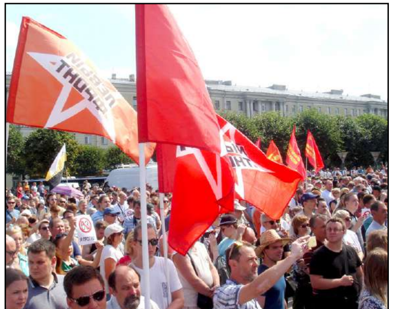
Pietarissa on nähty useitakin isoja protesteja. Mielenkiinnolla odotetaan, miten tämä tilanne vaikuttaa tuleviin paikallisvaaleihin. Kaikesta päätellen Venäjällä on tulossa kuuma syksy.