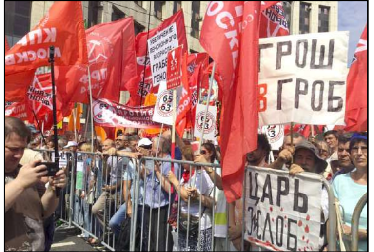
Moskovassa on ollut isoja protesteja, joihin ovat osallistuneet lähikaupunkien valtuuskunnat ja monet järjestöt. Venäjän vasemmisto alkaa yhdistää voimaansa.

Näyttää siltä, että Venäjän hajanainen oppositio alkaa yhdistää voimiaan ainakin Moskovassa. Elokuun alkupäivinä siellä kokoontui "Kansan tahto" mielenosoituksen järjestelykomitea. Komitea on melko laajapohjainen ja siinä ovat edustettuina KTR, VFKP, Venä-