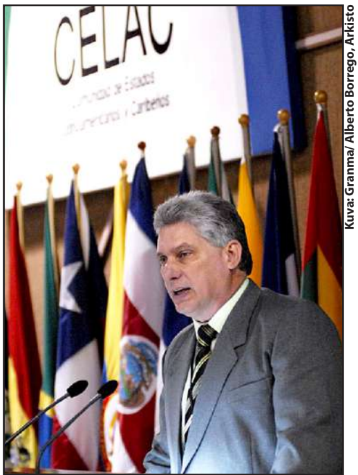
Miguel Díaz-Canel Bermúdez puhui CELACin ensimmäisessä kokouksessa vuonna 2013.

Amerikan ja Karibian talouskomissioon (ECLAC), Latinalaisen Amerikan ja Karibian yhdentymiseen sekä sen kansakuntien veljeyteen ja solidaarisuuteen." Presidentti painotti, että "Kuuban talousvaikeuksista huolimatta, erityisesti USA:n 60 vuotta kestäneestä taloussaarrasta huolimatta, me jatkamme keskittymistä niihin kehitystarpeisiin, joiden tarkoituksena on säilyttää, parantaa ja syventää saavutettuja yhteiskunnallisia saavutuksia Kuubassa. Pyrimme kehittämään oman kansallisen taloudellisen ja sosiaalisen kehityssuunnitelmamme aina v. 2030 asti. Sen strategiset linjat liittyvät kestävän kehityksen tavoitteisiin osana prosessia, jolla päivitetään v. 2011 aloitettu maamme taloudellinen ja yhteiskunnallinen malli."