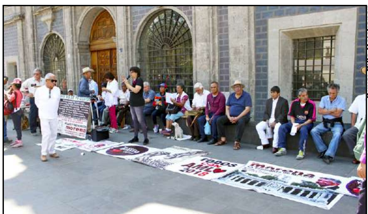
Tällaista kampanjointia heinäkuussa käytyjä presidentinvaaleja varten nähtiin Meksikon kaduilla maaliskuussa. Kansan suosiossa jo sillä hetkellä oli vasemmistoa edustava Andrés Manuel López Obrador, joka myös valittiin presidentiksi.