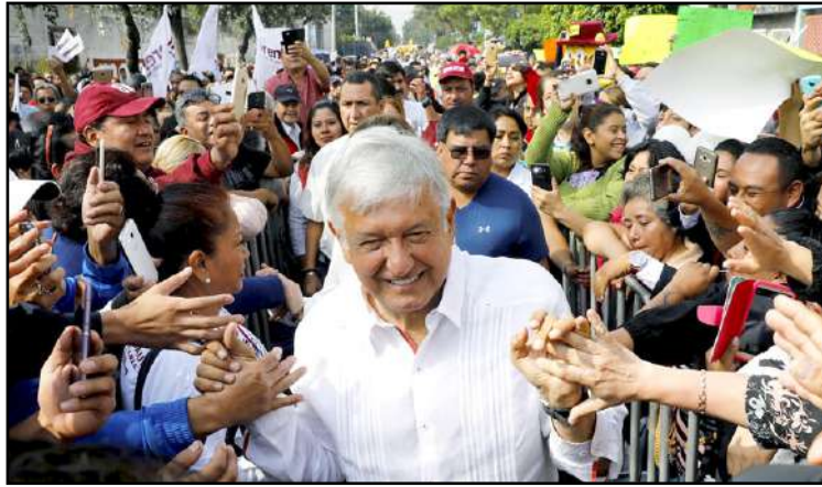
Andrés Manuel López Obrador (AMLO) oli ehdokkaana jo vuosina 2008 ja 2012, jolloin hän hävisi ilmeisen vaalivilpin vuoksi. Nyt vaalijärjestelmän kehittyminen takasi rehellisemmät vaalit. AMLO oli kansan suosikki alusta lähtien ja viihtyy kansan keskuudessa. Kuva vaalilaisuudesta Veracruzin osavaltion 130000 asukkaan Cosoleacaquessa.

– Muutos sisältää maamme korruption hautaamisen. Meksikon kansa on suurten kulttuurien perillinen, siksi se on kunniakas, työteliäs ja älykäs. Korruptio ei ole kulttuurissa, se johtuu poliittisen järjestelmän alennustilasta. Tämä ikävyys on sosiaali-