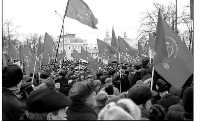
Eläkekamppailu keräsi väkeä kaduille myös 2005. Moskova 22.1.2005

Eläkeuudistuksen vastustaminen muuttui hyvin nopeasti nykyisen vallan vastustamiseksi. Vuoden 2005 suoran linjan puhelinkeskusteluissa Putin esitti varomattomasti järkähättömän ajatuksensa: "Tahton kiinnittää huomionne siihen, että vastustan eläkeikärajaa nostamista. Ja niin kauan kun olen presidentti, ei sellaista päätöstä tehdä". Torjua sellainen selkeä lausunto nyt esittämällä mustan valkoiseksi on osoittautu-