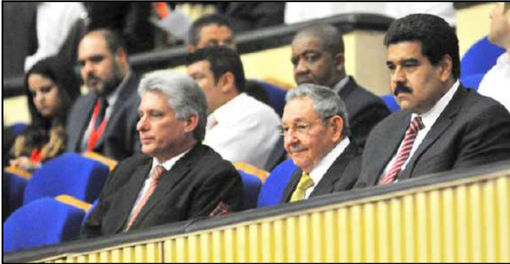
Kuuban nykyinen presidentti Miguel Díaz-Canel Bermúdez, maan entinen presidentti Raul Castro Ruz ja Venezuelan bolivaarisen tasavallan presidentti Nicolás Maduro tapasivat ALBA-TPC-huippukokouksessa.

Raúl Castron toinen viisivuotiskausi Kuuban presidenttinä päättyi 19.4.2018. Maan parlamentti valitsi käytännössä yksimielisesti hänen seuraajakseen Miguel Díaz-Canel Bermúdezin. Villa Clarassa v. 1960 syntynyt uusi presidentti on toiminut aikaisemmin Kuuban varapresidenttinä v. 2013–2018 ja opetusministerinä v. 2009–2012. Hän tulee jatkamaan valtionpäämiehenä Fidel ja Raul Castron viitoittamalla tiellä kuubalaisen sosialismin kehitys- ja rakennustyösää. Hänellä on monipuolinen ammattikoulutus ja vankka työkokemus Kuuban kommunistisen puolueen (KKP) luottamustehtävissä. Hänet on kasvatettu vaihteittain – lisäämällä valtaa ja vastuuta – yhteiskunnan johtotehtäviin. Kuuban entinen presidentti Raul Castro jatkaa edelleen KKP:n ja maan armeijan johdossa.