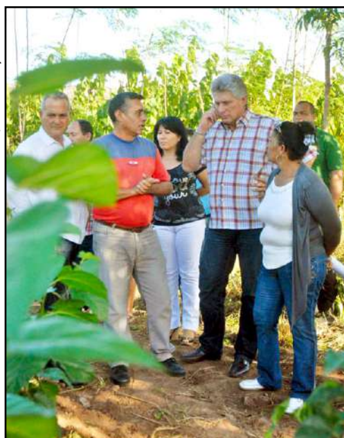
Miguel Díaz-Canel Bermúdez vieraillee Las Tunasin kokeellisella laidun- ja rehuasemalla 1. marraskuuta 2013.

Kuubalainen sosiologi Reina Fleitas odottaa muutoksia, "jotka auttavat rakentamaan tuottavan