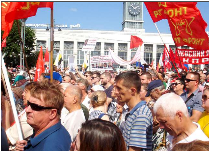
Meille tutulla Suomen asemalla järjestettiin iso mielenosoitus, jossa esiintyivät useat järjestöt mm. "Rotfront" (Venäjän yhdistynyt työväen rintama) ja erilaiset ammatilliset organisaatiot.

Lähteet: Vasemmistorintaman, Venäjän Federaation kommunistisen puolueen, Venäjän kommunistisen työväenpuolueen, Venäjän kommunistien, Rot Frontin, Tassin, Interfaxin ja change.org verkkosivut.