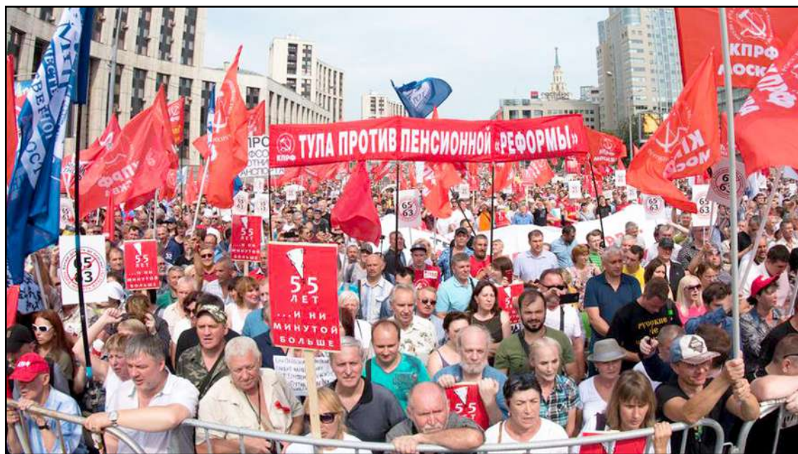
Moskovaan oli saapunut mielenosoittajia myös Jaroslavista, Voronezhista, Tulasta, Kalugasta, Rjazanista, Tveristä, Kostromasta ja muista kaupungeista. Banderolli toteaa: "Tula eläkeuudistusta vastaan"

Venäjän pääministeri Dimitri Medvedevin johtaman porvarihallituksen hanke eläkeiän astettaisesta korottamisesta on nostattanut laajaa vastarintaa kansalaisten keskuudessa. Lakihankkeen mukaan miesten eläkeikä on tarkoitus nostaa 60 vuodesta 65 vuoteen ja naisten 55 vuodesta 63 vuoteen. Siirtymäkausi miehillä olisi ensi vuodesta vuoteen 2028 ja naisilla vuoteen 2034. Hallitus perustelee eläkeiän korottamisen tarvetta ihmisten elinajan odotteen kohoamisella. Porkkanaksi eläkeiän korottamisesta hallitus on luvannut eläkkeiden korottamista. Valtion duuma hyväksyi lakiesityksen Yhtenäinen Venäjä -puolueen äänin ensimmäisessä käsittelyssä 19. kesäkuuta. Venäjän Federaation kommunistinen puolue, Liberaalidemokraatit ja Oikeudenmukainen Venäjä - puolue olivat lakiesitystä vastaan. Laki on tarkoitus hyväksyä syksyllä.