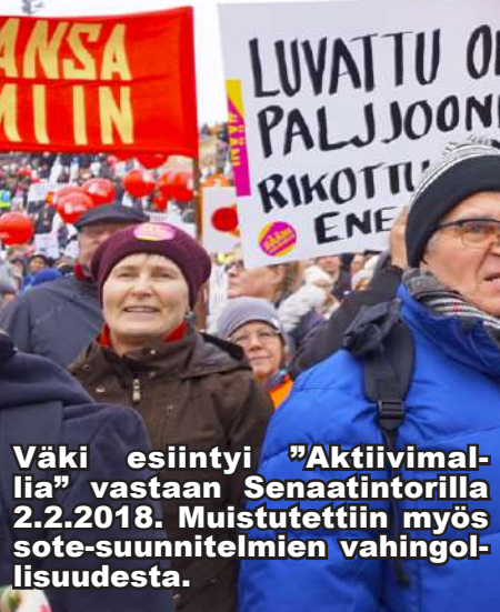
Väki esiintyi "Aktiivimallia" vastaan Senaatintorilla 2.2.2018. Muistutettiin myös sote-suunnitelmien vahingollisuudesta.

Putinismiko lastentautina s.2 Eliitin rahat veroparatiiseihin s.4 Luokkataistelu ranskassa s.7 Raportti Meksikosta s.9 ja 11 Stephen Hawkingin muistolle s.14 Verenpunainen Varkaus s.16 Venäjän presidentinvaalien jälkeensä. 15 Krimiä ei ole miehitetty s.15