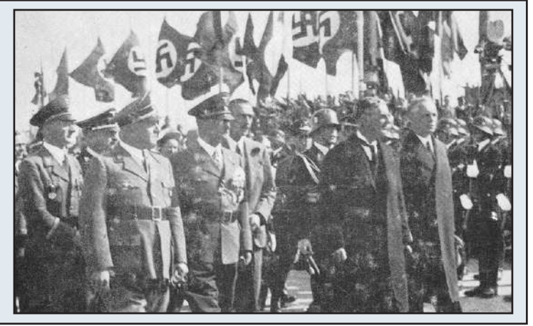
Euroopan markkinamiehet tulossa Münchenin lehmäkaupoille. Chamberlain 2. oikealla esiintyy tässä vastaanottajineen Münchenin lentokentällä.

Hitler lähipiirineen oli ymmärtänyt Chamberlainin olevan kypsä pitkälle meneviin