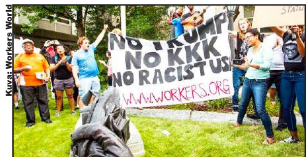
Workers World toimii USA:ssa kansan keskuudessa ja organisoii vastavoimaa, www.workers.org

Hallitsevan luokan Trumpin vastaiselle sektorille sekä erityisesti tiedotusvälineiden ja ajatushautomoiden hallitsevan luokan neuvonantajille, kuten myös demokraattisen puolueen johtajille, hyökkäys Trumpia vastaan perusteenaan todelliset tai oletetut yhteydet Venäjään on täydellinen taktiikka. He toivovat, että FBI:n erikoistutkija Robert Mueller kykenee kaatamaan Trumpin tai saa hänet vetäytymään Venäjä-yhteyksien takia. He turvautuvat kylmän sodan ajattelutapaan, jota ruokki menneisyydessä USA:n ja Neuvostoliiton välinen luokkakantainen vastakkainasettelu. Tämä ajattelutapa motivoi edelleen osaa ulkoministeriöstä ja Pentagonista, vaikka tämän päivän Venäjä on kapitalistinen kil-