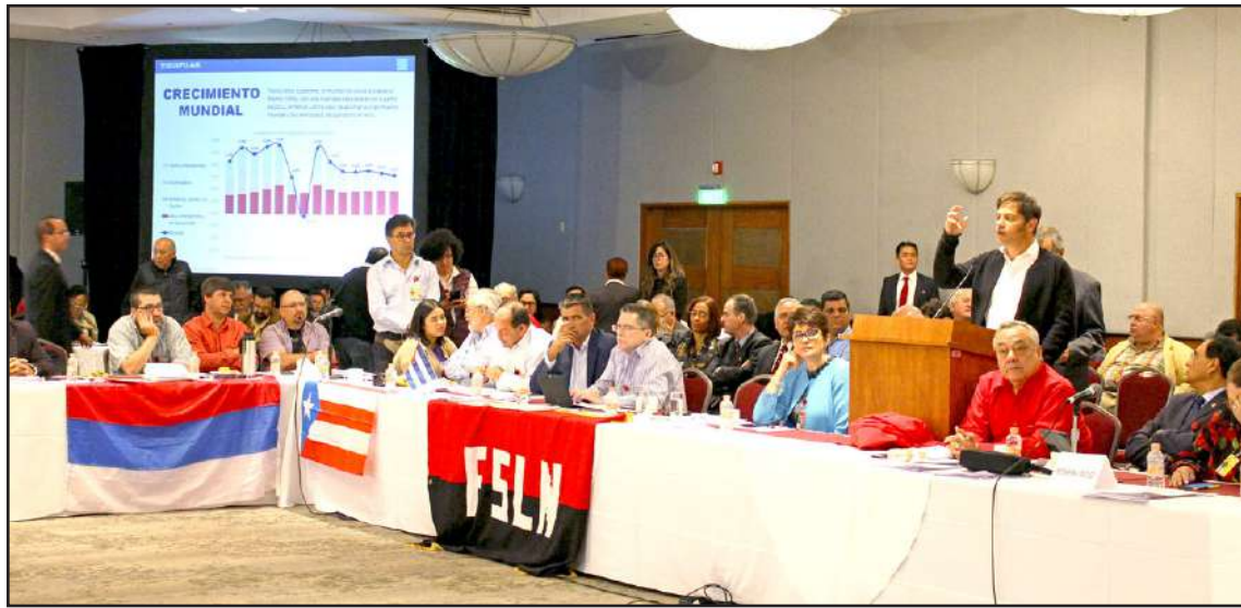
Argentiinan edustaja esitti puolueensa puheenvuorossa kattavan katsauksen maailman talouskriisistä.

Latinalaisessa Amerikassa toistuvat ongelmat tuntuvat kulkevan käsi kädessä ympäri maanosaa, ja kolmi-päiväisen seminaarin monissa puheissa esiin nousi kritiikki Yhdysvaltoja ja uusliberalismia kohtaan. Imperialistit ovat kaataneet hallituk-