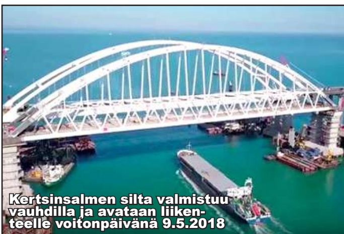
Kertsinsalmen silta valmistuu vauhdilla ja avataan liikenteelle voitonpäivänä 9.5.2018

USA:n kapitalistit sijoittivat 5 mrd dollaria Ukrainan kumoukseen saadakseen maan hallinnon kontrolliinsa ja Natolle Krimistä tukikohdan. Krim on julistautunut kolmesti itsenäiseksi. Sen asukkaat ovat selkeästi valinneet puolensa. Fasistinen Ukraina haluaa rajoittaa Krimin talouselämää. Nyt kuitenkin Krimille avataan Kertsinsalmen poikki kulkeva Euroopan pisin (19 km) silta voitonpäivänä 9.5.2018 ja Krimin talouselämä ottaa ison askeleen eteenpäin. Jokainen voi miettiä olisiko maailma turvallisempi, jos Krim olisi Naton hallussa.