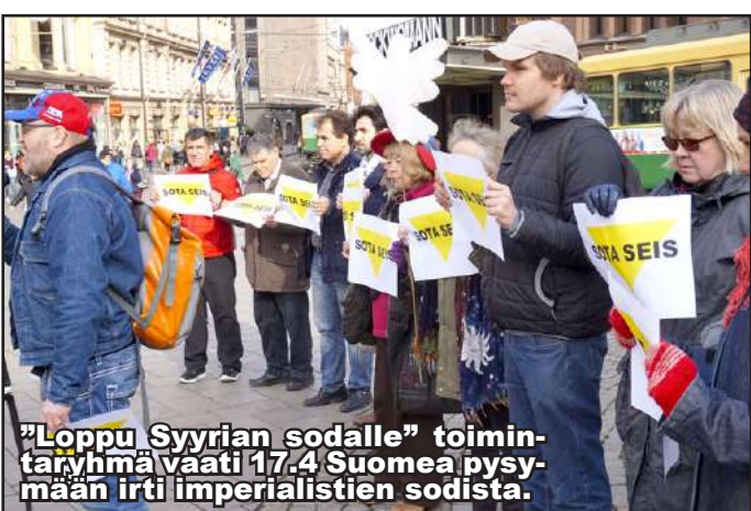
"Loppu Syyrian sodalle" toimintaryhmä vaati 17.4. Suomea pysymään irti imperialistien sodista.

Syyrian sota on jatkunut seitsemän vuotta. USA:n tavoite vaihtaa itselleen "epämielellisten" maiden hallitukset onnistui mm. Irakin ja Libyan osalta. Syyrian hallitus on voittamassa sodan ulkomaisia ääri-islamisteja vastaan. Kriisin jatkamiseksi suoritettiin USA:n johdolla maahan perustelematon ohjusisku. Myös Suomi osallistui Venäjän vastaisiin rankaus-toimiin. Maailman rauhanneuvosto tuomitsi iskun. Meillä "Loppu Syyrian sodalle" toimintaryhmä vaati 17.4. Suomea pysymään erossa kaikista sotatoimista.