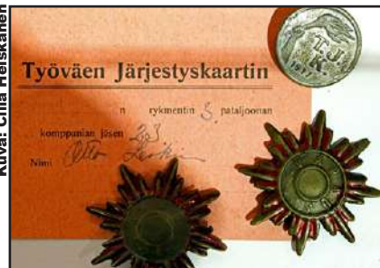
Työväen järjestyskaartin rintamerkki vuodelta 1917 ja Varkauden punakaartin rintamerkit punaisen vallan aikana.

Seuraavina vuosina jäsenmäärä romahti. Osasyynä oli lisääntynyt työttömyys, osittain se, ettei vaikutusmahdollisuuksien nähty olevan kovinkaan loistavat. Työväenliike aaltoili, välissä perustettiin erilaisia harraste- ja raittiusryhmiä, kunnes tehdasalueen omistajavaihdoksen myötä massiivisten raken-