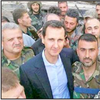
Presidentti Assad vierailulla Itä-Ghoutassa

Yhdysvaltojen diktaattori ja hänen uskolliset Nato-liittolaisensa Iso-Britannia ja Ranska suorittivat 14.4.2018 aamuyöllä yhdessä risteilyohjuksilla raukkamaisen kostoiskun Syyriaan. He päätyivät tähän tekoon, koska ne eivät ole onnistuneet seitsemän vuoden sotaponnisteluista huolimatta kukistamaan presidentti Bashar al-Assadin hallintoa. Toivottavasti risteilyohjuksilla tehty täsmäisku ei tuhonnut kemiallisten aseiden käyttöä parhaillaan tutkivaa OPCW:n komiteaa Damaskoksessa.