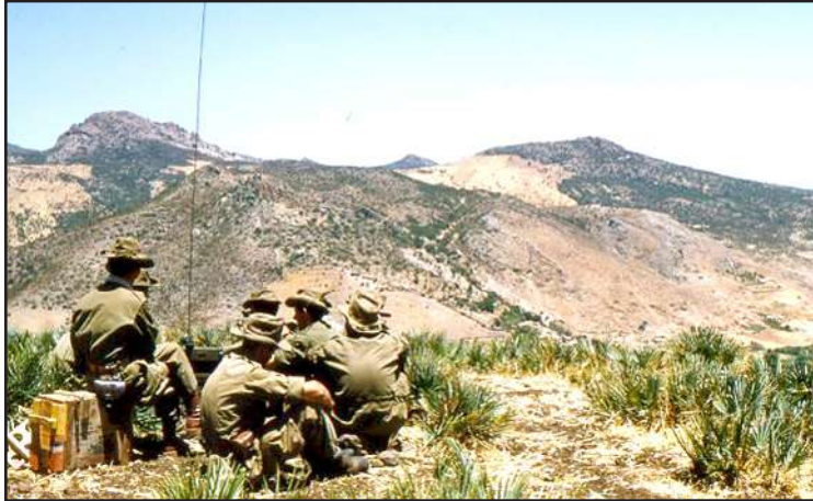
ANL:n sotilaita Souk Ahrais'n taistelussa 1958. Souk Ahrais on hyvin merkittävä vanha kulttuurikaupunki Pohjois-Algeriassa. Myös siellä kuten koko Algerian alueella käytiin Algerian itsenäisyssodan (1954-1962) aikana ankaria taisteluja.

Toisen maailmansodan yksi perussyö oli kapitalistien tarve pistää siirtomaat ja talousresurssit uudelleen jakoon. Kävikin toisin. Japanin tappio ja siirtomaavaltiojen aseman heikentyminen aloittivat siirtomaajärjestelmän luhistumisen. Sitä yritti mm. USA torjua pommittamalla Japania atomiaseella. Siirtomaaisäntä Ranska osoitti heikkoutensa joutumalla Saksan miehittämäksi, josta vapautui ainoastaan liittoutuneiden tuella. Ranska menetti siirtomaansa Indokiinassa hävittyään sodan näiden maiden itsenäisyysliikkeille. Tästäkin rohkaistuneena muodostui Algerian kansallinen vapautusrintama FLN ja sille sotilaallinen siipi ALN. Vuosina 1954-1962 Algeriassa käytiin yhtä verisintä sisällissotaa, joka päättyi Evianin rauhansopimukseen ja Algerian itsenäistymiseen.