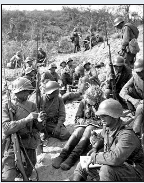
Puna-armeijalaisia Khasan järven taisteluissa elokuussa 1938. Neuvostoliitto kykeni puolustamaan rajojaan ja täyttämään kansainväliset velvoitteensa.

Myös Puola keskitti joukkojaan Tšekkoslovakian rajalle. Puolan Ranskan sotilasasiainministeri ilmoitti Ranskan yleisesikunnalle, että saksalaisten joukkojen tunkeutuessa sudeettialueelle, Puola miehittää Slovakian, joka jaetaan Puolan ja Unkarin kesken. Silloin neuvostohallitus toimitti 23.9.1938 Puolan hallitukselle muistion, jossa todettiin Neuvostoliiton pitävän Puolan tunkeutumista Tšekkoslovakiaan aggression ja irtisanovan Puolan kanssa solmimansa hyökkäämättömyyssopimuksen. Tämä lausunto toimitettiin välittömästi Puolan hallitukselle sekä Tšekkoslovakian Moskovan lähettiläälle Fierlingerille. Neuvostoliitto oli päättävästi Tšekkien puolella.