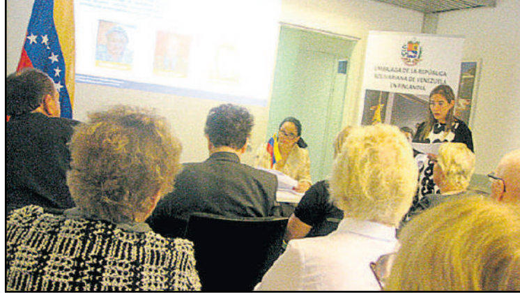
Imperialistipiirit kärjistävät tilannetta Venezuelassa. Toiminta tapahtuu kuten Chilessä ja Neuvostoliitossa. Valtion subventoimaa kulutustavaraa vedetään salakuljetukseen ja salakauppaan ja näin kiristetään tilannetta. Venezuelan suurlähetystön lehdistötilaisuus 9.6.2017

Venezuelan bolivaarisen tasavallan presidentti Nicolas Maduro teki toukokuun lopussa 2017 aloitteen maansa perustuslakia säätävän kokouksen koolle kutsumiseksi. Kansallinen vaalivaltio on ilmoittanut, että kansallisen perustuslakia säätävän kokouksen (ANC) jäsenten vaali järjestetään heinäkuun viimeisellä viikolla kuluvana vuonna. Kokouksen saatua työnsä päätökseen noin vuoden sisällä pidetään kansanäänestys, jossa hyväksytään tai hylätään ANC:n perustuslakiin tekemät muutokset. Kokous kutsutaan koolle, jotta välttyäisiin sisällissodalta, ratkaisemaan ristiriidat hallituksen ja parlamentin välillä sekä etsimään demokraattinen ratkaisu Venezuelan nykyiseen tilanteeseen. Perustuslakia säätävän kokouksen tavoitteina ovat yhteiskuntarauha, toimet dialogin saavuttamiseksi oikeisto-oppositio kanssa; sopimus, joka johtaa uudistettuun perustuslakiin; uusi talousmalli öljyteollisuuteen perustuvan mallin sijalle; nuorison aseman parantaminen; sosiaaliset missiot sekä muut näkökohdat, joita ei ole huomioitu maan nykyisessä perustuslaissa.