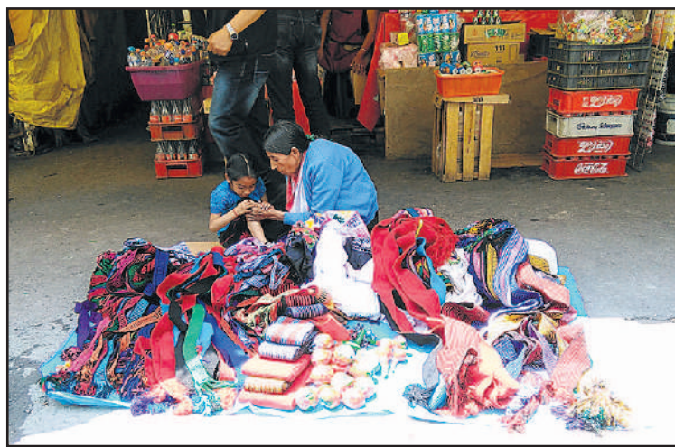
Latinalaisessa Amerikassa perheen merkitys ja toisista välittäminen on aivan eri tasolla kuin länsimaiden yksilökeskeisessä yhteiskunnassa.