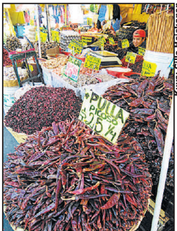
Nuoret myyjät kuuluvat markkinoiden ilmeeseen.