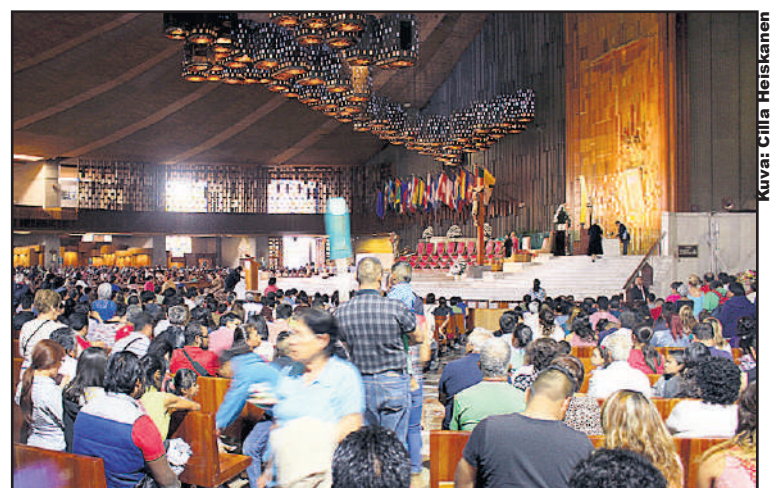
Katolinen messu Guadalupen basilikassa. Kirkko pimeni välillä taustalla pauhanneen ukkosmyrskyn vuoksi ja teki tunnelmasta entistä tiiviimmän.