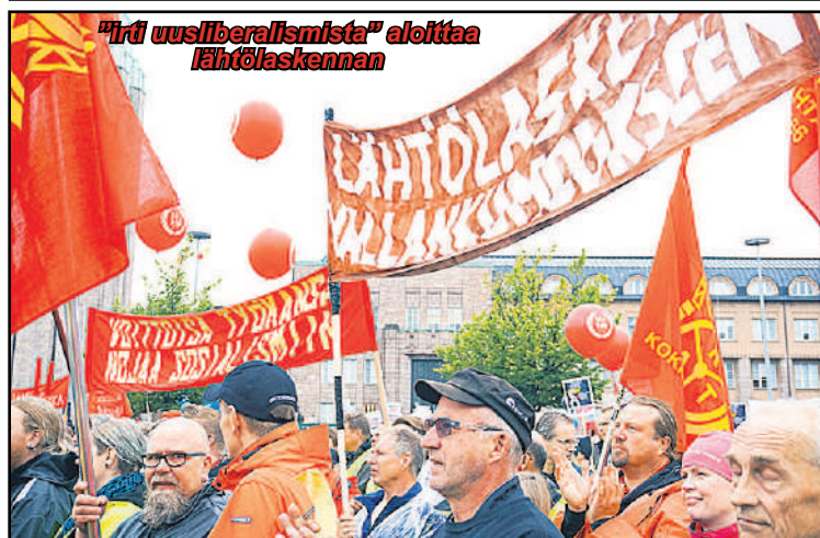
Kuva: Heikki Mämmikkö

Oliko se "jumalan ääni", joka vappuna mölisi pääkallon paikalta SAK:n puheenjohtajan äänellä? Vai oliko se sittenkin EK, joka ehdotti pysyvää pyöreän pöydän neuvostoa ratkomaan työmarkkinoilla syntyviä erimielisyyksiä. Näin vältyttäisiin turhalta lakkoilulta. Jumalanääni se oli ainakin JHL:n Joensuun osaston puheenjohtajan mielestä, joka kaikuna vastasi, miten viisas teko Elorannalta oli leikata julkisten alojen työntekijäin lomarahoja 30 % kiky-sopimuksen aikaansaamiseksi.