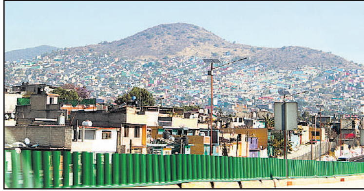
Slummit levittäytyvät Méxicon kaupungin ulkopuolella.

Vielä mykistävämpää oli nähdä matkan varrella vuoren rinteillä levittäytyvät slummit , missä asuu enemmän ihmisiä kuin koko Suomessa. Opas kertoi, että ih-