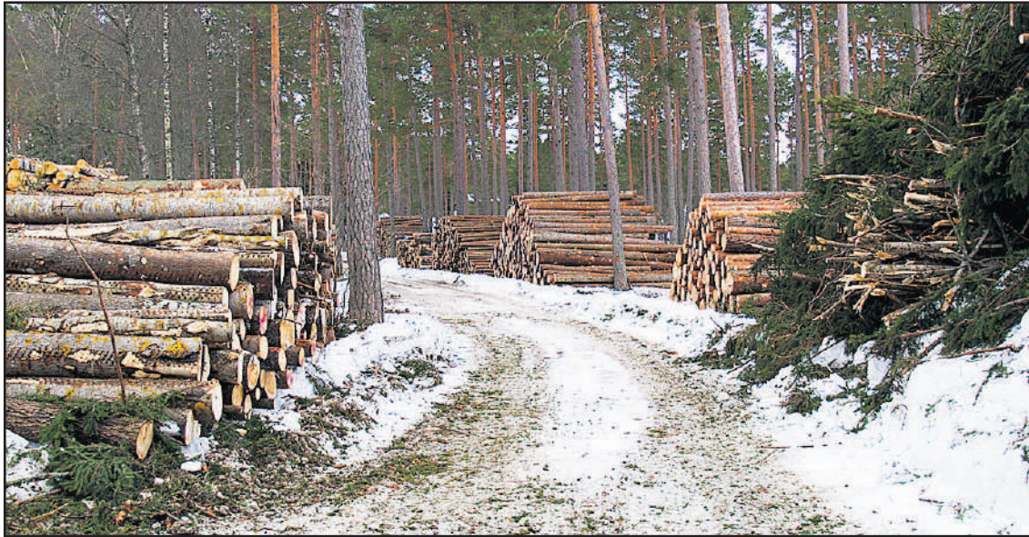
Voimakkaan metsän hakkuun huomaa jokainen luonnossa liikkuja. Monilla alueilla viime vuosina jopa puolet metsistä on hakattu. Sieni- ja marja-sadot on menetetty. Maisemat muuttuvat, kun kalliot ja kivet paljastuvat avohakkuiden jälkeen. Aukeiden reunoilla voimistuvat myrskyt tekevät tuhojaan. Luonto- ja ilmastoarvoilla tätä kehitystä on vaikea perustella. Ainoa syy näyttää olevan ahneus.

Maailman mittakaavassa hiilidioksidi on tärkein kasvihuonekaasu ts. sen lisääntyminen ilmakehässä voimistaa kasvihuoneilmiötä. Hiilidioksidipäästöjen hillitsemisessä metsillä ja merillä on iso merkitys. Ne toimivat hiilivarastoina ja hiilinieluinä. Hiilivarastoilla tarkoitetaan metsien osalta puustoon ja maaperään sitoutuneen hiilen määrää. Hiilinieluja metsät ovat silloin, kun niissä tapahtuu enemmän hiilen sidontaa kuin hiilen vapautumista vuodessa. Vastaavasti jos metsistä vapautuu enemmän hiiltä kuin sinne sitoutuu, ne ovat hiilen lähde. Metsäkadon arvellaan aiheuttavan nykyisin noin 10 % ihmistoiminnan kasvihuonekaasupäästöistä.