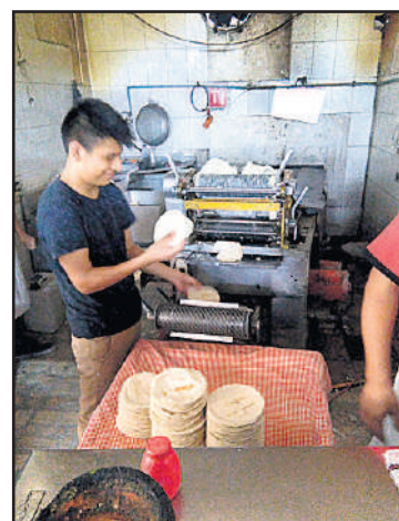
Tortillan tekoa Guerreron markkinoilla.

Seuraavana päivänä ajelimme sekä paikallisbussilla että metrobusilla ja päädyimme läheiseen Colonia Guerrero kaupunginosaan. Alueella on huono ja vaarallinen maine, mutta en kokenut oloani turvattomaksi. Näimme yhdessä vaiheessa noin kymmenen poliisiauton saattueen kiitävän ohitsemme sireenit hutaen ja poliisit aseet tanassa, mutta sekin oli vain pikantti lisä päivään - vaikka tietenkään Meksikoa ravistelevassa huumesodassa ja kapitalismin aiheuttamassa rikollisuudessa ei ole mitään ihannoitavaa. Maan entisen presidentin Felipe Calderónin yhdessä Yhdysvaltain kanssa aloittama huumekartellien vastainen sota on vain pahentanut Mek-