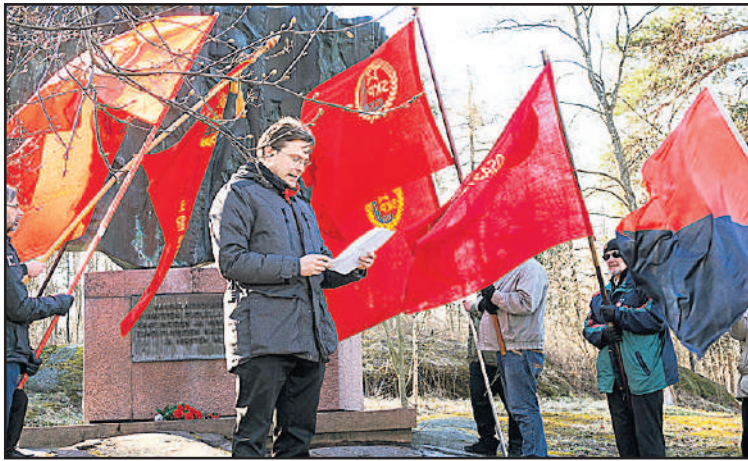
Vappuna, itsenäisyyspäivänä ja luokkasodan muistopäivinä vierailee järjestöväki punasotilaiden muistomerkeillä. Tilaisuus valtakunnallisella Punaisten muistomerkillä Helsingin Eläintarhassa Vappuna 2017.