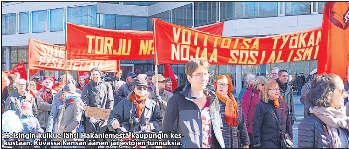
Helsingin kulkue lähti Hakaniemestä kaupungin keskustaan. Kuvassa Kansan äänen järjestöjen tunnuksia.