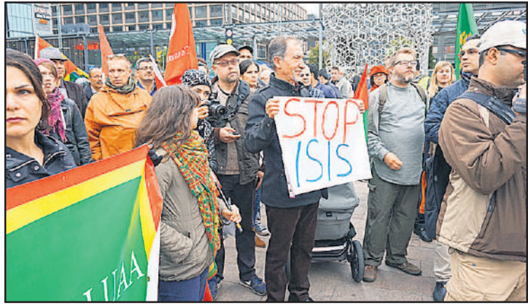
Satojen protestojen voimin kurdit tuomitsivat 24.9.2016 Erdoganin toimet ja vaativat 43 miljoonan kurdin nimissä Öcalanin vapauttamista. Kuten artikkelin kirjoittaja arvelee pidetään Rojavaa lähes itsenäisenä. Tulisi kyllä miettiä, kuka sodan jälkeen suojelee tätä itsenäisyyttä.

sen valtansa - kyseessä oli presidentin toimivaltuuksien laajentaminen, kun presidentti sai oikeuden hyväksyä toteutettaviksi pakollisia asetuksia, hajottaa parlamentin jne. Poliittisesti vakuuttavan voiton piti vapauttaa hänen käteensä. Gallup-tutkimusten perusteella näytti siltä, että näin tulee myös tapahtumaan, mutta todellisuus osoitti, että useat ihmiset eivät yksinkertaisesti vain uskaltaneet lausua mielipiteitään. Korjaukset perustuslakiin hyväksyttiin virallisesti, mutta vain hyvin vähäisellä äänten enemmistöllä - puolesta oli äänestänyt vain 51,3 % äänestäjistä. Virallinen enemmistö kärsi hieman yli yksi miljoona ääntä.