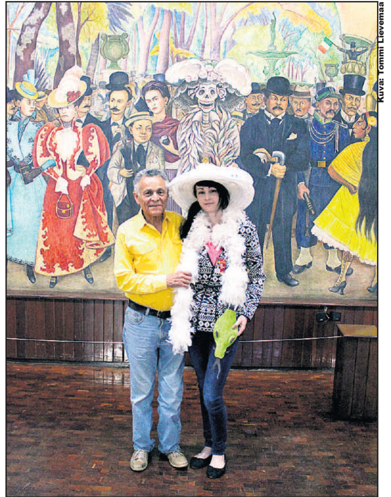
Diego Riveran museossa oppaamme kanssa. Kokeiltavana oli myös maalauksessa esiintyvien hahmojen käyttämiä asusteita.