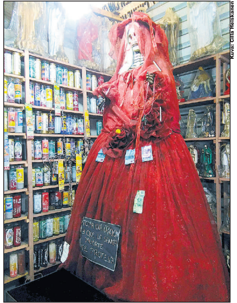
Santa Muerte rituaalivälineiden ympäröimänä.

La Mercedistä jatkoimme matkaa taksilla Centro Históricoon eli historialliseen keskustaan. Alueen vanhimmat rakennukset on peräisin 1500-luvulta ja osassa näkyy espanjalaisvalloittajien arkkitehtoninen tyyli. Koristeellisia kirkkoja oli useampikin lyhyen kävelymatkan sisällä muistuttamassa Latinalaisen Ame-