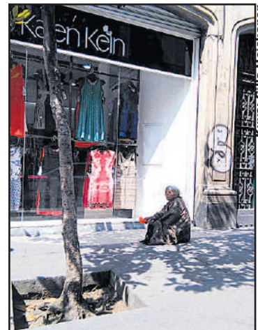
Luokkaerot kulminoituvat Centro Históricoissa.