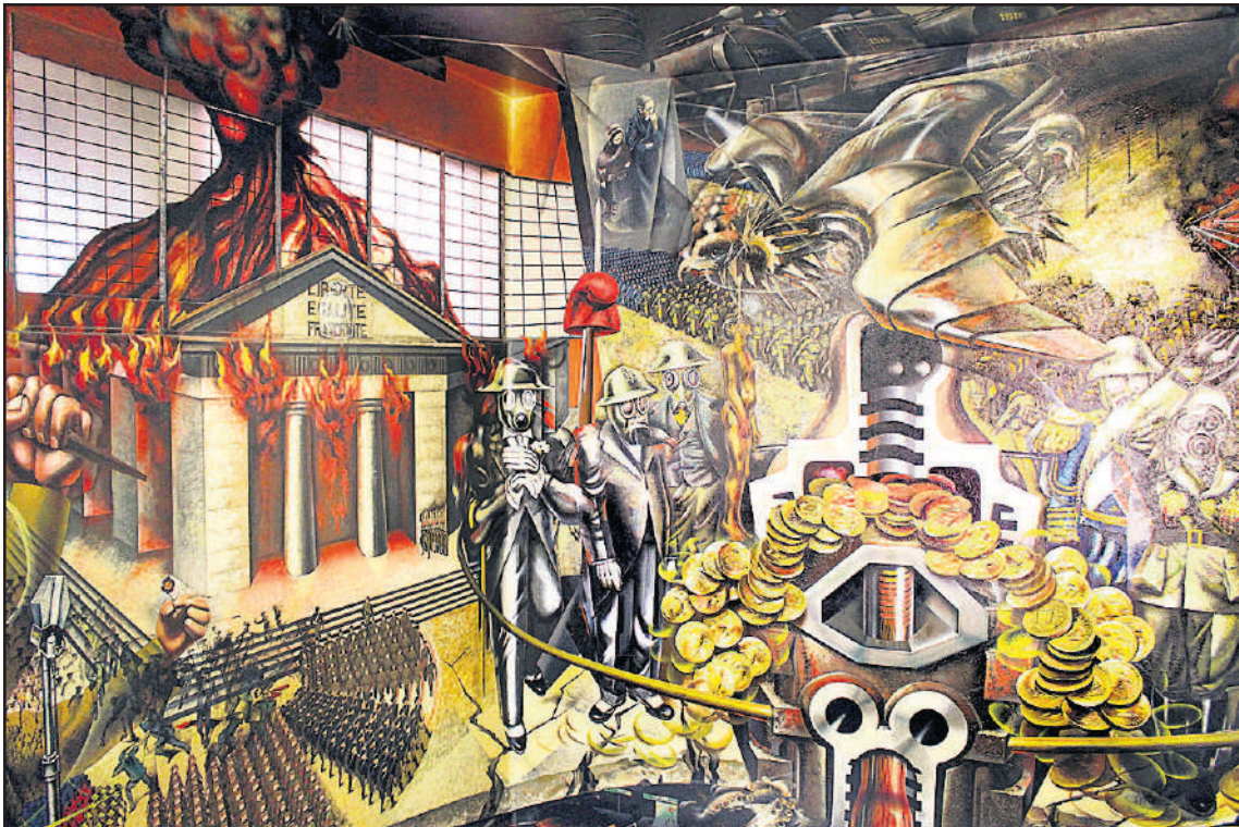
Siqueirosin muralista löytyy suurvaltopolitiikan symbolismia.

Matkustin maaliskuun lopussa Meksikon pääkaupungissa järjestettyyn kommunististen ja työväenpuoleiden yhteiseen "Los partidos y una nueva sociedad"-seminaariin. Seminaaripäivien ohessa saimme tilaisuuden tutustua Méxicon kaupungin arkeen ja sen tarjoamiin monipuolisiin kokemuksiin. Majoituimme viiden tähden Fiesta Americanassa, joten ympäristö ei sinällään tarjonnut autenttista näkymää meksikolaiseen elämään. Erään päivän päätteeksi kävimme seminaariväen kanssa kaupungin toisella laidalla ravintolaillallisella ja siellä pääsimme toki nauttimaan meksikolaisista ruuista ja ihastuttavasta livemusiikista. Jäin kuitenkin kaipaamaan rosoisempaa pintaa. Niinpä ilo oli ylimmillään, kun eräs seminaarivieras, paikallinen vanha herrasmies tarjoutui näyttämään meille aitoa Meksikoa. Ilman hänen tietämystään ja kielitaitoaan olisimme tuskin saaneet ympäristöstä yhtä paljoa irti.