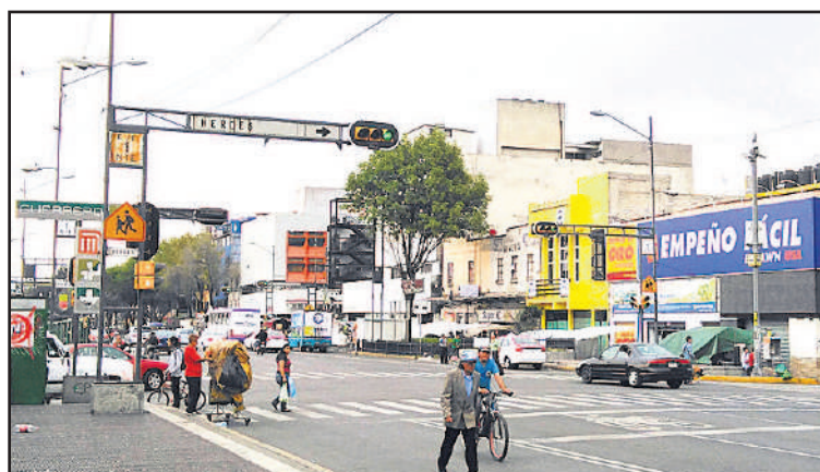
Guerreron kaupunginosa tulvi aitoa meksikolaista tunnelmaa.