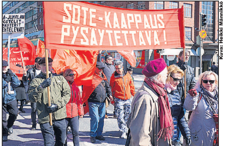
Sote-kaappaus on uusliberalismin keskeinen ilmentymä. Kun tappelemme Sote:n peruuttamiseksi kampeamme samalla uusliberalismia. Se ei onnistu keneltäkään yksin. Yhteiskunnan demokratisoimiseksi ja kapitalistien vyörytyksen kääntämiseksi on liittouduttava yhteen.

Kuntavaalien jälkeen Kansan äänen julkaisijajärjestöt ovat keskenään käyneet keskusteluita poliittisista ja järjestöillisistä menetelmistä työväenluokkaa edustavan vaihtoehtoliikkeen rakentamiseksi. Kommunistien Liitto käsittelee kokouksessaan 20.4.2017 laajan yhteistyön merkitystä ja välttämättömyyttä nykyisen markkina-vetoisen uusliberalistisen yhteiskuntapolitiikan murtamiseksi ja teki SKP:lle ja KTP:lle asiasta yhteistyöesityksen.