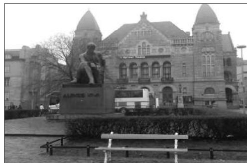
Suomen kulttuurimaisema; Aleksis Kivi ja Kansallisteatteri Helsingin Rautatiekatulla