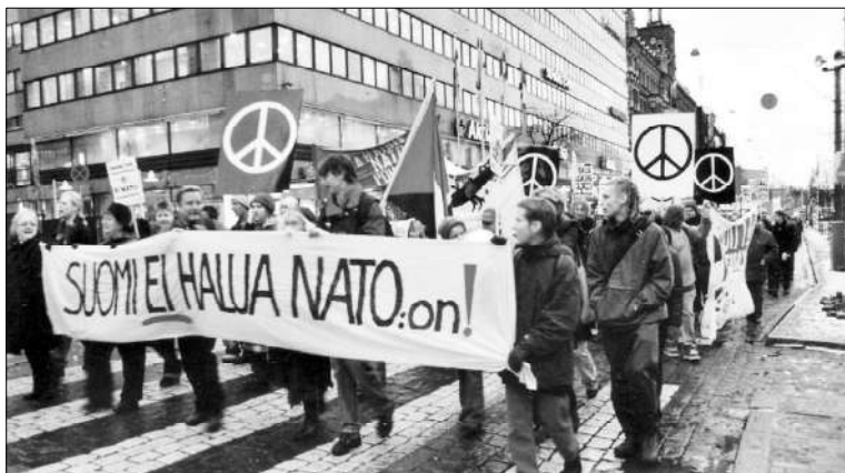
Voimakas enemmistö suomalaisista vastustaa edelleen Nato-jäsenyyttä

Maamme poliittisen ja taloudellisen eliitin mielestä Suomen ulko-, turvallisuus- ja puolustuspolitiikan tärkeimmät tehtävät ovat Suomen itsenäisyyden, alueellisen koskemattomuuden ja perusarvojen turvaaminen, väestön turvallisuuden ja hyvinvoinnin edistäminen sekä yhteiskunnan toimivuuden ylläpitäminen.