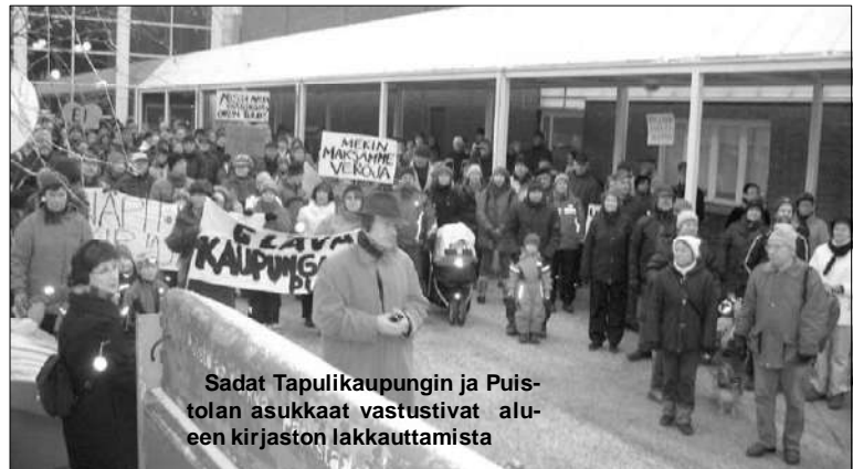
Sadat Tapulikaupungin ja Pui- stolan asukkaat vastustivat alu- een kirjaston lakkauttamista