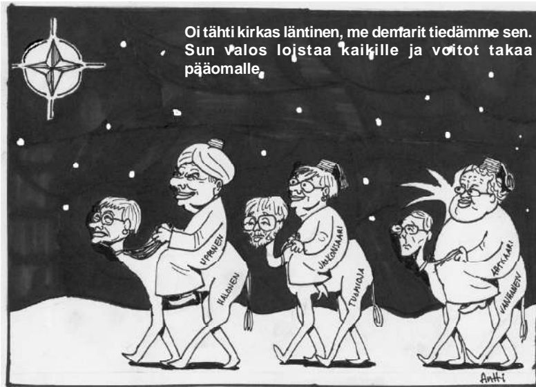
Tämä Antin piirros on lehtemme numerosta 6/2003. Piirros on edelleenkin mitä ajankohtaisinta. Vain henkilöt ovat tässä välissä vaihtuneet demareista Kokoomukseen.