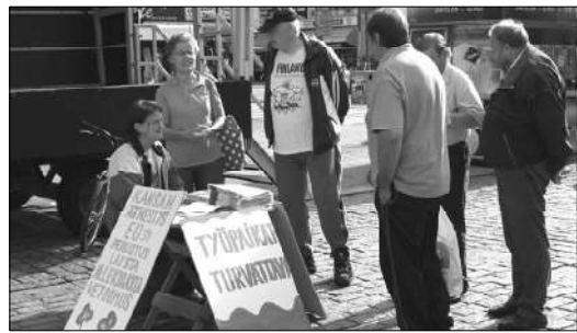
Kuvassa STP:n vaalitilaisuus Turun torilla, jonka alle liikemiehet suunnittelevat parkkihallia.

Turun raha-asioita on hoidettu täysin värin. Huonosti hoidetuista raha-asioista on olemassa esimerkkejä. Parkkitalo Louhi, jonka Turku rakennutti on tuottanut vuosittain kymmenien miljoonien tappiot. Turun kaupungin budjetti on jälleen tappiolla yli 31 miljoonaa ?. Turun Kaupunginvaltuusto totesi, että muutaman vuoden päästä Turun kaupungin budjetti on miinuksella yli 100 miljoonaa Euroa. Turun raha-asioita on ryhdyttävä hoitamaan oikein. On luovuttava hankkeesta rakentaa Kauppatorin alle liikemiespiireille oma Parkkihalli. Se saastuttaa ilmastoja ja Ilmastonmuutosta ei torjuta Parkkihallein. Lisäksi se haittaa torimyyntiä keskeyttämällä rakentamisen ajaksi