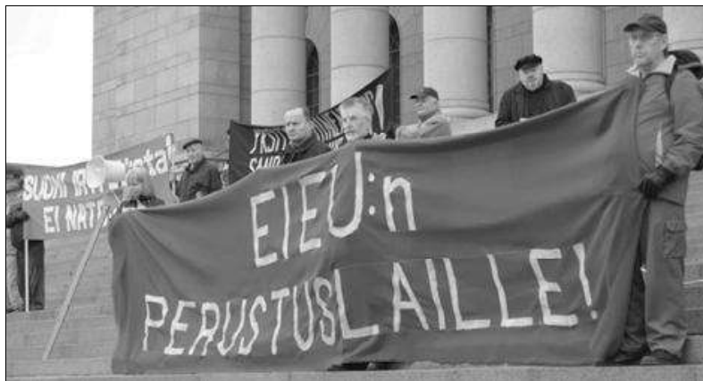
Kansalaisten enemmistön mielipiteistä piittaamatta Eduskunta hyväksyi 5.6. 2006 EU:n perustuslain presidentin rafioitavaksi. Kuva kansalaisjärjestöjen 1.12. 2006 mielenosoituksesta.

Kirkon valta muutti tilanteen aivan totaalaisesti, kun kansa menetti suvereniteettinsä, ja tuli vieras isäntä armeijoinen, lakeinen ja veroinen. Sotajoukkojen turvin ruotsalainen yläluokka hallitsi suomalaista kansaa. Vierias isäntä oli kansakunnalla useita satoja vuosia, Ruotsin kuningas vain vaihtui uudemmalla ajalla Venäjän keisariin. Lopulta Venäjän kansa kaatoi keisarin ja hävitti