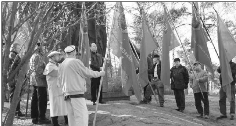
Kuva on otettu viime Vappuna Helsingin Eläintarhan v. 1918 Punaisten Valtakunnalliselta muistomerkiltä

Luokkasota, vapaussota, punakapina, kapina, veljessota, torpparikapina, kansalaisota, sisällissota jne. Sanotaan, että rakkaalla lapsella on monta nimeä. Puhuttaessa Suomen vuoden 1918 tapahtumista tuskin voidaan puhua irakkaasta, mutta joka tapauksessa merkittävästä tapahtumasta. Tuoloin juuri itsenäistyneessä Suomessa työkanasa pyrki murtaamaan vanhat kahleet ja luomaan uuden, paremman yhteiskunnan.