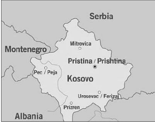
Kosovolla on ollut satojen vuosien historia osana Serbiaa, vaikka serbiäestön ja albanialaisen väestön välillä on kitkaa ollutkin. Jugoslavian ollessa olemassa väki tuli kuitenkin toimeen keskenään, mutta nyt tilanne on pahempi.

Hampaitaan oli näyttämässä Kosovon uusi pääministeri Hashim Thaçi viime sunnuntai-iltaan asti (9.12.2007). Jo heti valintansa jälkeen 17. marraskuuta terroristijärjestö UCK:n entinen johtaja ja sotarikollinen Hashim Thaçi asetti maanantain (9.12.2007) takarajaksi Kosovon yksipuoliselle itsenäiseksi julistamiselle. Maanantaina Thaçi peruutti uhkauksensa ja kertoi, että siihen tarvitaan kuitenkin ensin USA:n ja EU:n suostumus. Tällä tavalla kovan linjan sotahaukka luottaa lännen ystävänsä pyyntöihin jatkaa diplomaattisia pyrkimyksiä vähän aikaa.