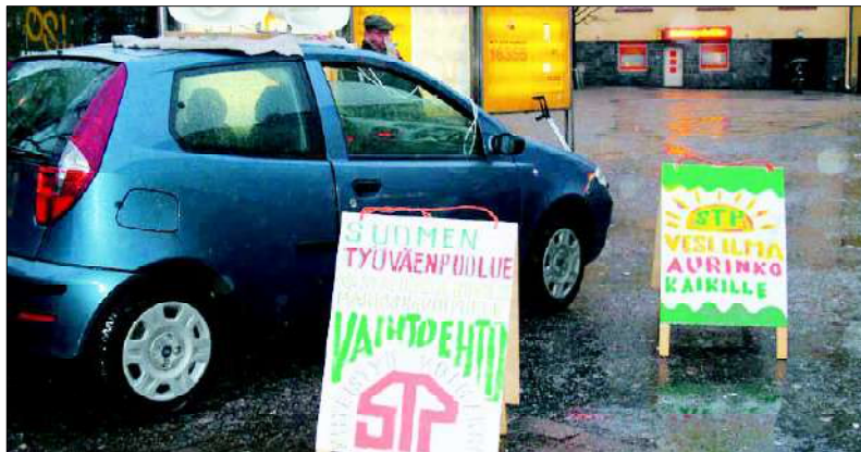
STP esiintyi itsenäisyyspäivänä Sörnäisten Metroasemalla ja vettä satoi.

Suomen Työväenpuolue esitelti tavoitteitaan Itsenäisyyspäivän aikana Helsingin katukuvassa. Sateisista säistä huolimatta ihmiset jaksoivat pysähtyä keskustelemaan ja olivat aidosti kiinnostuneita puolueemme tavoitteista.