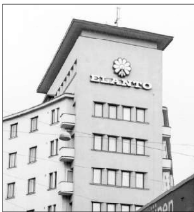
Entiset Elantolaiset olisivat toivoneet, että vanha Elannon logo ampiaisinaan olisi jätetty paikalleen Helsingin Sörkan Kurvaan.

Osuusliike HOK- Elannon vaalit käydään 22.2.-7.3.2008. HOK- Elanto syntyi Helsingin Osuuskaupan ja Osuusliike Elannon yhdistämisen tuloksena. Aiemmin monet meistä keskittivät ostoja Elantoon. Elannon kaupallisuutta painottanut johto ei antanut arvoa tälle sitoutumiselle. Se unohti, että työväen osuuskuntien tarkoitus oli tuottaa kuluttajille hyviä ja hinnaltaan edullisia tuotteita sekä tukea työväenliikettä. Monet kysyvät, kannattaako vaikuttaa HOK-Elannon? Kannattaako äänestä?