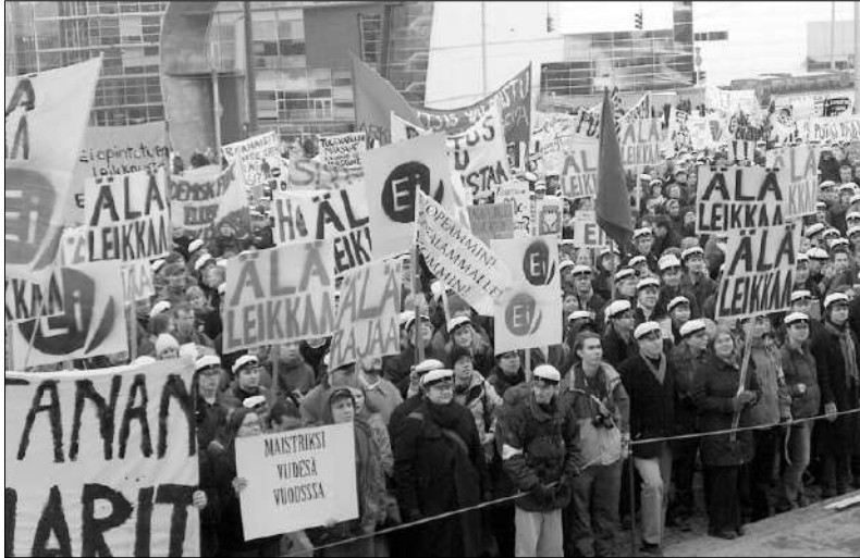
Opiskelijat ovat viime vuosina myös havahtuneet vaatimaan korjauksia omaan asemaansa. Tässä ylioppilaat vaativat korotuksia opintotukeensa, jota ei oltu nostettu 15 vuoteen.

Í Työväenluokalla tarkoitetaan historiallisen luokkakehityksen lopputuloksena syntyneää väestöryhmää, joka on taloudellisten pääomien, peruskouluun korkeamman koulutuksen ja yhteiskunnallisten valtaroolien ulkopuolella, määriteltiin työväenluokan kriteereitä edellisessä Kansan Äänen numerossa.