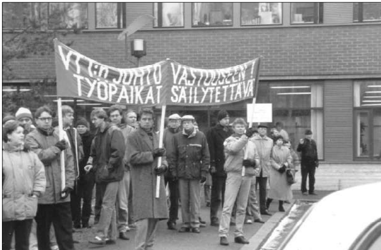
VT:n työntekijät osoittivat ensimmäisen kerran mieltään työpaikkojensa puolesta v. 1994.

Tänä päivänä on meneillään saneerauksen uusi aalto. Huonosti toteutettu ja kallis organisaatiouudistus aiheutti viime vuonna huomattavat