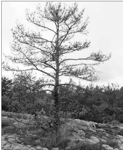
Tämä ja monet muut viereiset puut kasvoivat tällä paikalla 59 vuotta. Toissakesästä kuivuttua ne eivät enää kestäneet. Äärimmäiset sääilmiöt ovat ilmastonmuutoksen mukanaan tuomia ongelmia.

Vuonna 2010 päättyy Kioton ympäristösopimus, jolla pyrittiin hillitsemään kasvihuonekaasujen päästöjä maailmanlaajuisesti. Balilla joulukuun alussa neuvoteltiin Kioton sopimuksen korvaavasta uudesta ympäristösopimuksesta. Kasvihuoneilmiön voimistuminen on tosiasia, joten kovin paljon aikaa ei ole hukattavaksi.