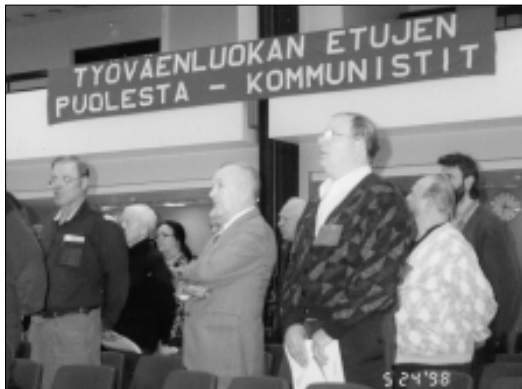
Kuva KTP:n edustajakokouksesta vuodelta 1998. Banderollit ja juhlat eivät vielä riitä, vaan aatteet pitää muokata poliittiksi, ja siihen tarvitaan perusteellista marxilaisista yhteiskunnan tutkimista.

Kommunistien Liitolla ja KTP:lla oli sama ohjelma KTP toimi perustamisensa jälkeen pitkään ilman periaateohjelmaa. KTP:n ohjelma laadittiin vasta vuosina 1995-1996, kun itse puolue perustettiin v. 1988. Silloin halusimme marxilais-leniniläiseen yhteiskuntatieteeseen perustuen arvioida perusteellisesti sosialismin alasajon jälkeen syntynyttä yhteiskunnallista tilannetta ja kommunistien uutta taktiikkaa.