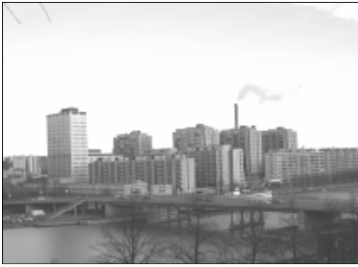
Rakennusliike Hakan yksi merkittävimmistä rakennuskohteista on ollut kuvassa oleva Merihaka lähellä Hakaniemen toria Helsingissä.