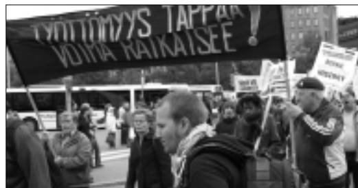
Turkulaiset marssilla Helsingissä 1. joulukuuta EU:n perustuslain ratifiointia vastaan.

Parkkihalleja on rakennettu monia, Eskelin, Julinin, Puutorin, ja Louhen hallit, jotka eivät paljon työllistä, vaan ovat aiheuttaneet vuosittain suuria tappioita. Kaikesta huolimatta on vielä suunnitteilla ryhtyä rakentamaan Kaupattorin alle omaa parkkiluola, jonka viereen on esitetty uutta Kävelykatua. Parkkiluola ja Kävelykatu ovat aivan järjettömiä hankkeita, koska kaikki entisetkin parkkihallit ovat tuottaneet pelkää tappiota. Mikäli parkkiluola torin alle rakennettaisiin, keskeytyisi