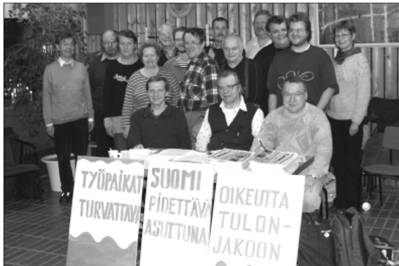
Tässähän tämä, Suomen tämänhetkisen työväenliikkeen "hurja joukko" kokoontuneena 9. joulukuuta Vähäjärvellä. Kuvasta puuttuu vain kuvan ottaja, Heikki Männikkö.

Seminaarin suurin saavutus oli kuitenkin vaaliohjelma, joka ristittiin heti Hauhon-Mäntsälän vaaliohjelmaksi vertauksena vuoden 1903 Forssan ohjelmalle. Tällaiselle vertaukselle onkin aiheensa. Suomen työtätekevän kansan tilanne muistuttaa nyt paljon tuota yli sadan vuoden takaista tilannetta.