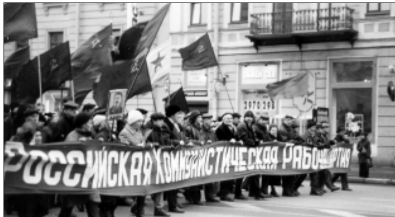
Kuva Lokakuun vallankumouksen 86. vuosipäivän marssista Pietarissa 7.11.2003.