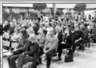
Elisan työntekijöitä kokouksessa