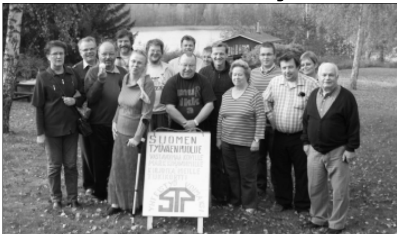
STP:n ja Kansan äänen järjestöjen yhteisen seminaarin osanottajat Vähäjärven kurssikeskuksen pihalla. Seminaarissa keskusteltiin mm. STP:n kannattajakorttikeräystä ja valmistautumista ensi vuoden kunnallisuusvaaleihin.

STP järjesti syysseminaarinsa viikonvaihteessa 29.9.2007 Hauhon Vähäjärvellä. Merkittävintä tilaisuudessa oli tieto, että STP:n viime Vappuna aloittama kannattajakorttikeräys on saatu päätökseen. Reilusti yli 5000 kannattajakorttia viedään oikeusministeriöön keskiiviikkona 3. lokakuuta, jonka jälkeen STP tulee saamaan takaisin asemansa rekisteröitynä puolueena.