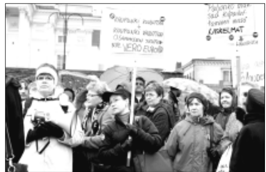
Kuntien työntekijät ovat joutuneet kautta linjan ahtaalle. Palkkoja poljetaan, työsuhteita määräaikaistetaan. Kuva Helsingin kaupungin palvelukeskuksen työntekijöiden mielenilmaisusta v. 2005.