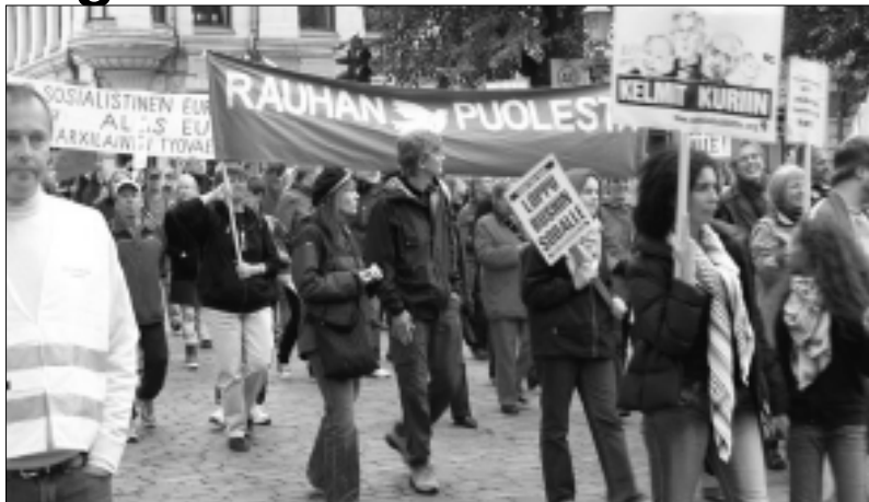
Rauhan puolesta marssitaan jatkuvasti ympäri maailmaa - ja siihen on aihetta! Tässä kuva jostain niistä lukuisista marseista mitä Helsingissä on järjestetty.

Uhrien joukossa oli kaksi vuotta vanha vauva. Viime viikonloppuna (19. ja 20.10.) taisteissa Helmandin provinssissa kuoli yli 50 ihmistä yhteensä. Lapsi sai osuman päähän kotinsa ovensuussa. Amerikkalainen sotilas selitti, että hän yritti pysäyttää ohi ajavaa autoa. Natovetoiset ISAF-joukot pahoittelivat "vahinkoa" ja lupasivat tekemänsä vielä kerran vielä yhden tutkimuksen tapauksesta.