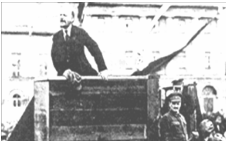
Lenin oli tullut takaisin maanpaosta ja Venäjällä oli vallankumouksellinen tilanne ja Lenin tiesi sen.