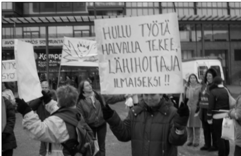
Kuva 14.11.2006 Helsingin Narinkkatorilla pidetystä terveydenhoitoalan palkkamielenosoituksesta.

Budjettiriihi päättyi ratkaisuun, että arvonlisävero laskee 5 % lokakuussa 2009. Kokoomus on ottanut asiaan linjauksen, että jos ruoan arvonlisäveroa kevennetään, on kevennettävä myös valtion tuloveroja. Se on ainoa progressiivinen vero, joten siitä hyötyisivät ennen muita ja eniten suurituloiset. Budjettiriihessä päätettiin, että tuloveroihin tehdään ansio-astan nousua ja inflaatiota vastaavat lievennykset. Tässäkin hallituksen aikomuksena on saada suurin hyöty suurituloisille äänestäjilleen.