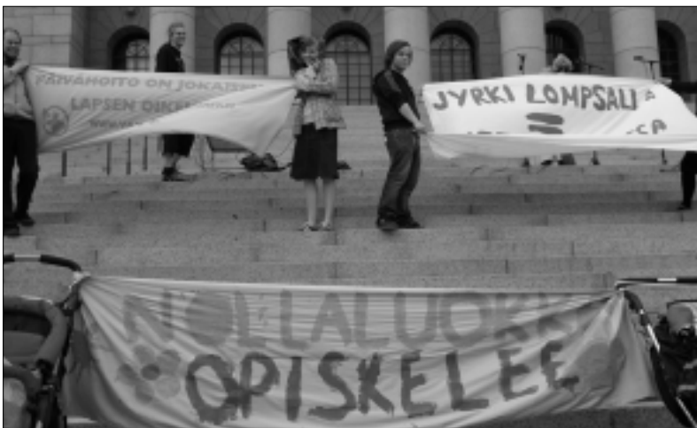
Eduskuntatalon portailla on ollut viime aikoina paljon käyttöä, kun erilaiset kansalaisryhmittä ja -järjestöt ovat osoittaneet mieltään hallituksen budjettiesitystä vastaan.

Hallituksen kehysbudjettiesityksessä lapsen päivähoitomaksun nollamaksuluokkaa poistetaan, jota perustellaan sillä, että kotona olevia vanhempia näin ohjattaisiin hoitamaan lapsensa itse. Vanhemmat eivät kuitenkaan Suomessa käytä lasten päivähoitopaikasta perusteita. Suomi on Euroopan kotihoidonvaltaisempia maita ja vanhemmat, jotka ovat siihen erittäin hyvä syy.