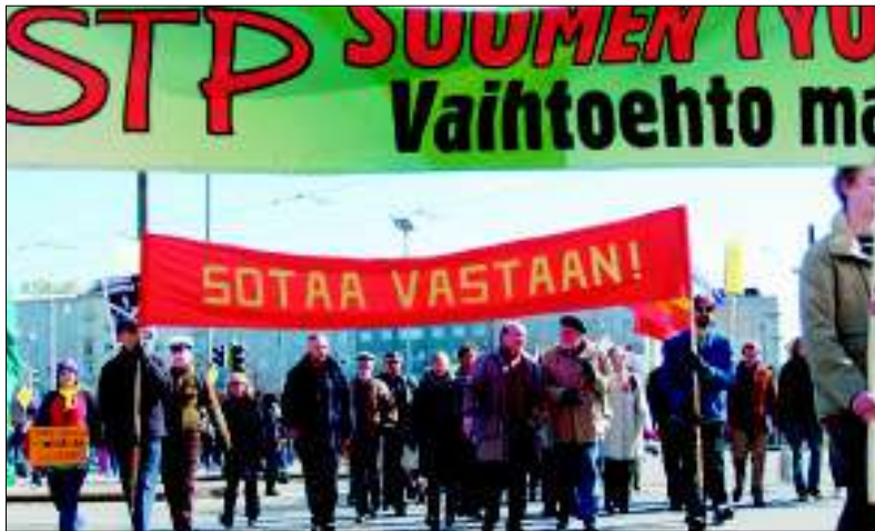
Kuvassa Suomen Työväenpuolueen kannattajia viime kevään vappumarssilla Helsingissä.

Suomen Työväenpuolue STP on viime kuukausina kampanjoinut STP:n rekisteröimiseen tarvittavien 5000 kannattajakortin keräämiseksi. Työtä on tehty kaduilla ja toreilla sekä perhe- ja tuttavapiireissä. Monia keskustelujia kampanjan yhteydessä on myös käyty. Vastustajien yksi "heitto" kuuluu, että "missä se työväestö on?" Monet asiaamme epäilevät eläkeläiset saattavat todeta, että "asia ei kuulu minulle, koska olen eläkeläinen".