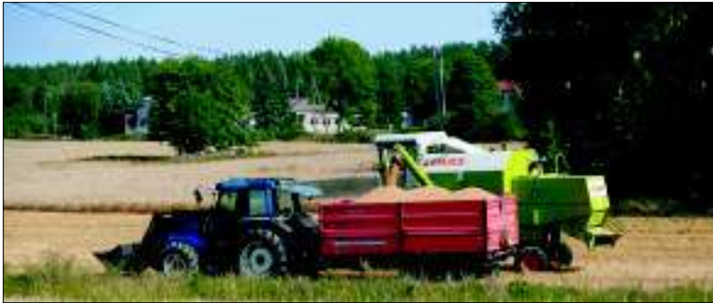
Viljankorjuu käynnissä Varsinais-Suomessa v. 2007.

Viljan hinta on ennätyskorkealla. Korkea viljan hinta parantaa ainakin hieman maatalouden kannattavuutta ja lisää viljelijän työmotivaatiota. Se aiheuttaa myös ongelmia erityisesti kehitysmaissa, missä ihmisten mahdollisuus ruuan hankintaan vähenee ja nälkähäädät lisääntyvät.