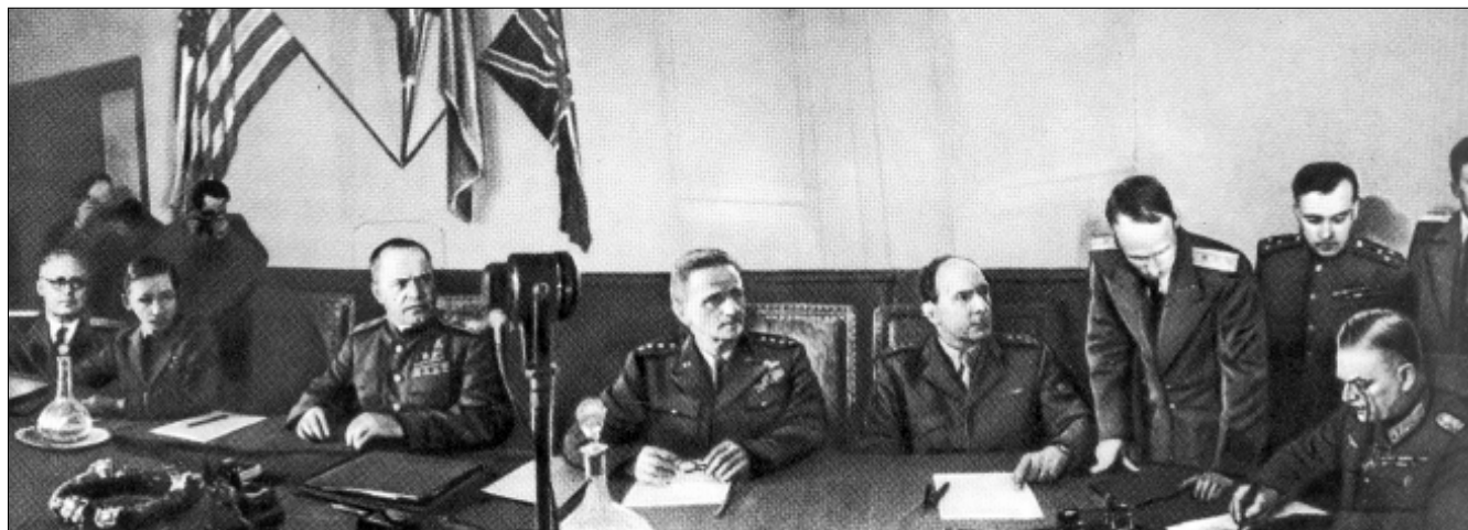
Saksan asevoimat allekirjoittavat antautumissopimuksensa toisessa maailmansodassa, joka lopetti vihollisuus Euroopassa. Antautumissopimus allekirjoitettiin 9.5. klo 00.30 Karlshorstissa itäisessä Berliinissä. Saksan puolelta allekirjoittajana oli marsalkka Keitel, äärimmäisenä oikealla ja Neuvostoliiton puolelta allekirjoittajana olimarsalkka Zukov, pöydän ääressä toinen oikealta.

Tätä varten keskitettiin todella suuret joukot. Kielekkeen sisällä Keski-rintamalla ja Voronetshin rintamalla oli 1,3 miljoonaa sotilasta, 20000 tykkiä, 3600 panssarivaunua ja 3000 lentokonetta. Lisäksi olivat Arorintaman joukot voimakkaana reservinä. Kurskin alueen asukkaat kavoivat yksistään 5000 km taisteluhautoja. Neuvostoliiton tiedustelu oli