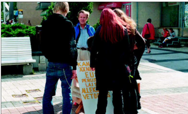
EU:n Vastainen Kansanrintama on keväästä lähtien järjestänyt tiedotuskampanjaa EU:n perustuslain merkeissä. Samalla olemme keränneet nimiä Eduskunnalle luovutettavaan adressiin, jossa vaadimme kansanäänestystä myös Suomessa EU:n perustuslaista. Tässä olemme Tikkurilassa 27.8.2005.

Heti EU:n perustuslain kaatumisen jälkeen EU törmäsi toiseen esteeseen. EU ei löytänyt budjettisopua. Etenkin Ranska ja Englanti riitelivät budjetista. Ranska vaati Englannin EU-maksujen