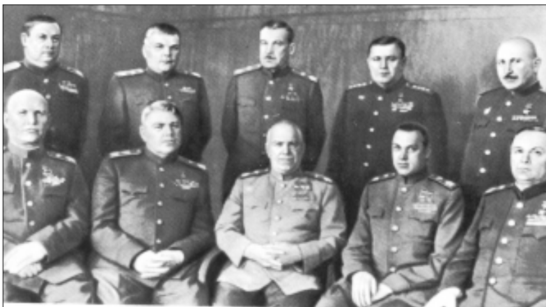
Neuvostoliiton legendaariset marsalkat ja kenraalit, jotka johtivat neuvostojoukkoja toisessa maailmansodassa. Sodan kuuluisimmat johtajat ovat ryhmittyneinä marsalkka Zukovin ympärille. Alarivissä vasemmalta kenraalit Konev ja Vasilevski, sitten Zukov ja hänestä oikealle kenraalit Rokossovski ja Vatutin.

Vuoden 1942 lopulla maassa toimi hyvin järjestetty sotatalous. Tämä oli toisen maailmansodan kuluissa tapahtuneen käänteen taloudellinen edellytys. Mutta tämä kaikki alkoi vaikuttaa täysipainoisesti vasta vuoden 1942 lopulla ja vielä kesällä 1942 puna-armeija koki kaluston puutetta. Tätä puutetta eivät ollenkaan korvanneet toimitukset USA:sta ja Englannista. Sotakaluston tuotannon kehitystä kuvaavat seuraavat luvut: Panssarivaunuja ja rynnäkö-tykkeitä toimivalla armeijalla oli käytössään joulukuussa -41 1731 kpl, marraskuussa -42 6014 kpl ja heinäkuussa -43 9580 kpl. Vastaavat luvut ajanmukaisten lentokoneiden osalta olivat 2495 kpl, 3088 kpl ja 8293 kpl sekä tykkien osalta 21983 kpl, 72505 kpl ja 98790 kpl. Näistä vuoden 1941 lukuja voi verrata siihen tietoon, että hyökätessään Neuvosto-