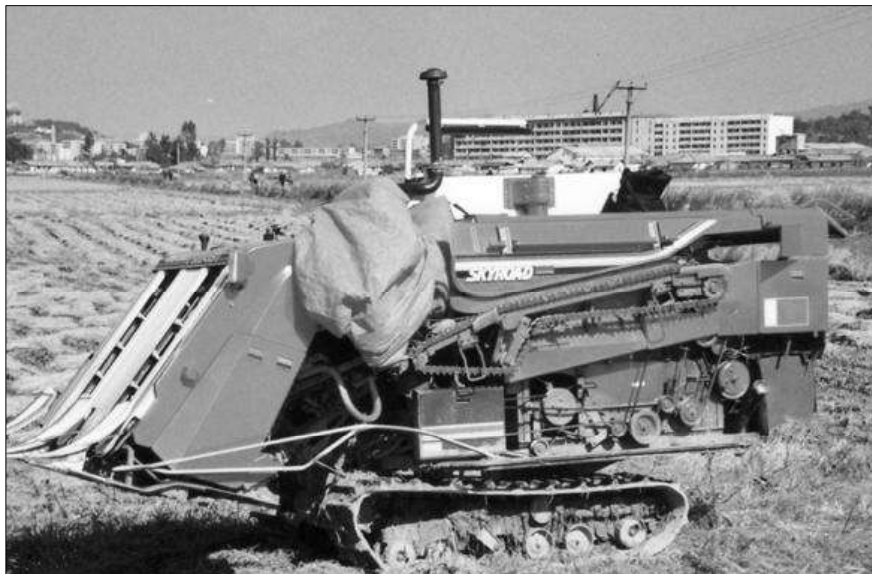
Tällaisen menopeliin utelias turisti törmäsi Pohjois-Koreassa v. 2002 lähellä Pjongjanga. Ilmeisesti vehkeellä on joain tekemistä riisinviljelyn kanssa.

Vuonna 2007 Korean demokraattista kansantasavaltaa vaivasivat jälleen kerran vakavat luonnononnettomuudet, tällä kertaa tulvat. Suuret sadonmenetykset heijastuivat vuoden 2008 elintarviketilanteeseen. Korea on hyvin vuoristoinen maa. Viljelyalaa on vain 17-18 % maan pinta-alasta eli n. 2 miljoonaa hehtaaria. Tuotantoalan laajentamiseen on hyvin rajallisen mahdollisuudet.