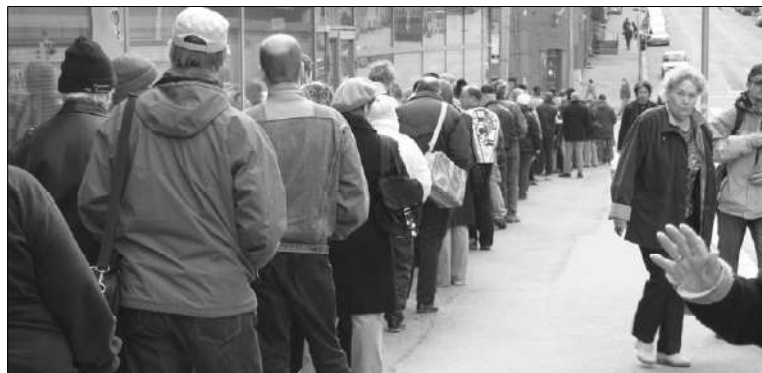
EK:n politiikka rikastuttaa rikkaita ja toisaalla luo köyhyyttä.

Se on kuulkaas Toverit sillä lailla, että jos joskus alkaa epäilyttää oma aate ja Vallankumouksen tarpeellisuus, niin menkääpä ja tutkikaa mitä Suomen elinkeinoelämä työlämältä odottaa, haaveilee ja vaatii. Takaan, niin totta kuin nimeni on Puskajussi, että jokainen ajatteleva Toveri tulee vakuuttuneeksi siitä seikasta, että työn ja pääoman välinen ristiriita on yhä olemassa, elää ja voi hyvin, eikä se todellakaan ole mihinkään katoamassa.