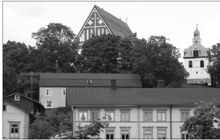
Tässä äskettäin poltettussa Porvoon tuomiokirkossa pidettiin 1809 Suomen ensimmäiset valtiopäivät, jossa sinetöitiin Suomen liittyminen autonomisena alueena Venäjään. Paikalla oli myös Venäjän tsaari Aleksanteri I. Siitä myös alkoi Suomen itsenäistymisprosessi.

Helsingin Vuosaaren rantaan pysähtyi 1770-luvun alussa laivue, jota johti Jacob Maunu Sprengtporten, Yrjö Maunun isovelji ja velipuoli, koska oli eri äidit. Tarkoituksena oli saada Suomen linna (silloinen Sveaborg) Kustaa II:n puolelle tämän vallankaappauksessa, mutta kova vastatuuli esti matkaa Porvoosta. Suomen linna sitten saatiin Kustaan puolelle, mutta vallankaappaus oli jo tapahtunut Tukholmassa.