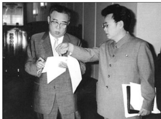
Kansansa suuresti arvostamat johtajat Kim Il Sung ja Kim Jong Il.

19. kesäkuuta Korean Demokraattisessa Kansantasavallassa muisteltiin Korean Työväenpuolueen Pääsihteerin Kim Jong Ilin työväenpuolueen keskuskomitean palvelukseen astumisen 43. vuosipäivää.