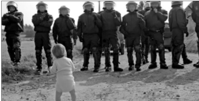
Nuori "mellakoitsija" yrittää ilmeisesti heittää kivellä Nato-harjoitettuja mellakkapoliiseja?

Kesäkuun alussa G8-maat (USA, Kanada, Japani, Iso-Britannia, Ranska, Saksa, Italia sekä Venäjä) pitivät huippukokouksensa Saksan Heiligendammissa. Johtavien imperiaalistien maiden johtajat hioivat vuosittain linjojaan, joita he ajavat koko maailmaa koskevissa talouselimissä, kuten WTO:ssa.