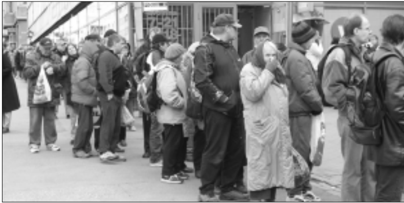
Leipäjonot eivät poistu Helsingin katukuvasta, vaikka laman jälkeistä nousukautta on jatkunut jo toistakymmentä vuotta. Kuva Helsinginkadulta.

Asiakkaan asialla –selvityksen mukaan: ”Näyttää siltä, että yhä useampi taloudellisissa vaikeuksissa elävistä asiakkaista joutuu kääntymään kirkon diakoniatyön puoleen ja hakemaan ruoka-apua. Näin myös silloin, kun asiakkailla olisi selkeästi ollut oikeus myös toimeentulotukeen, mikäli päättökentteeksi olisi järjestetty asiakaslähtöisemmin ja työntekijät olisivat perehtyneet asiak-