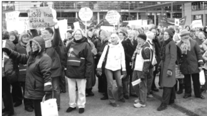
Kuva terveydenhoitoalan työntekijöiden mielenosoituksesta Narinkkorilla Helsingin Kampissa 14.11.2006, jolloin työntekijät voimallisesti vaativat parempia palkkoja itselleen.

Tulopoliittisia sopimuksia on Suomessa tehty 1960-luvun lopulta. Ensimmäinen varsinaisen tulopoliittinen kokonaisratkaisu (tupo), joka perustui kolmikantaan, (ammattilliset ja työntantajien keskusjärjestöt sekä hallitus) tehtiin vuonna 1969 valtakunnansovittelija Keijo Liinamaan johdolla (Liinamaa I).