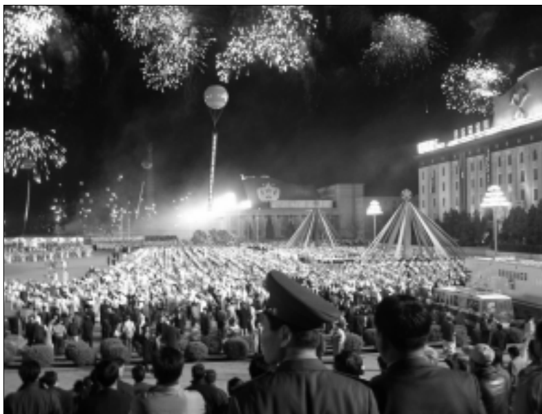
Ilotulitus Kim Il Sungin aukiolla 15.4.2007.

Pjongjangin kaupungin alueella asuu noin 2,7 miljoonaa ihmistä. Korean demokraattisessa kansantasavallassa valtio tarjoaa asunon ja ilmaisen koulutuksen kansalaisilleen. Pääkaupungissa asunot ovat enimmäkseen kaksioita, joiden parkeilla usein viljellään kukkia ja vihanneksia, esimerkiksi tomaattia,