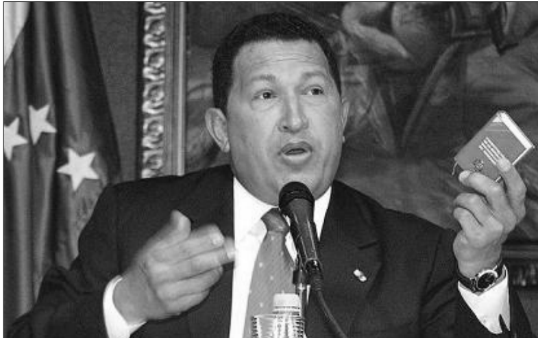
Venezuelan presidentti Hugo Chaves esittelemässä Venezuelalain perustuslakia, jonka pieneksi kirjaseksi painettua laitosta hän pitelee kädessään.

Artikla 1. Venezuelan bolivaarisen tasavallan perustamattomasti vapaa ja itsenäinen valtio, jonka moraalinen omaisuus ja arvot vapaudesta, tasa-arvosta, oikeudenmukaisuudesta ja kansainvälisestä rauhan perustuvat Vapaattaja Simón Bolívarin oppeihin. Sitoutumattomuus, vapaus, itsenäisyys, diplomaattinen ja alueellinen koskemattomuus sekä kansallinen itsemääräämisoikeus ovat kansan luovuttamattomia oikeuksia.