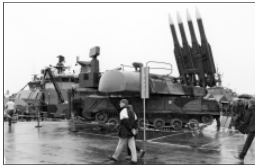
EU:n taistelujoukkoihin menemisen myötä myös suomalaisten olisi päästävä ulkomaille sotimaan. Siksi Suomen poliittinen johto haluaa muuttaa rauhanturvalakia.

Viime vuoden marraskuussa EU-maat sopivat Brysselissä 13 taistelujoukon perustamisesta. Määrä on selväsi suurempi kuin aiemmin kaavailtu 7-9. Kussakin joukossa on noin 1500 sotilasta. Puolustusministeri Seppo Kääriäinen vahvisti Suomen osallistumisen kahteen taistelujoukkoon. Kyseessä on erittäin merkittävä sotilaspoliittinen päätös, josta ei käyty minkäänlaisia parlamentaarista keskustelua tai äänestystä.