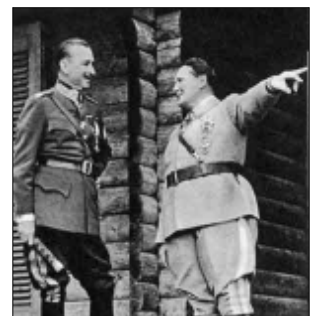
Mannerheim Hermann Göringin vieraana Saksassa kesällä 1942

Kesäkuun 30. päivänä Saksan yleisesikunnan päällikkö kenraali Halder vieraili Helsingissä Suomen hallituksen vieraana. Hänelle luovutettiin useita korkeita kunniamerkkejä ja ulkoministeri Erkkö piti puheen, jossa "tähdennettiin sitä hyväntahtoisuutta, jota Saksan armeija oli osoittanut Suomelle