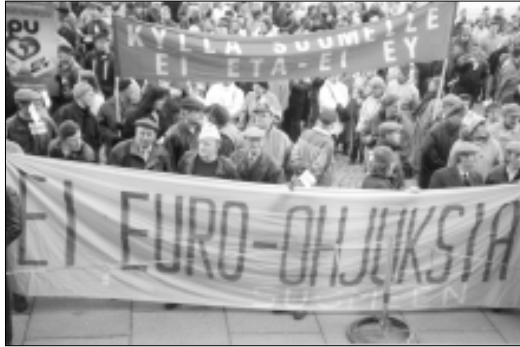
Kun Suomea liitettiin v. 1994 EU:hun, olivat mielenosoittajilla tunnuskina "Kyllä Suomelle - Ei ETA - Ei EY" ja "Ei Euro-ohjuksia". Eipähän ole tilanne kymmenessä vuodessa muuttunut miksikään.