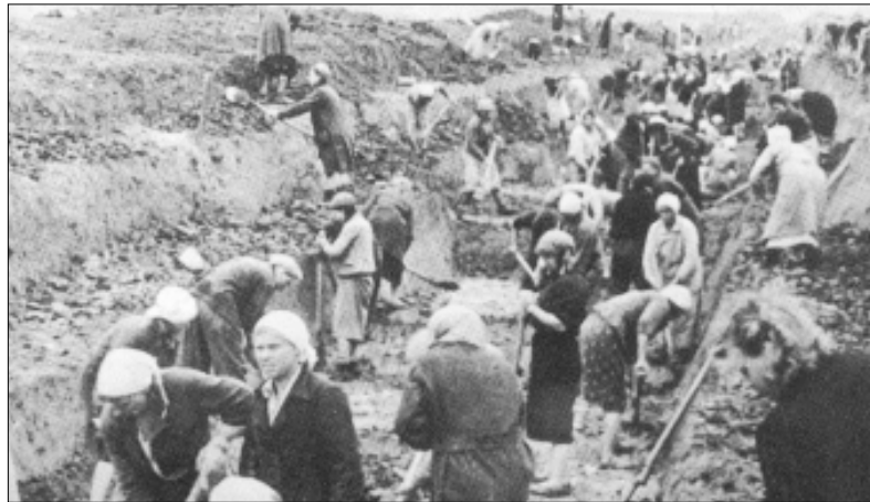
Natsi-Saksan hyökkäystä nousi torjumaan koko neuvostokansa. Miljoonat ja taas miljoonat ihmistä osallistuivat mm. linnoitustöihin.

Kansan äänen numerossa 1/05 aloitimme artikkelisarjan "Neuvostoliiton merkitys ihmiskunnalle". Vaikeista alkuvaiheista: ulkomaiden interventioista ja kansalaissodasta huolimatta talouselämä saavutti vuoteen -26 mennessä sotaa edeltäneen tason. Traktoreiden, autojen, lentokoneiden, maatalous- ja työstökoneiden tuotanto aloitettiin 30-luvun alkuvuosina. Goelro-suunnitelmaa (sähköistämissuunnitelmaa) ja maatalouden kollektiivisoitua toteutettiin menestyksellisesti ja Neuvostoliiton ulkopoliittinen merkitys kasvoi. Mutta sosialismin vastavoimat heräsivät ja fasistien aloittama maailmansota pakotti neuvostovallan jälleen siirtymään sotatalouteen.