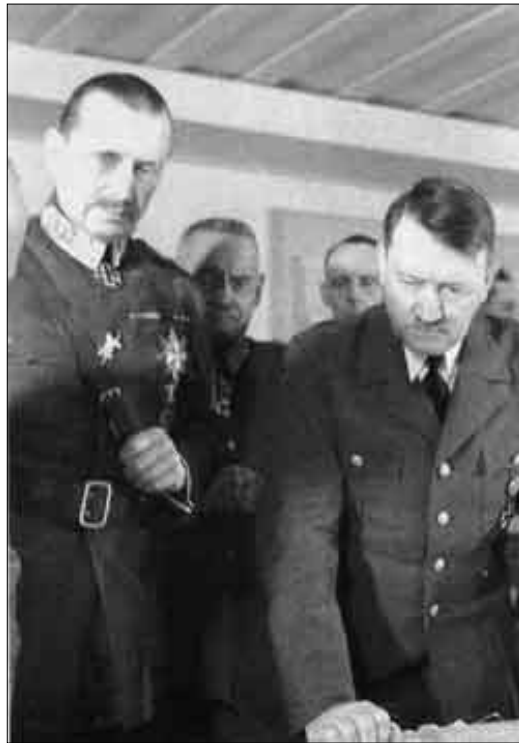
Hitler kävi Suomessa tervehtimässä Mannerheimia tämän 75-vuotispäivänä 4.6.1942. Vastavaroisesti Mannerheim kävi kesällä 1942 tervehtimässä Hitleriä Saksassa. Kuva tältä vierailulta.

Presidentti Tarja Halonen sai viime maaliskuussa aikaan melkoisen polemiikin, kun hän Ranskan ulkopoliittisessa instituutissa pitämässään puheessa lausui mm. seuraavaa: "Myös viisi vuotta myöhemmin, kesällä 1944, kykenimme pysäyttämään puna-armeijan yritykset valloittaa Suomi. Maatamme ei miehitetty missään vaiheessa, ei sodan aikana eikä sen jälkeen. Menetimme osan maastamme, mutta saavutimme torjuntavoiton. Säilytimme itsenäisyytemme sekä demokraattisen poliittisen järjestelmämme ja taloudellisen järjestelmämme. Meille maailmansota merkitsi erillissotaa Neuvostoliittoa vastaan, eikä meille syntynyt kitollisuudenvelkaa muita kohtaan."