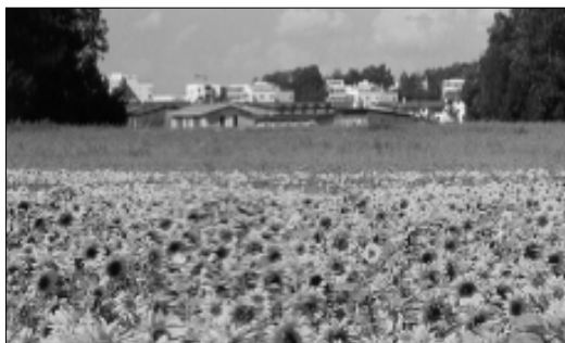
Pääkaupunkiseutu on yli miljoonan asukkaan yksi talousalue, jossa kuntien yhteistyö on täysin välttämätöntä. Helsingissä on huutava puute tonttimaasta. Kuva Viikistä, jossa yksi pelto on vielä jäljellä.

NATO:n hävittäjiä ja sotalaivoja emme saa päästää Helsinki-Vantaan lentokentälle ja valmistuvaan Vuosaaren satamaan. Ketään helsinkiläistä nuorta ei saa lähettää sotiin maamme rajojen ulkopuolelle. YK:n ja ETYJ:n hyväksymät rauhanturva tehtävät ovat oikea linja.