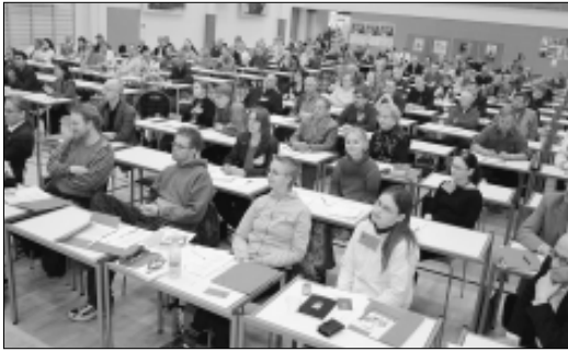
SKP:n edustajakokouksessa istuttiin kuin koulun penkillä.

Vantaalla 15.-16.5. pidetty SKP:n edustajakokous hyväksyi kunnallisohjelman "Toimintaan demokraattisen hyvinvointiyhteiskunnan puolesta" ja asiakirjan "Toisenlainen kansainvälisyys ja sosialismin näköalat". Poliittisen selostuksen kokoukselle esitti puheenjohtajaksi uudelleen valit-