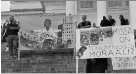
Terveystoimintapalvelut ovat saaneet väistyä kapitalismin kilpailukykyä alttarille.

Hallituksen ja kapitalistien huoli kansainvälisestä kilpailukykyä saa omituisia piirteitä, kun katsotaan vaikkapa hallituksen esittämä uudesta yritysverouudistuksesta, joka tuotiin julkisuuteen keskiviikkona 19. Uusi yhtiöverotus tulisi voimaan v. 2005 alusta.