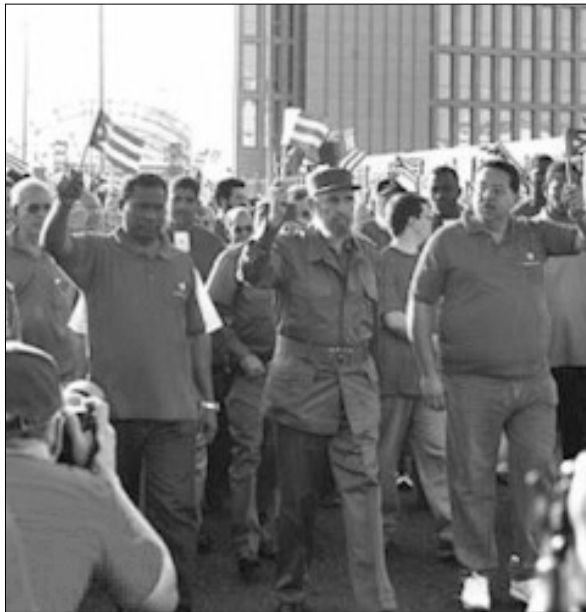
Fidel Castro johtamassa Havannassa 14.5.2004 järjestettyä mielenosoitusta USA:n uusia kiristystoimia vastaan. Mielenosoitukseen osallistui yli miljoona kuubalaista. Kysyä sopii, miksi myös EU on yhteisessä rintamassa USA:n kanssa painostamassa Kuubaa. Suomen hallitus tukee EU:n kantoja ja Hesarille kelpaa vain USA:n vainoharhainen informaatio Kuubasta.