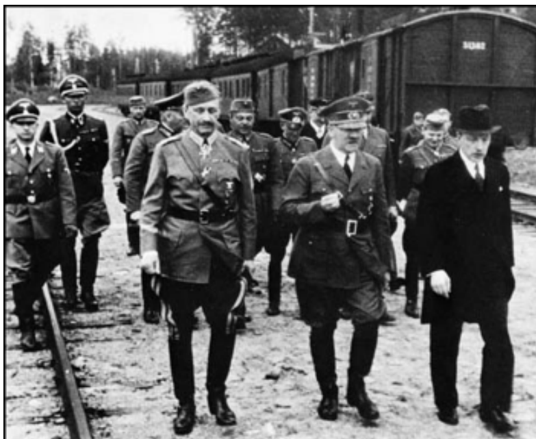
Hitler vierailulla Suomessa marsalkka Mannerheimin 70-vuotispäivillä 6.6.1942. Kuva kertoo kaiken Suomen ja Saksan liittolaisuudesta toisessa maailmansodassa jatkosodan aikana. Oikealla Risto Ryti.