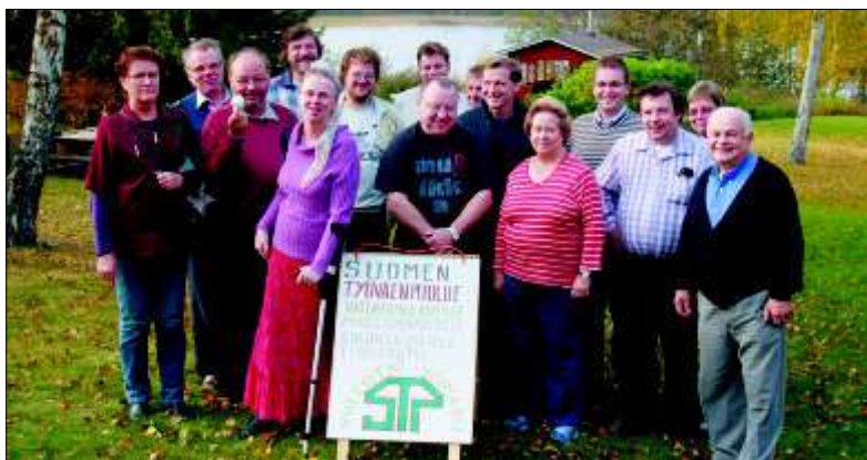
Kuva Vähäjärven seminaarista viime syyskuun lopulta. Silloin 5000 kannattajakorttia oli juuri saatu kerättyä ja kunnallisvaaliohjelman valmistelu aloi.

Suomen Työväenpuolue STP:n liittokokouksessa Helsingissä 20.4.2008 oli esillä normaalin liittokokousasioiden lisäksi puolueen periaateohjelman, sääntöjen ja kunnallisvaaliohjelman hyväksyminen.