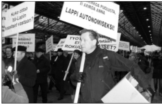
Globaali markkinatalous ei enää tunne edes omia toimintäsääntöjään. Tilanne ei ole kenenkään hallinnassa - ja työpaikat katoavat halvan työvoiman maihin.

Laki Rahoitustarkastuksesta (Rata) määrittelee rahoitustarkastuksen toiminnan tavoitteeksi rahoitusmarkkinoiden vakauden ja luottamuksen säilyminen rahoitusmarkkinoiden toimintaan. Ratan tehtävänä on valvoa sen valvottavaksi säädettyjen ja muiden rahoitusmarkkinoilla toimivien toimintaa sekä ohjata rahoitusmarkkinoilla toimivia noudattamaan toiminnassaan hyviä menettelytapoja.