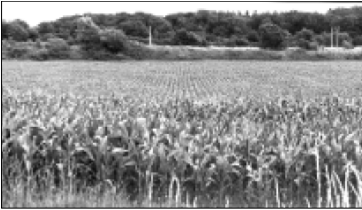
Tanskassa kasvaa, mutta Suomessa ei - vielä. Mutta sitten kun Suomessa kasvaa, tuleeko tänne pakolaisvirta siltä, missä ei kasva.

Julkisuudessa on kevään aikana nähty uutisia, jonka mukaan Suomi ja Suomen maatalous olisivat merkittäviä hyötyjiä ilmaston muutoksesta. Lämpötilan kasvu pohjoisilla alueilla lisää mahdollisuuksia monipuolisempaan viljelykasvilajistoon sekä parempiin saoihin. Ilmaston lämpeneminen tuo kuitenkin mukanaan tukon ongelmia, jolloin ennustetut positiiviset vaikutukset saattavat kääntyä negatiivisiksi.