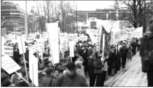
Oletus on, että nämä mielenosoittajat eivät ole kapitalisteja vaan kuuluvat työväenluokkaan.