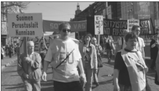
Suomen sotilaallista liittoutumista ja EU:n liittovaltioketjitystä kansa vastustaa. Jugoslavian sodat osoittavat, miten helposti Suomi saattaa joutua sodan osapuoleksi,

Suomella on tällä hetkellä kyseenalainen rooli Jugoslavian hajottamisessa. Entinen presidentti Martti Ahtisaari on antanut USA:n ja Naton operaation poliittiseksi arkkitehdiksi laatimalla suunnitelman Kosovon irrottamiseksi Serbiasta. Entinen ulkoministeri Ilkka Kanerva, poliittisen päämisen riivaamana, touhuu ympäri maailmaa Jugoslavian kriisin kärjistämiseksi ja Suomen sitomiseksi globaalin kapitalismin valloitus-sotaan.