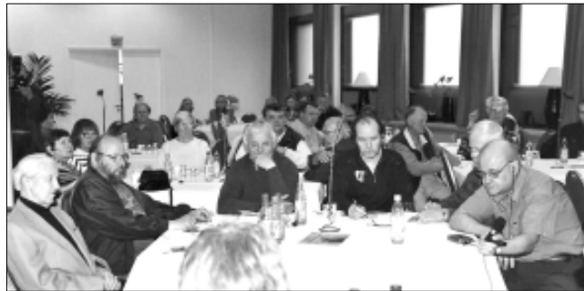
Tässä valmistaudutaan ensimmäisiin HOK-Elannon vaaleihin 4 vuotta sitten. Silloin SKP:n ja Kansan äänen porukat mahtuivat samalle vaalilistalle.

Alkuvuodesta pidetyissä HOK-Elannon edustajien vaaleissa ääniä annettiin kaikkiaan 136.689 eli äänestysaktiivisuus oli 26,8 prosenttia. Vaaleissa oli äänioikeutettuja kaikkiaan 509.696, mikä on 140.000 enemmän, kuin edellisissä vuonna 2003 toimitetuissa vaaleissa. Silloin äänesti 150.774 asiakasomistajaa ja äänestysviikkauus oli 41,1 prosenttia.