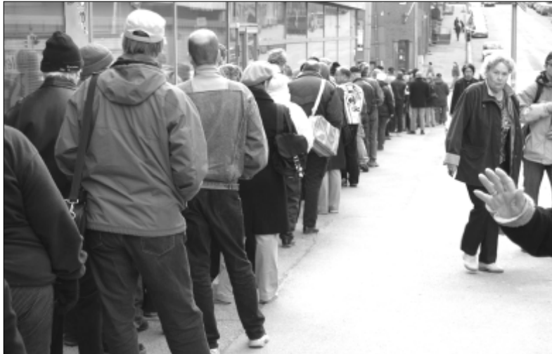
Leipäjonon Helsinginkadulla - ja vuosi on 2008.

Hallituksen kehysbudjetin tiedotteessa yhtenä aloituskonnan lukee "Työllisyys hallituksen ykkösaasia". Onkohan otsikossa pieni virhe? Hallituksen ykkösaasiana on aina ollut ja on nykyin "Luokkaetujen turvaa-