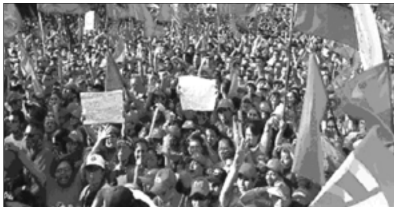
Venezuelalaiset ammattiliitot juhlimassa Venezuelan Yhdistyneen Sosialistisen Puolueen perustamista.

Presidentti Hugo Chávez ehdotti 15.12.2006 maansa vallankumouksellisten voimien yhdistämisen välineeksi ja sosialismin rakennustyötä varten Venezuelan Yhdistyneen Sosialistisen Puolueen (PSUV) perustamista. Puolueen varsinainen perustamiskokous pidettiin 2.11.2007.