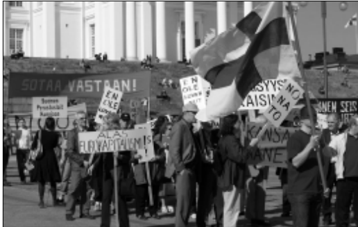
EU:n perustuslakia vastustettiin v.2005 ja 2006. Kansan mielipiteistä ei kuitenkaan välitetty mitään.

Saksa jatkoi vempulointia ja sen puheenjohtajakauden lopulla annettiin hallitusten väliselle konferenssille