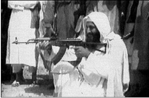
Terrorismi yhdistetään useimmiten Osama bin Ladeniin, mutta samaa voi sanoa myös George W. Bushista ja Ariel Sharonista.

Helmikuussa amerikkalainen uutistoimisto CNN esitti televisiossa kysymyksen kuinka terrorismin vastainen sota voitetaan? Kysymykseen sisältyy ajatus, että se on voitettavissa sotimalla. Jos CNN olisi kysynyt kuinka terrorismi lopetetaan, olisi päästy vastaamaan varsinaiseen asiaan ilman johdattelua.