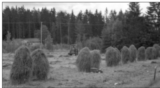
Suomen maaseutuun kuuluu oleellisesti vielä 50- ja 60-luvuilla heinäseipäät, ja maatalous elätti niukasti mutta kuitenkin miljoonia ihmistä. Tämä oli väärin, tämä ei enää vetele, sanoo 2000-luvun EU.