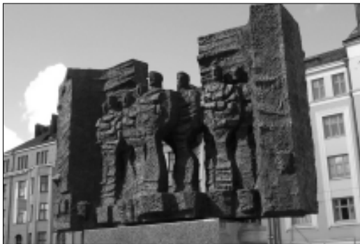
Kuvassa Tannerin patsas entisen Elannon pääkonttorin vieressä. Patsaassa Tanner kääntää selkensä työläisille. Nyt saman teki Elanto omille jäsenilleen.

Elanto myi omaisuuttaan alihintaan. Tästä on aiheutunut menetystä nykyhintatasolla 58 milj. euroa. Esitin vuonna 1995, että Elanto ei myisi asuntojaan, koska hinnat ovat alimmillaan ja hinnat ovat kääntymässä nousuun. Nyt asuntojen hinnat ovat nousseet yli kaksinkertaisiksi. Samoin Elannon 90-luvun puolella alihintaan myymien kiinteistöjen hinnat ovat nousseet. Tein asiasta laskelmat edustajistolle vuonna 2000. Tässä olen ottanut huomioon, että hinnat ovat sen jälkeen edelleen nousseet. On tietysti eri asia, saako täyttää