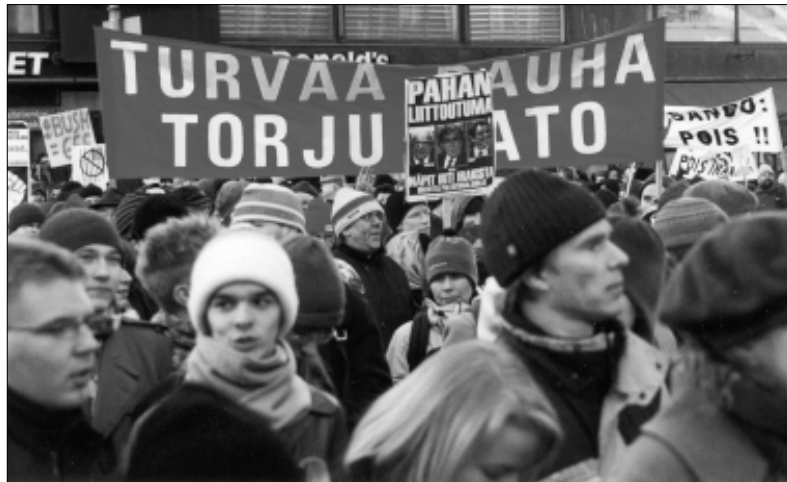
Kansan suuri enemmistö vastustaa Natoa. Ja sehän risoo poliittista eliittiä.

Jo vuonna 1995 silloinen puolustusvoimien komentaja Gustav Hägglund visioi että “Tämä Pohjolan prikaati voisi ottaa joukkoja muistakin maista, kuten Baltiasta. Tämä EU on nyt meidän perheemme ja jaamme yhteisen kohtalon vähän joka suhteessa.