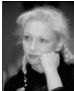
Ritva Sorvali näyttelijä Lahti