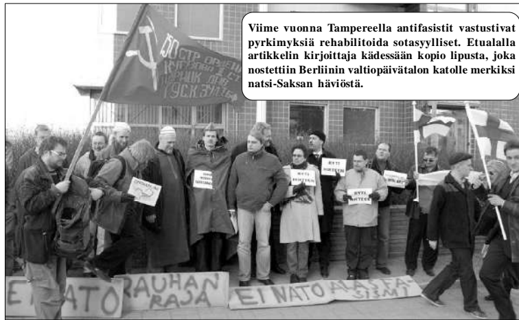
Viime vuonna Tampereella antifasistit vastustivat pyrkimyksiä rehabilitoida sotasylliset. Etualalla artikkelin kirjoittaja kädessään kopio lipusta, joka nostettiin Berliiniin valtiopäivätalon katolle merkiksi natsi-Saksan häviöstä.

Kohdassa 3 saksalaiset esittivät kahden saksalaisen divisioonan hyökkäyksen Sallan kautta Kantalahteen ja pyysivät kahta suomalaista divisioonaa suojajoukoiksi. Suomalaisen edustaja Heinrichs