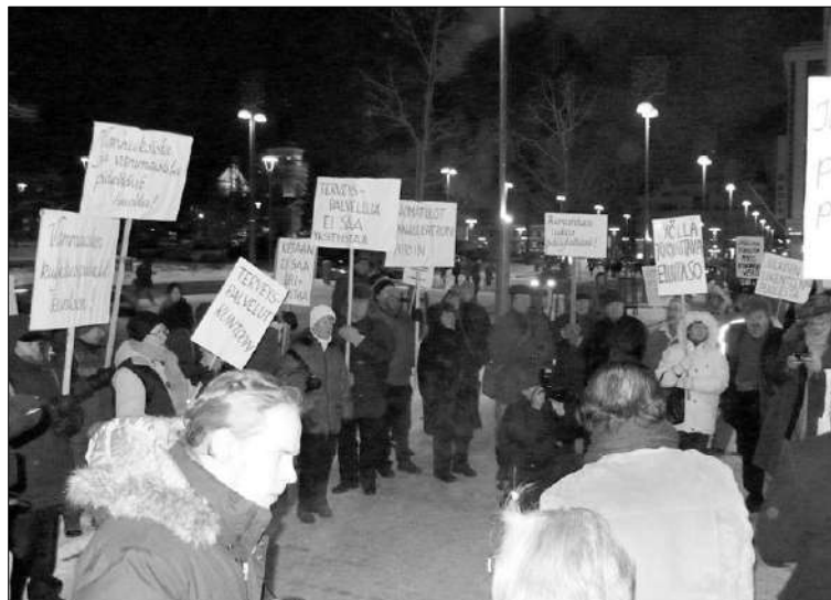
Myöskään Tampereella ei enää hyväksytä jatkuvia leikkauksia. "Pelastetaan Tampere asukkaille"- liike järjesti mielenilmauksen kaupungintalon edessä. Vaadittiin mm. vanhusten hoidon turvaamista

Jo vuosien ajan Tampere on ollut maanlaajuisissa kyselyissä Suomen vetovoimaisin kaupunkialue. Tampere onkin onnistunut luomaan itsestään kuvan avoimena, trendikkäänä ja kodikkaana ympäristönä, joka ei rutista uusia tulokkaita massiivisuudellaan pääkaupunkiseudun tapaan. Tämä vetovoimaisuus saattaa kuitenkin olla vain näennäistä, sillä Tampereen harjoittama leikkauspolitiikka on viemässä palvelut asukkaiden ulottuvilta.