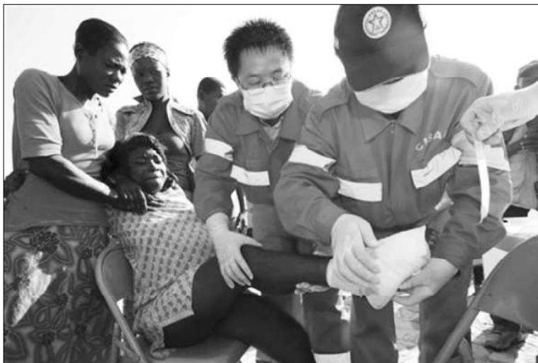
Monet kehitysmaat ovat osallistuneet Haitin katastrofin jälkihoitoon todellisina auttajina mm. Kuuba, Venezuela. Kuvassa Kiinalaiset lääkärityöntekijät Haitin tuhoalueella