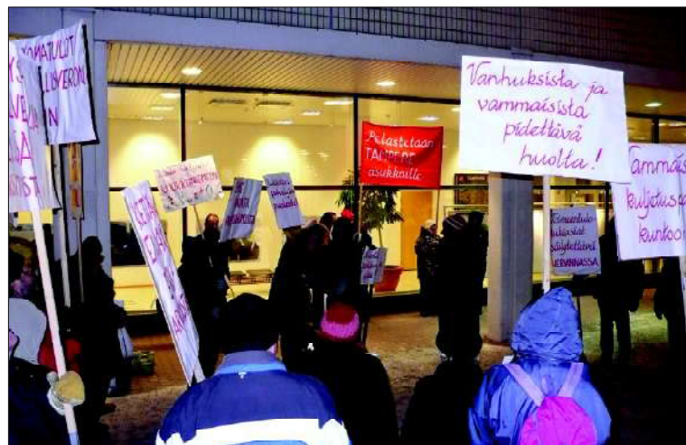
Tampereelle on aloitettu kansanliikkeen kehittäminen. Vaaditaan mm. huolehtimaan vammaisista ja vanhuksista

tärkeä rakentaa kansainvälinen maineensa siten, että olemme maa, joka edistää rauhaa aina ja kaikkialla. Emme ole osapuoli suurvaltojen eturistiriidoissa tai muissa konflikteissa vaan olemme edistämässä sovitteluratkaisujen saa-