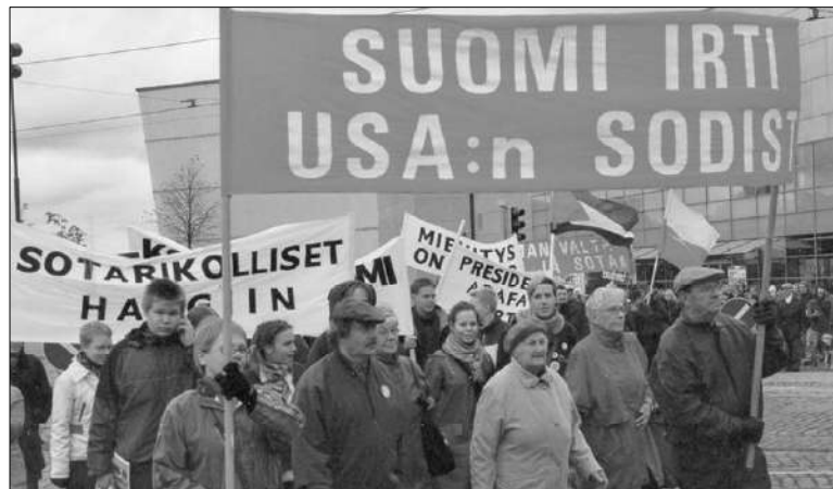
Valtaosa kansaa vastustaa Nato-jäsenyyttä. Tästä huolimatta ääriporvarit eivät ole luopuneet tavoitteistaan. Olkaa valmiina.