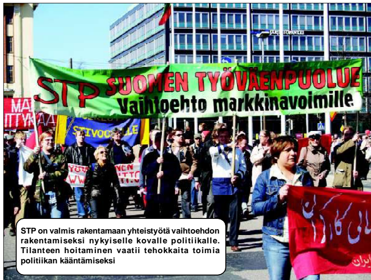
STP on valmis rakentamaan yhteistyötä vaihtoehdon rakentamiseksi nykyiselle kovalle poliittiselle. Tilanteen hoitaminen vaatii tehokkaita toimia politiikan kääntämiseksi