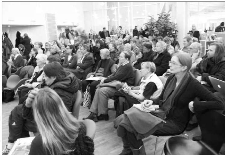
Vallilassa vaadittiin kirjaston säilyttämistä. Kuka puhui vanhusten puolesta?!

lutalet tulevat täyttämään psykiatrisilla potilailla ja demen-tikoilla. Arvot näkyvät päätöksissä ja asukkaat ovat syyttä kysyneet, perustuvatko tehdyt suunnitelmat todellisiin säästöihin ja vanhusten kunnioitukseen.