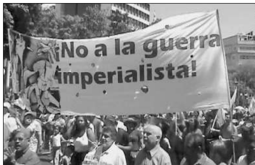
Imperialismin vastainen mielenosoitus Caracasissa