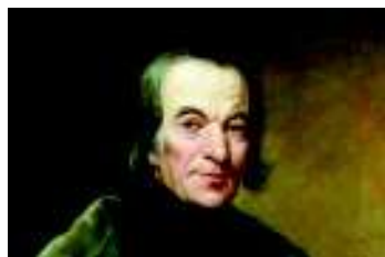
Robert Owen, osuustoiminnan pioneeri

HOK-Elannon vaalien myötä osuuskauppatoimintaa kiinnitetään jälleen suuremmin huomiota. Siksi kannattaa nostaa esille eräs sen keskeisistä perustajista, walesilainen tehtiilija Robert Owen (1771-1858). Paitsi osuusliikkeen perustaja Owen oli myös merkittävä utopistisocialisti, joka näki aikaansa teollisen vallankumouksen suurena mahdollisuutena. Se voisi taata ihmisarvoisen elämän koko kansalle eikä vain sen pienelle kapitalistiselle eliitille.