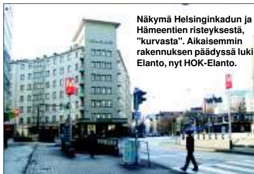
Näkymä Helsinginkadun ja Hämeentien risteyksestä, "kurvasta". Aikaisemmin rakennuksen päädyssä luki Elanto, nyt HOK-Elanto.