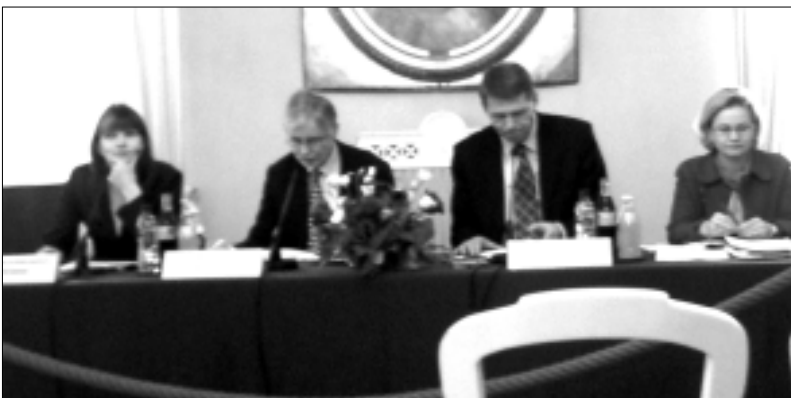
Ministerit Matti Vanhanen, Erkki Tuomioja ja Mari Kiviniemi selvittävät Suomen EU-puheenjohtajakauden päätavoitteita. Ne ovat EU:n perustuslain ja palveludirektiivin hyväksyminen.

Pääministeri Matti Vanhanen järjesti 2. helmikuuta tiedotus- ja keskustelutilaisuuden kansalaisjärjestöille Smolnan talossa Helsingissä. Tilaisuuden aiheena oli kuulla kansalaisjärjestöiltä evästyksiä Suomen heinäkuussa alkavaa EU:n puheenjohtajakautta silmällä pitäen. Paikalle olikin saapunut reilut 70 eri kansalaisjärjestöjen edustajaa. Allekirjoittanut edusti tilaisuudessa EU:n Vastaista kansanrintamaa. Vastajien puolella olivat Vanhasen