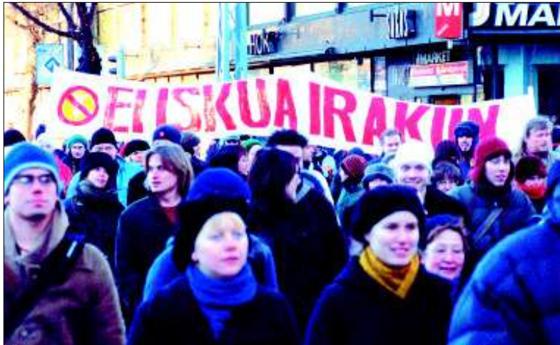
Ihmiset ovat vastustaneet USA:n uhkapeliä, mutta Bush tuntuu vain kohottavan panoksiaan. Vain pari vuotta sitten USA hyökkäsi Irakiin ja nyt uhkailaan hyökkäyksellä Iraniin. Uhkapeluri ryöstää pelinsä rahat vanhustenhoidosta ja terveydenhoidosta. Panoksena on koko USA:n ja maailmantalous.

Bush ei saanut läpi esitystään eläkkeiden leikkaamisesta vuonna 2005 eikä salakuuntelun laillistamista terrorismin vastaiseen sotaan vedoten. Republikaanitkaan eivät tätä hyväksyneet, koska se loukkaisi perustuslaatuista yksilön vapautta. Nixon ja hänen Vietnam-sotapoli-