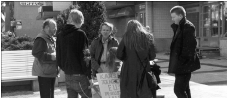
EU:n Vastaisen Kansanrintaman katutilaisuus Tikkurilassa. Tässä ihmiset allekirjoittavat nimiään EU:n perustuslaista kansanäänestystä vaativaan adressiin.

Tosiasiassa EU:n perustuslaki muuttaa monia asioita, jotka koskevat Suomen asemaa ja EU:n perusluonnetta. Ensiksikin perustuslailla perustetaan uusi Euroopan Unioni, joka "sovittaa yhteen jäsenvaltioidensa politiikat". Tämä uusi EU on "oikeushenkilö" – käytännössä valtio – joka voi solmia kansainvälisiä sopimuksia jäsenvaltioiden puolesta. Määräenemmistö päätösten käyttöönotto EU:n päätöksenteossa