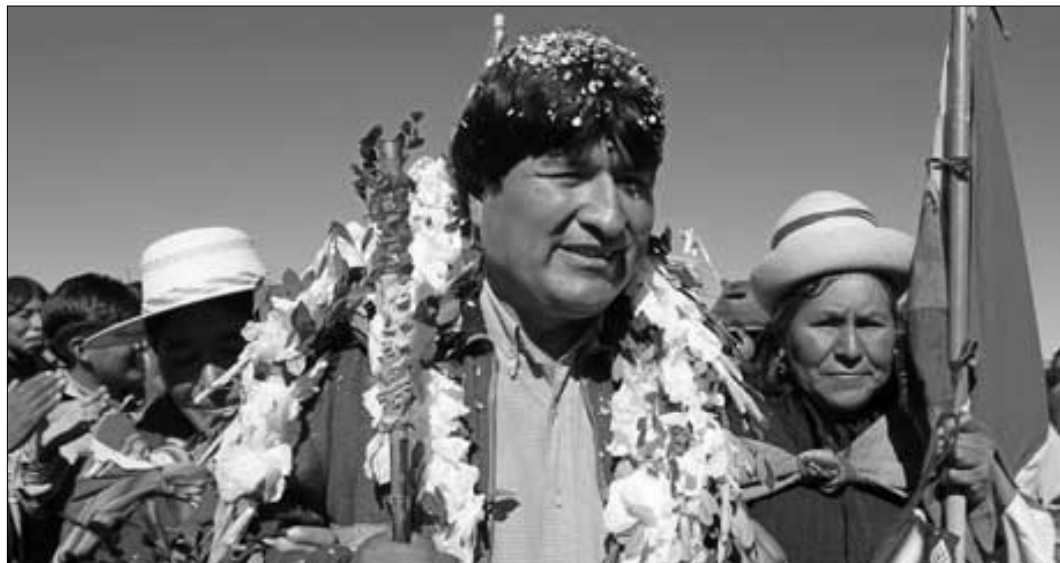
Bolivian alkuperäisestä intiaaniväestöstä lähtöisin oleva presidentti Evo Morales on liittänyt maansa siihen Latinalaisessa Amerikassa yhä vahvistuvaan imperialismin vastaiseen rintamaan, joka vaatii maansa luonnonvaroja kansan hallintaan, että niistä hyötyy myös tavallinen kansa arkielämässään ( kummallisen erilaista nyky-Suomeen verraten).

USA on harjoittanut Latinalaisen Amerikan alueella yli 100 vuotta omaehtoista talous- ja sotapolitiikkaa sekä juurruttanut sinne omaa kulttuuriaan. Se on pystyttänyt ja hajottanut mielensä mukaan demokraattisia hallituksia ja sotilasjunttia. Jenkit ovat todentaneet ja lujittaneet valtaansa miehityksillä, vallankaappauksilla, massa- ja salamurhilla, kuolemanpartioilla sekä hankalien henkilöiden katoamisilla. USA on aina himoinnut pääsevänsä vapaasti käsiksi Latinalaisen Amerikan luonnonvaroihin ja markkinoihin.