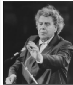
Kreikkalainen kuuluisa säveltäjä Mikis Theodorakis

Oheinen artikkeli on julkaistu ruotsalaisessa "Proletär" -lehdessä 18.1-2006. Tunnettu kreikkalainen säveltäjä Mikis Theodorakis on laatinut seuraavan julkilausuman koskien Euroopan Neuvoston anti-kommunistista päätöstä: