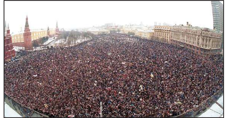
Maneesiaukiolle 23.2.1991 kokoontui 250000 ihmistä. Tällaista ei ole tapahtunut koskaan aiemmin ja he kaikki antoivat tukensa Neuvostoliiton säilyttämiselle

Persut ovat väittäneet kuntavaaleissa olevan kyseessä hallituksen kaatuminen tai eläminen. Vähänkin politiikkaa seuraava tietää kuntavaaleissa päätettävän vain, ketkä käyttävät ja sijoittavat, toivottavasti kuntalaisten hyväksi. Rahaa kyllä Suomesta löytyy, on vain kyse miten ja mihin sitä käytetään. Jos it-