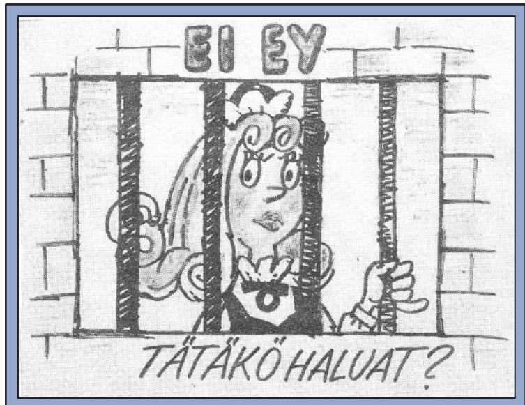
Irti Euroopan Unionista julkaisussa v. 1992 julkaisimme kuvan ja tekstin "EY tulee olemaan kansojen vankila"

Koronakriisiä tekosyynä käyttäen on EU pakottamassa kaikki jäsenmaansa osallistumaan mittavaan elpymisrahastoon, joka tosiasiallisesti on johtamassa Euroopan liittovaltioon. Käsillä oleva liittovaltiokehitys tulee johtamaan vääjäämättä uusiin elvytyspaketteihin, EU:n yhteisiin velkakirjoihin eli niin sanottuihin eurobondeihin ja lopulta fiskaaliunioniin eli EU:n laajuisen yhteisen ja pysyvän verotus- ja tulonsiirtojärjestelmän luomiseen. Pääministeri Sanna Marin on sanonut, että EU-elvytysrahaston keskeisimmän lahjarahojen saajan Italian aut-