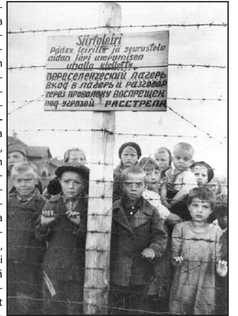
Kuva lapsivangeista Petroskoin keskitysleirillä kesällä 1944.

Historian vääriste- ly on mennyt liian pitkälle ja vastaus on tulossa. Venäjä on aloittamassa projektin "Ei vanhene koskaan", jossa Itä-Karjalan tapahtumat määritellään kansanmurhaksi ja keskitysleirit kuolemanleireiksi. Kiistatonta on, että suomalaiset halusivat Itä-Karjalan etnistä puhdistusta eli venäläisten kansanmurhaa.