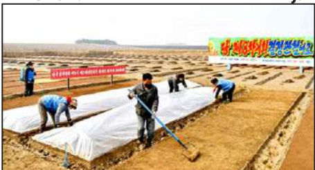
Etelä-Hwanghaen maakunnan osuuskuntatilat aloittivat riisintaimien istutuksen. Taimituotanto aloitettiin myös Yonbaekin ja Jaeryongin tasangoilla ja muilla maakunnan osuuskuntatilojen pelloilla.

Merkillepantavaa on se, että Kim Jong Un painotti palvelujen valtiojohtoisuutta sekä tarvetta säilyttää sosialistisen palvelukulttuurin ja palauttaa valtion johto ja valvonta tällä alalla. Hän kutsuu tätä tärkeäksi tehtäväksi, joka on ratkaistava kaikin keinoin.