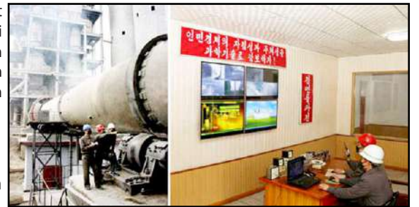
KDKT:ssä toimii lähes 10 sementtitehdasta. Manphon sementtitehdas tutkii keinoja kierrättää kaikki teollisuusjätteet. He ovat jo tehneet korvaavaa kipsiä ja tutkineet sen käyttöä tuotannossa. On perustettu prosessi kivihiilen kierrätykseen ja käytetty tuotteita sementin muuntamiseen. Koko ajan pyritään parantamaan prosesseja "jätteiden" talteenottamiseksi edelleen.

Kim Jong Un myös torjui ajatuksen , jonka mukaan hänen KDKT:n on valittava vahvan sotilaallisen arsenaalin ja diplomatian tavoittelun välillä, mikä heijastaa hänen vuoden 2013 ilmoitustaan talouden ja ydinaseiden rinnakkaisesta kehityksestä. Hän totesi, että diplomatia on tehokkaampaa, jos sitä harjoitetaan sotilaallisesta asemasta. Kim Jong Unin mukaan tällainen