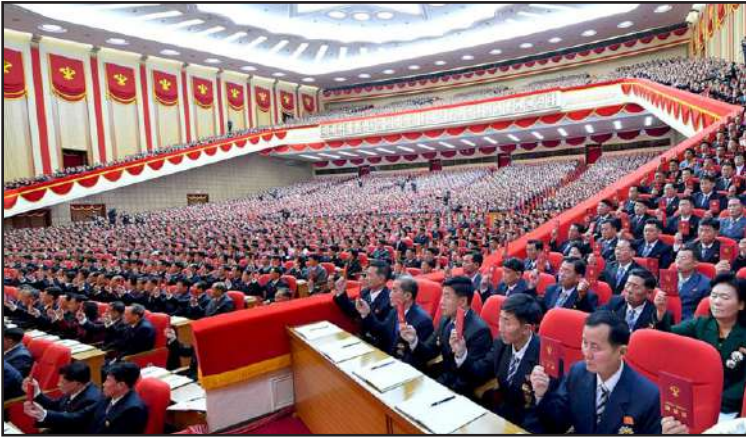
Pohjois-Koreassa on yli 25,5 miljoonaa asukasta. Puolueen ylimmän päättävän elimen edustajakokous on suuri joukkotapahtuma. Tässä 8:nnessä puoluekokouksessa kokousedustajia oli noin 5000 ja kokousedustajia noin 2000.

Korean työväenpuoleen 8. edustajakokous pidettiin tammikuussa Pjongjangissa. Edustajakokoukset ovat merkittäviä tapahtumia, sillä niissä analysoidaan menneisyyden työtä ja asetetaan strategisia tavoitteita lähi- ja keskipitkälle aikavälille. Edelliseen kokoukseen verrattuna tämän vuotinen kokous kesti kolme päivää pidempään ja siihen osallistui aikaisempaa enemmän puoluekokousedustajia. Edustajia oli 5000 ja tarkkailijoita 2000. Kim Jong Un myönsi avauspuheessaan, että viisivuotissuunnitelma oli jäänyt tavoitteista melkein jokaisella sektorilla ja olemme saaneet katkeraa oppia. Hän kuitenkin jatkoi, että puolue muutti vihollisen ankarat pakotteet kultaiseksi tilaisuudeksi lisätä omavaraisuutta. Vaikka strategisia tavoitteita taloudellisen rakentamisen alalla ei saavutettu, luotiin arvokas perusta kestäväälle taloudelliselle kehitykselle omiin voimiin luottaen.