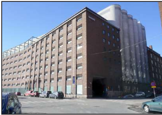
Nato:n ja EU:n hybridiosaamiskeskus sijaitsee Helsingin Lintulahdessa Senaatin kiinteistössä. Mitä siellä tehdään, on epäselvää. Suunnitellaanko "täyden sprekin pelottelua ja disinformaatiota?" (Naton pääsihteeri Rasmussen 19.6.2014)

Suomen kohtalonkysymys on aina ollut suhteet Venäjään. Historia on osoittanut että hyvät, luottamukselliset suhteet Venäjään