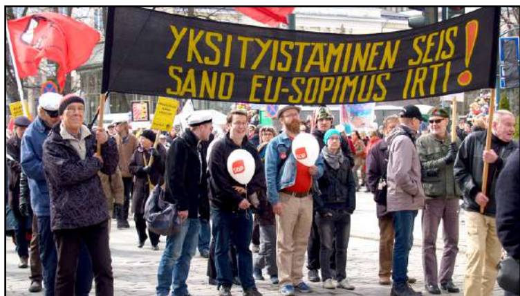
EU:n tavaramerkki on yksityistäminen ja EU on uusliberalistisen politiikan synonyymi. Uusliberalismi ja EU tulee kaataa yhdessä ja nyky-muotoisen kapitalismin instrumenttina toimiva EU lakkaa olemasta.