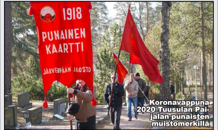
Koronavappuna 2020 Tuusulan Pajalan punaisten muistomerkillä