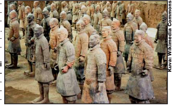
Jo eläessään Qin-dynastian keisariksi julistautunut Qin Shi Huangdi alkoi rakennuttaa itselleen hautamuistomerkkiä, jota "vartioimaan" valmistettiin 8000 terrakotta sotilasta. Mämä monumentit korostivat omistajaluokan auktoriteettia ja pysyvyyttä.

Sui- ja Tang-dynastian aikana aateliston asema vaihteli. Talonpoikien laillinen asema muut-